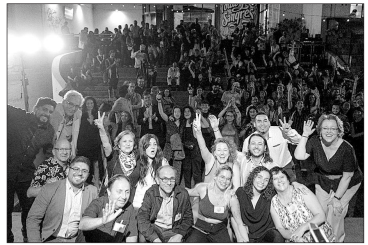
Asistentes a la fiesta de celebración del 30º aniversario del CCE Santiago.