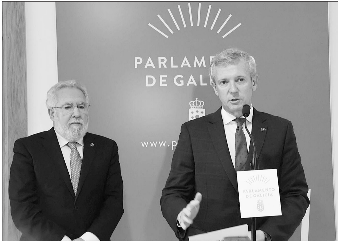
Alfonso Rueda, con el presidente del Parlamento gallego, Miguel Santalices, en el acto en el que le trasladó la rueda de consultas con los partidos políticos con representación en la Cámara gallega.

“En el discurso de investidura intentaré adelantar un poco cómo lo quiero hacer”, dijo, respecto a la estructura, que necesita cambios, apostilló, al tiempo que pidió paciencia para que sean los miembros del Parlamento los primeros en enterarse de sus planes para el nuevo mandato.