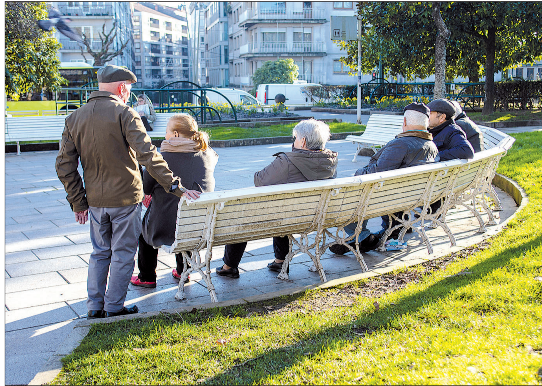
Las personas de la tercera edad en Galicia disfrutan de una alta calidad de vida gracias a las ayudas de la Xunta.

tengan reconocida ni su capacidad económica. Se podrán beneficiar de ello de modo automático los que ya venían disfrutando de una libranza en el entorno familiar, así como los que gozaban de un servicio de atención distinto y querían pasarse al Bono Cuidado en el Hogar.