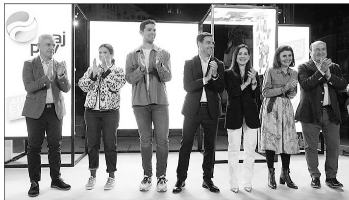
El actual lehendakari, Iñigo Urkullu, apoyó al candidato del PNV, Imanol Pradales, el pasado jueves, en el inicio de la campaña electoral.

El CIS desvela que sería el PNV, liderado en esta ocasión por Imanol Pradales, el partido