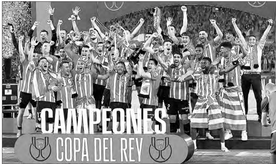
Los jugadores del Athletic celebran la Copa conquistada.

El Athletic se hizo con la vigésima cuarta Copa del Rey de su historia después de remontar la final ante el Mallorca e imponerse en la tanda de penaltis en la que Agirrezabala y Berenguer fueron los héroes roji-blancos, el primero por parar uno de los dos que falló el Mallorca y el segundo por anotar el lanzamiento que pone a este equipo, con derecho propio, en la historia centenaria del club bilbaíno.