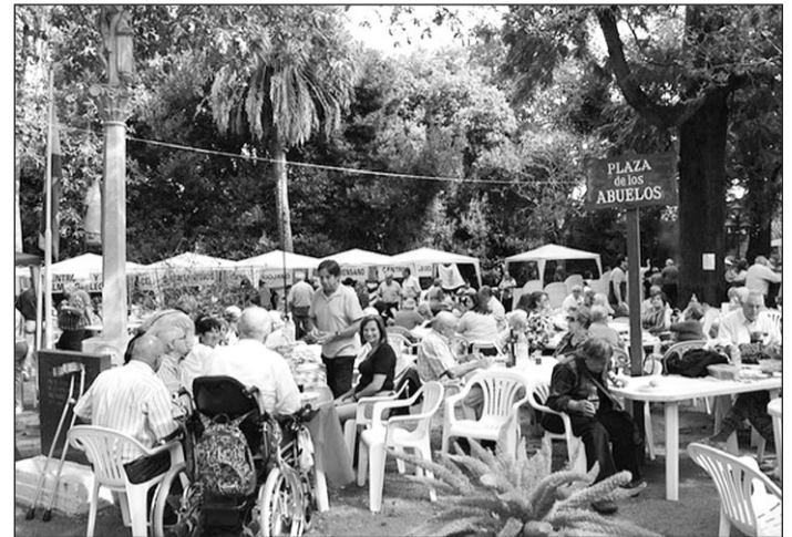
Pueden solicitar las ayudas las entidades del exterior cuyo fin sea la asistencia social, sanitaria y sociocultural. GM

En el apartado de gastos de funcionamiento se incluye el pago al personal vinculado a la actividad subvencionada, alquiler de local, electricidad, gas, agua, línea telefónica de voz y de datos, material informático y de oficina de carácter fungible o consumible y otros de similar naturaleza.