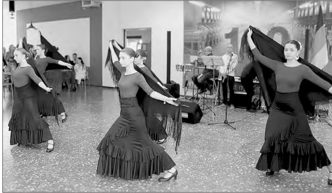
Tras la comida, tuvieron lugar diversas actuaciones de los grupos de baile flamenco.

Al igual que el año anterior, el evento comenzó a las 12 del mediodía con un saludo del presidente de la Coordinadora Federal, Antonio Espinosa Segovia, quien es además miembro del Consejo General de la Ciudadanía Española en el Exterior (CGCEE). Éste dio la bienvenida a las partici-