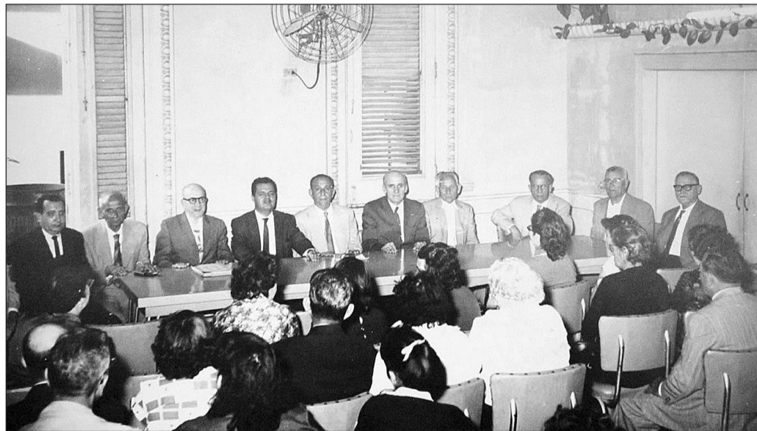
Acto de la firma de fusión de las entidades de Roupar y Lousada en La Habana en 1957.

ciación, se divulgan los de otra creada también en la ciudad de La Habana por emigrantes de Santo André de Lousada (Xermade, Lugo). La entidad, que se fundó en 1916 bajo el nombre 'Progreso de Lousada, Sociedad Cultural y de Socorros Mutuos', tenía como propósito fomentar la instrucción gratuita en ese municipio, un objetivo que se concretó en la apertura en 1918 de la escuela de Pazo. Posteriormente, en 1931, renovó sus estatutos, cambió su denominación por la de 'Progreso de Lousada. Sociedad Cultural y de Socorros Mutuos' y transformó su finalidad principal para en-