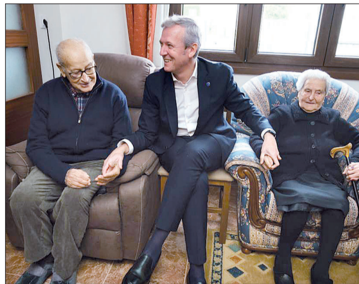
El presidente Alfonso Rueda, durante un encuentro con mayores en Rois.

La Xunta considera que en los últimos años se ha dado un fuerte impulso a este ámbito con la crea-