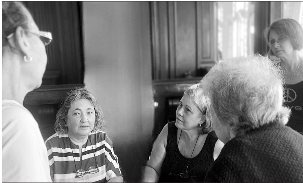
La Secretaría Xeral destina 30.000 euros a atender situaciones sobrevenidas en el núcleo familiar.