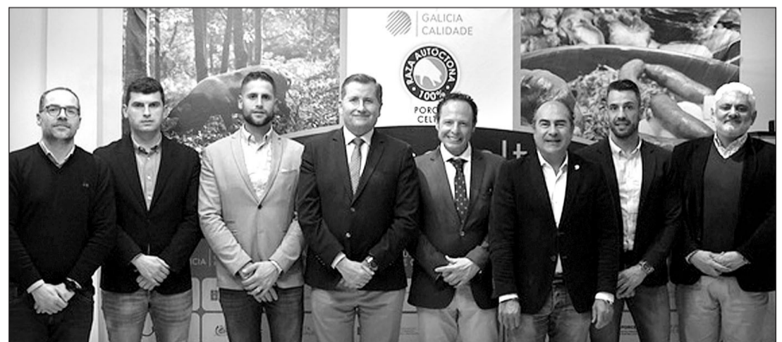
Asistentes a la presentación de la segunda edición de Porco Celta en la Casa de Galicia de Madrid.

"Esta es una convocatoria especial para nosotros porque, a pesar