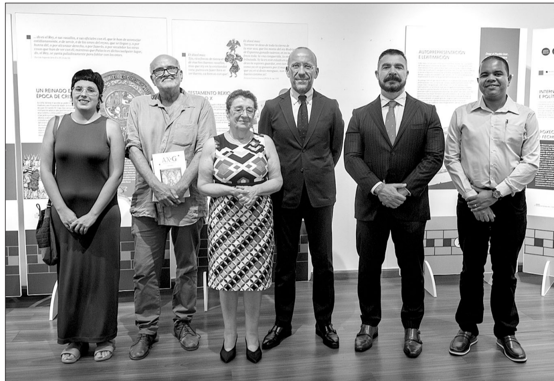
La presidenta del Consello da Cultura Galega —en el centro—, entre otros, durante la inauguración de la muestra.

La exposición no sigue un relato cronológico, sino que busca presentar a Alfonso X en su dimensión más humana, para dar a