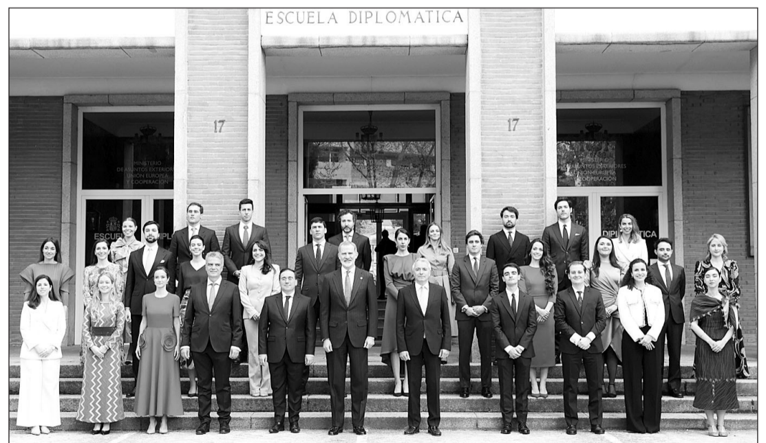
El Rey y el resto de autoridades posan con los nuevos secretarios de embajada.

Albares ha subrayado que, "por segundo año consecutivo, tenemos una promoción con más mujeres que hombres", y se ha comprometido a avanzar hacia la paridad, un objetivo que ha calificado de "legítimo". En su discurso, el jefe de la diplomacia española ha reivindicado el "prestigio de España" y el prestigio del cuerpo diplomático español, "que ha sabido ganarse el respeto y el aprecio internacional". A continuación, ha animado a los nuevos diplomáticos a promover y proyectar los valores de España en el mundo, así como su "riqueza cultural" y su "riqueza lingüística".