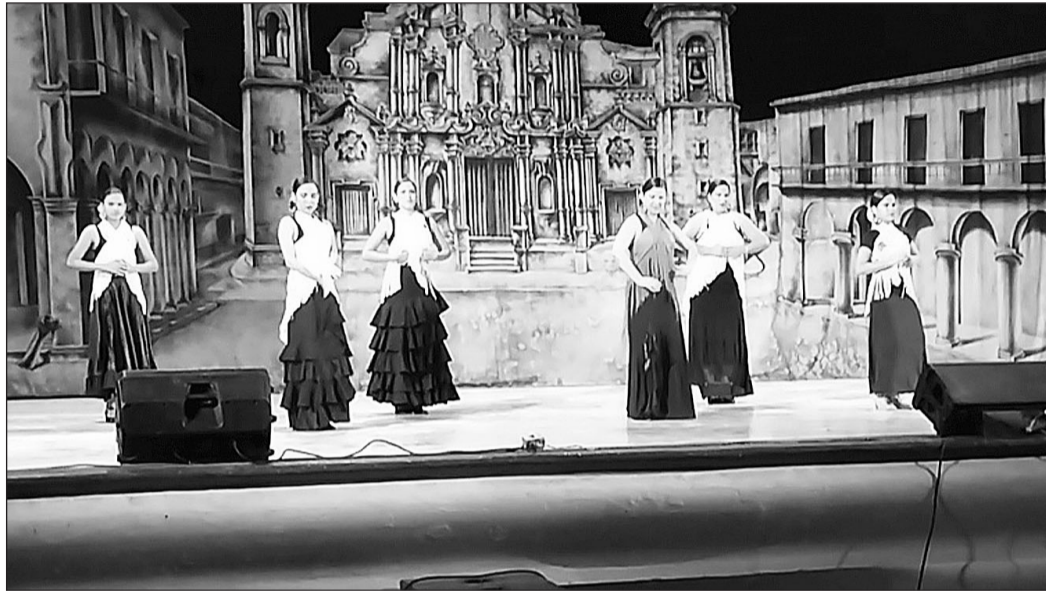
Actuación del grupo de baile del Centro Andaluz.