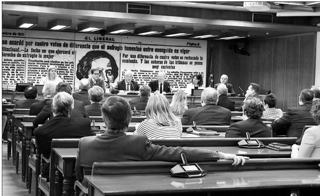
La comisión de investigación del 'caso Koldo' celebró su primera sesión el pasado lunes día 1.

do tendrán "el campo delimitado ya que el objetivo de la comisión es únicamente investigar los contratos vinculados al 'caso Koldo'".