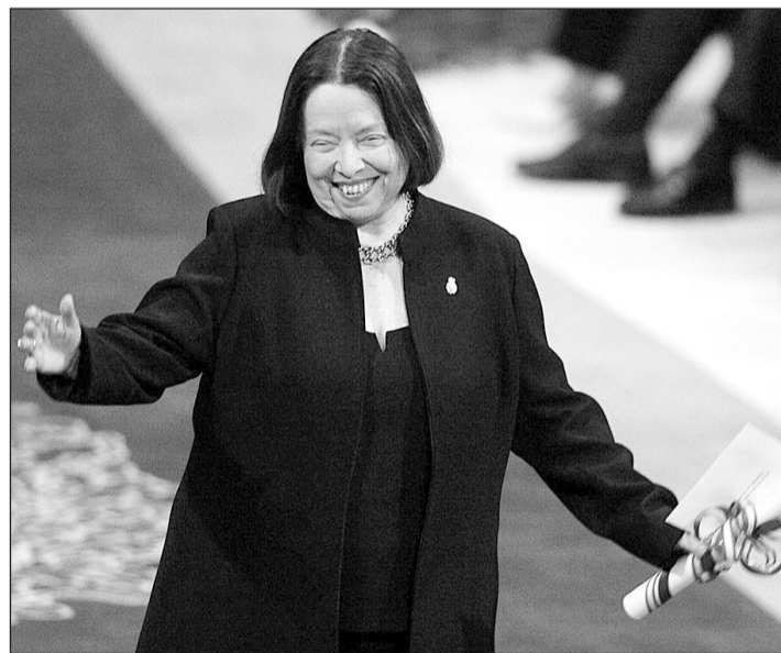
Nélida Piñón, en la ceremonia en la que recibió el premio Príncipe de Asturias, en Oviedo en el año 2005.

Decía Cunqueiro, el admirado don Álvaro: "Yo, a los diez años, escribí una historia de indios, de pieles rojas, una historia del Oeste, en la que los rostros pálidos hablaban en castellano y los indios, los cheyennes, que eran mis favoritos, hablaban en gallego". Tú, como el de Mondoñedo, amabas las historias de cowboys. Quizás con la última flecha viaje una verdad, que un día habrá que contar en un camino infinito hacia tu eternidad. Esa es la esperanza, de nuestra nueva conversación eterna. Perdón.