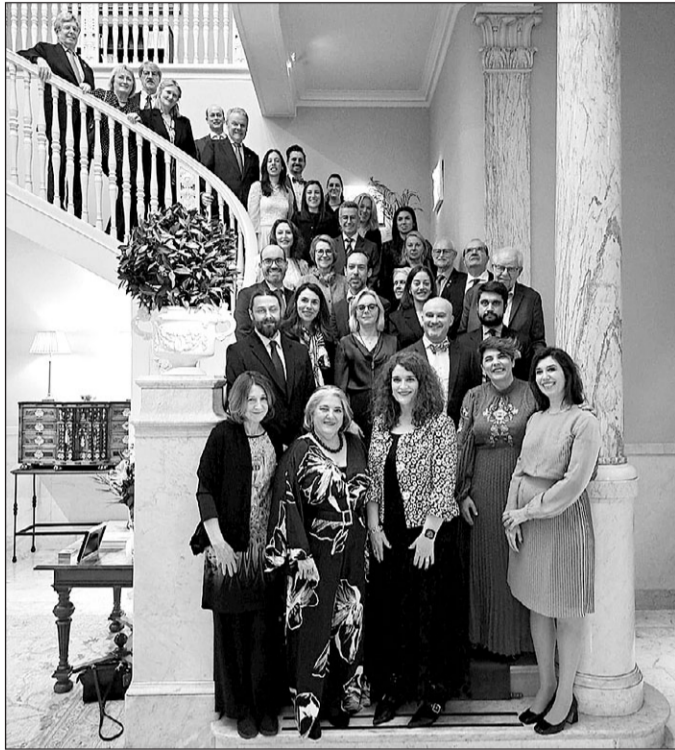
La premiada, junto a autoridades y asistentes al acto en la Embajada.

Esta III Entrega del Premio ACES-Margarita Salas tuvo lugar en una ceremonia celebrada en la sede de la Embajada de España en Estocolmo, con presencia de varios miembros de la comunidad científica sueca y española y la celebración de un simposio en