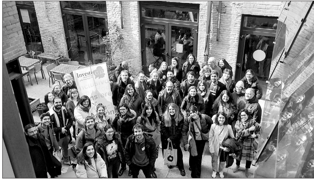
Participantes en el I Foro de Investigación Galega no Estranxeiro.

Durante el evento, la Axencia Galega de Innovación participó en una mesa redonda sobre la estrategia de política científica, junto a representantes de la Universidade da Coruña y de la Universidade de Vigo. En esta intervención se dieron a conocer las distintas iniciativas de atracción