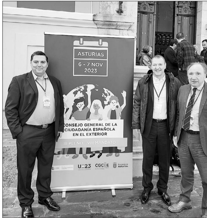
Los consejeros generales por Francia, durante el Pleno del CGCEE celebrado el pasado mes de noviembre.

los padres de alumnos en edad ALCE (de los 7 a 17 años) y esperan que después de la propuesta del último pleno del CGCEE (Consejo General de la Ciudadanía Española en el Exterior) y de la circular enviada el pasado 26 de enero desde la Dirección General de Asuntos Consulares sobre cómo proceder de cara a este tipo de comunicaciones se empiecen a utilizar las mismas pautas sin que estas queden a la merced de la jefatura de cada oficina consular como hasta ahora.