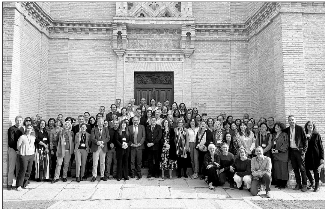
Participantes en el encuentro anual del Instituto Cervantes.

A estas intervenciones siguieron presentaciones sobre el papel de la jefatura de estudios, el plan de reordenación docente o aspectos organizativos como el te-