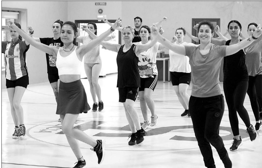
Se impartirán talleres de folclore, artesanía, cocina o cultura gallega.

Emigración mantiene así, como en años pasados, la modalidad presencial de estos talleres y la modalidad telemática a través del aula virtual, una plataforma donde la persona formadora y el alumnado interactuarán conforme a las necesidades de las personas participantes con el fin de optimizar el aprendizaje. En ambos casos,