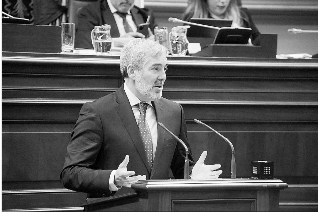
Fernando Clavijo, durante su intervención en el Debate sobre el Estado de la Nacionalidad Canaria.

"Este gobierno hará todos los esfuerzos necesarios para que Canarias dé un salto cualitativo en su apuesta por la I+D+i y para que toda nuestra población, por igual, entienda su importancia", se comprometió al respecto el presidente