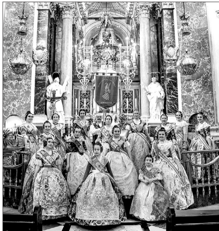
Las falleras tras la ofrenda floral a la Virgen de los Desamparados.