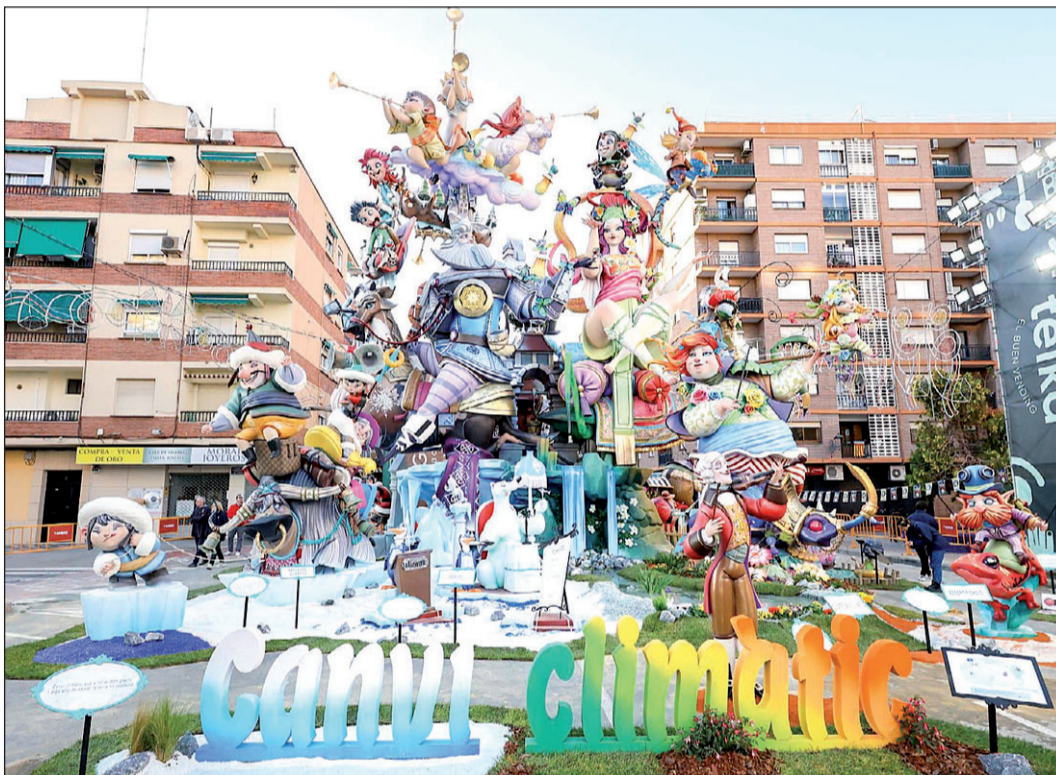
La falla de L'Antiga Campanar que recibió el primer premio de la sección Especial.

A partir de las 23:00 horas comenzó el espectáculo pirotécnico con el que se daba inicio a la Cremà de la falla municipal, en plena plaza del Ayuntamiento, con las dos enormes palomas que se disputaban una rama de olivo como esa gran contradicción entre la guerra y la paz. Por su parte, las fallas infantiles, que ardieron antes que las grandes, han abordado temas tan diversos como las diferentes formas de entender el hogar (Exposición-Micer Mascó), los muchos significados de una joya (Maestro Gozalbo-Conde Altea), los distintos sentidos de ser el rey (Malvarrosa-A. Ponx-Cavite), lo que supone el agua (Císcar-Burriana) o el ecosistema zoológico que esconde Valencia (Plaza de la Reina-Paz-San Vicente).