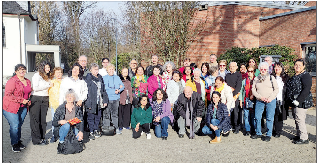
Participantes en el primer seminario de Adentro de 2024, celebrado en Bonn.