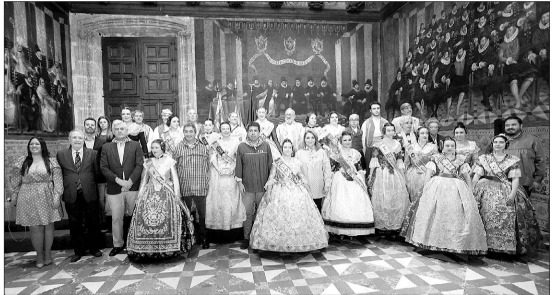
El presidente Mazón, junto a los miembros de la red de Centros Valencianos en el Exterior que acudió a las Fallas.

“Volvéis a vuestra casa, donde todo empezó y se os recibe con los brazos abiertos como nuestros mejores embajadores”, les dijo Carlos Mazón