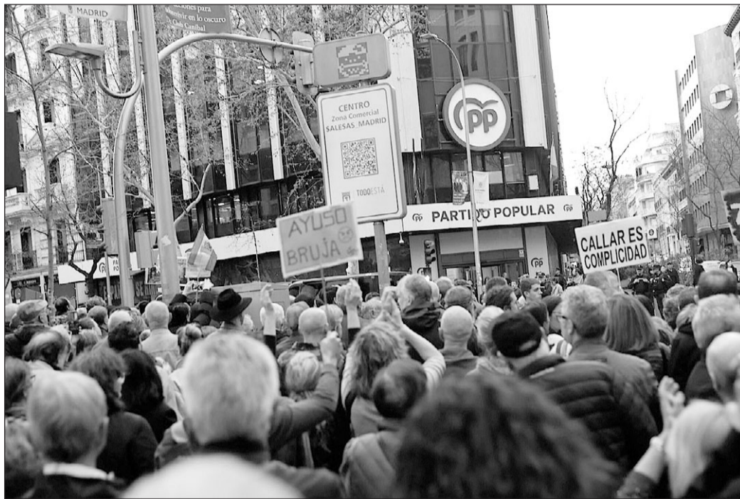
Manifestación contra Isabel Díaz Ayuso, frente a la sede del PP.

La juez razona en el auto que supuestamente, y como consecuencia de estas conductas defraudatorias, el contribuyente dejó de ingresar a la Hacienda Pública estatal por el Impuesto de Sociedades de 2020 una cuota de 155.000 euros y por el impuesto de sociedades de 2021, una cuota de 195.951 euros, delitos penados en el artículo 305.1 del Código Penal en concurso medial con un delito de falsedad en documento mercantil, del artículo 392.1 en relación