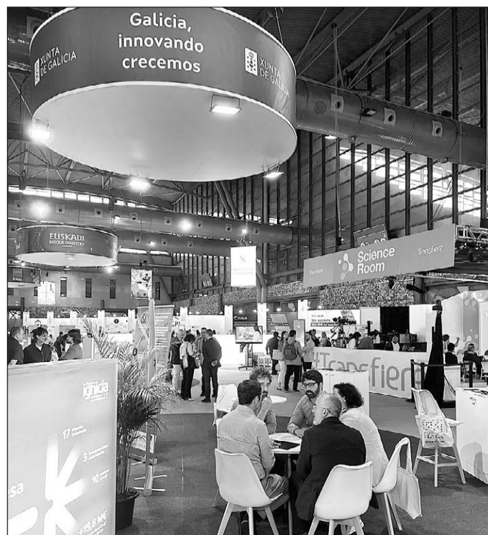
La Xunta contó con un mostrador en el Foro Europeo Transfiere 2024.

Además, la Axencia Galega de Innovación intervino en una mesa redonda en la que se debatió so-