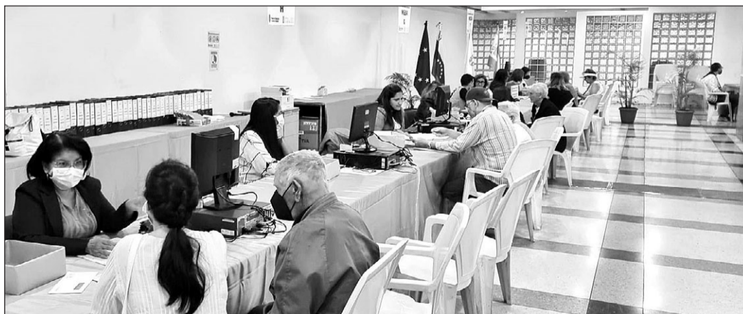
Algunos personas gallegas son atendidas en la oficina de atención social de la Hermandad Gallega de Venezuela.

La convocatoria de este programa de la Secretaría Xeral da Emi-