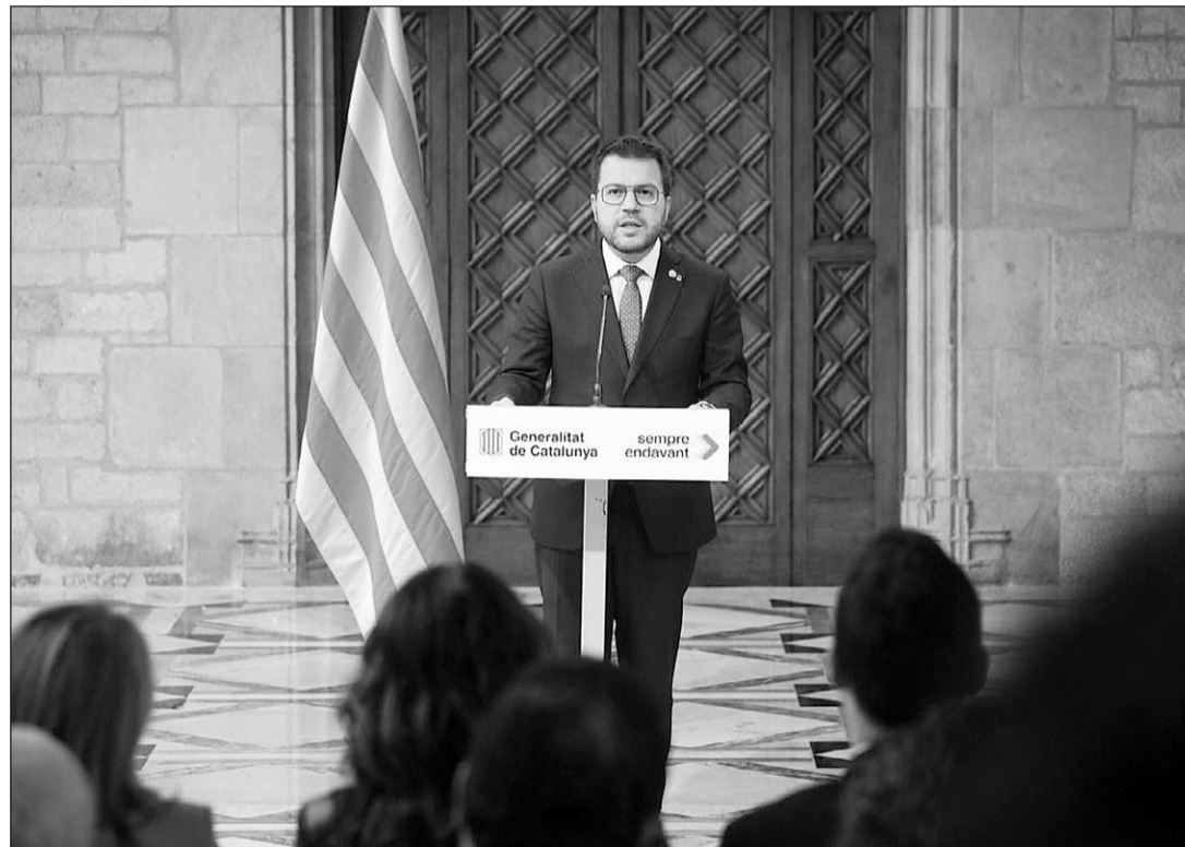
Pere Aragonès, durante el anuncio del adelanto electoral.

Tras un pleno tenso y lleno de reproches cruzados, el Parlament