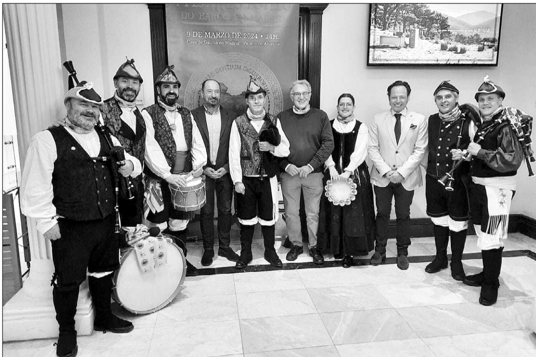
Uno de los grupos folclóricos que acudió a la celebración amenizó la sesión, abierta al público.

Se desarrollaron una jornada para la prensa y otra abierta al público