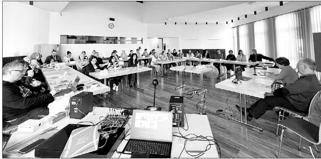
Los participantes en el primer seminario de Adentro de 2024, durante una de las sesiones de trabajo.

Riesgo, sociólogo y teólogo, dirigió un grupo sobre el trabajo biográfico destinado a participantes nuevos. En esta exposición explicó que el espíritu se puede resumir en