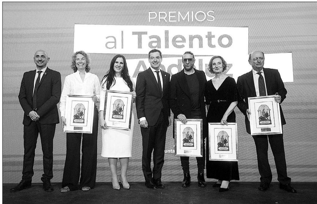
Juanma Moreno, junto a los premiados en la edición de este año.