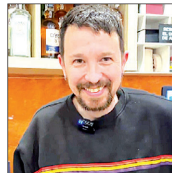
Pablo Iglesias Turrión.

dad de Valencia con motivo de la celebración y durante los cinco días que duró el festejo. Un festejo que sirve de reclamo para acercarse a la gastronomía de la región (las tradicionales paellas, la horchata con fartons o los buñuelos de calabaza), visitar las Ciudad de la Artes y las Ciencias, recorrer el casco antiguo o disfrutar de la vida nocturna de Valencia, con sus bares, terrazas y discotecas o la animada zona de El Carmen, así como la moderna zona de Ruzafa.