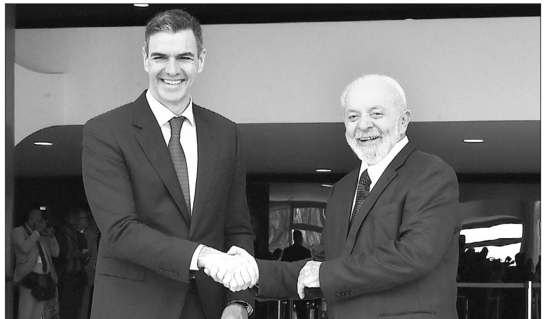
Pedro Sánchez saluda a Lula da Silva, durante su encuentro en Brasil.

La estancia en Latinoamérica le permitió a Sánchez reunirse con Lula da Silva, en Brasil, y con Boric, en Chile, país este en el que, acompañado de su homólogo, el presidente español participó en el acto institucional organizado con motivo del Día Internacional de la Mujer.