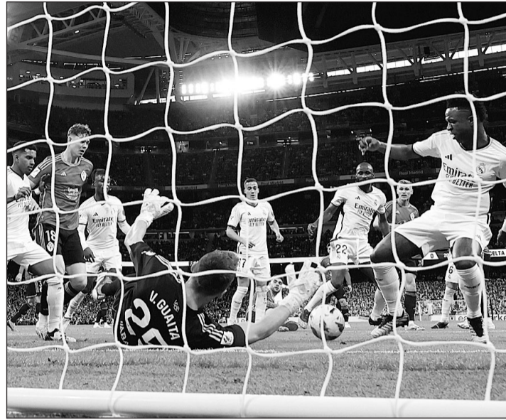
Momento en el que Vinicius marca el primer gol del partido.

apagando según se le fueron acabando las fuerzas a Modric. Los momentos del Celta no encontraron el paso final deseado. En ese panorama, cuando el rival lo siente perdido y adelanta metros, es donde el Real Madrid no perdona. Letal en transiciones.