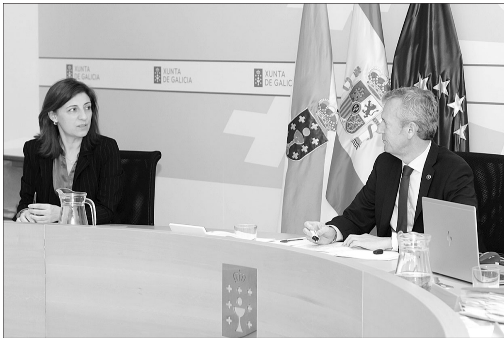
Alfonso Rueda y María Jesús Lorenzana, durante la reunión del Consello de la Xunta del pasado jueves..

En este marco, el programa prevé para esta convocatoria más de 30 mercados prioritarios de acción comercial entre los que se sitúan China, India, Israel, Japón, Reino Unido, Alemania, Marruecos, Brasil, México, Emiratos Árabes, Estados Unidos o Canadá, así como otros