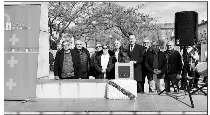
Asistentes ao acto trala ofrenda floral.

El Arquivo da Emigración Galega, organismo que se inscribe dentro del Consello da Cultura Galega, hizo pública recientemente la digitalización de gran parte de los fondos documentales de la Sociedad de Instrucción ‘Unión Barcalesa’, una entidad fundada en 1907 que reunía a los emigrantes del valle de la Barcala (Negreira y A Baña), en Cuba. Los fondos permiten consultar documentos sobre el funcionamiento de la entidad entre 1907 y 2004. La Sociedad de Instrucción ‘Unión Barcalesa’ nació en La Habana en 1907 con el objetivo de fundar escuelas en su tierra natal. La entidad construyó y financió a lo largo de su vida cuatro escuelas: Covas (1921), Aro (1926), la Casa-Escola de Broño (1969) en Negreira, y la Casa-Escola de Seoane (1932). El acceso a estos fondos es libre y abierto en la web del Consello da Cultura Galega.