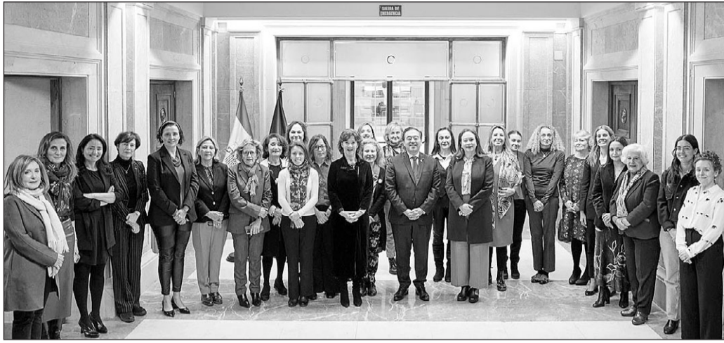
Albares posa junto a las mujeres que asistieron a este acto en el Ministerio.