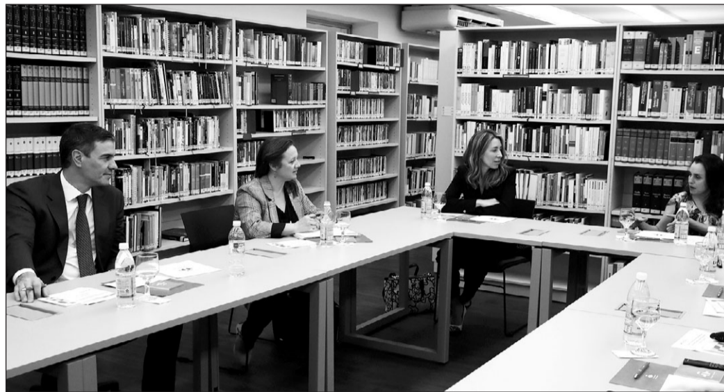
El presidente del Gobierno, Pedro Sánchez, durante el encuentro que mantuvo con la Asociación de Científicos Españoles en Brasil (ACEBRA) en el Instituto Cervantes de São Paulo.

Por otra parte, el presidente del Gobierno ha definido a Brasil como "un país amigo en lo humano, un aliado en lo político y un socio en lo económico", durante el discurso de inauguración del Encuentro Empresarial España-Brasil