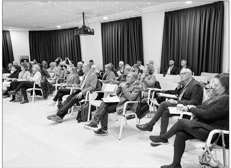
Consejeros participantes en el Pleno.