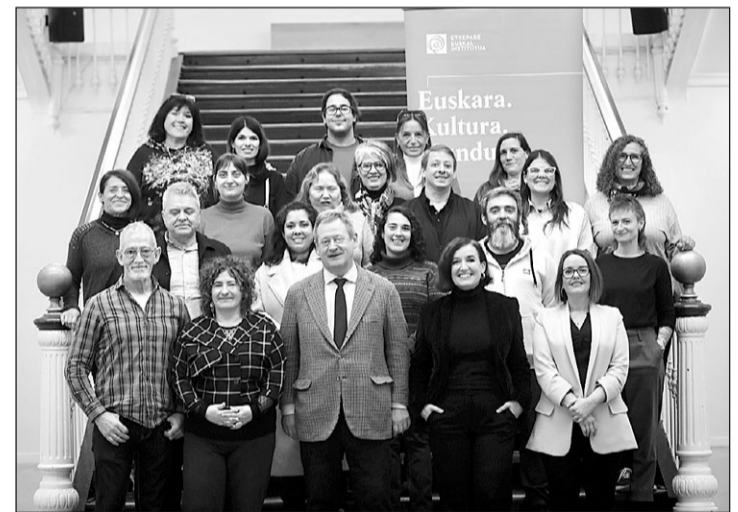
Las autoridades posan junto a los futuros profesores de euskera.

Etxepare Euskal Institutua promueve el conocimiento del euskera entre las colectividades vascas de todo el mundo a través del programa Euskara Munduan. En el marco de este programa, capacita a miembros de las euskal etxeak (centros vascos) para impartir clases de euskera en sus respectivas comunidades, con el fin de que no se pierda su transmisión.