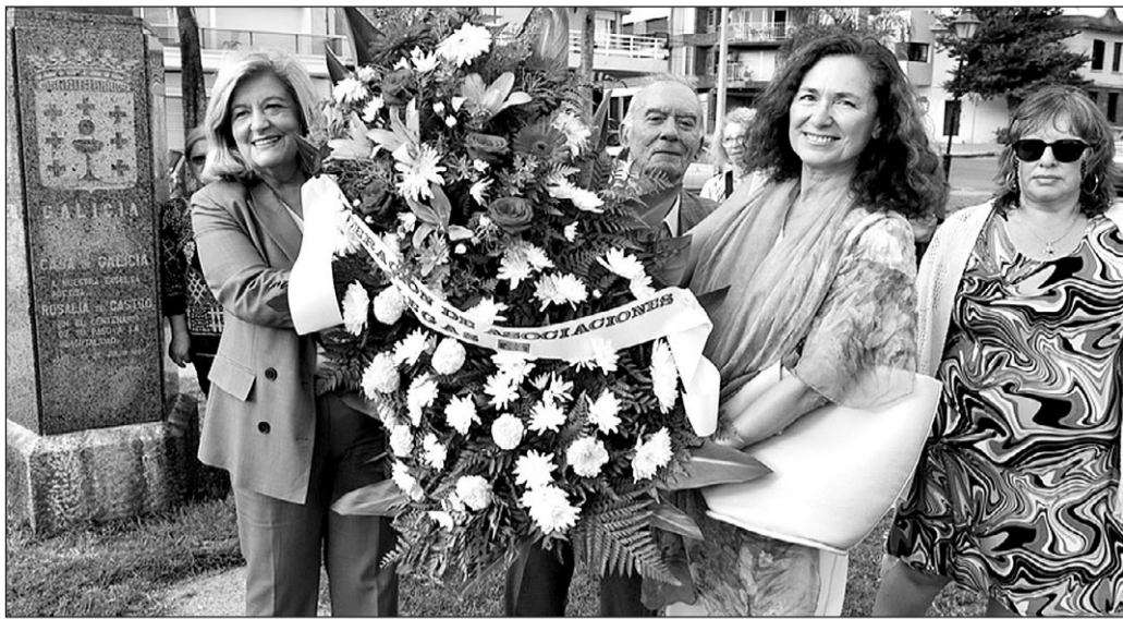
La ofrenda floral al busto de Rosalía de Castro cerró el acto conmemorativo en Montevideo.

Recuerdo “a las viudas de la emigración que sufrieron el drama del olvido”