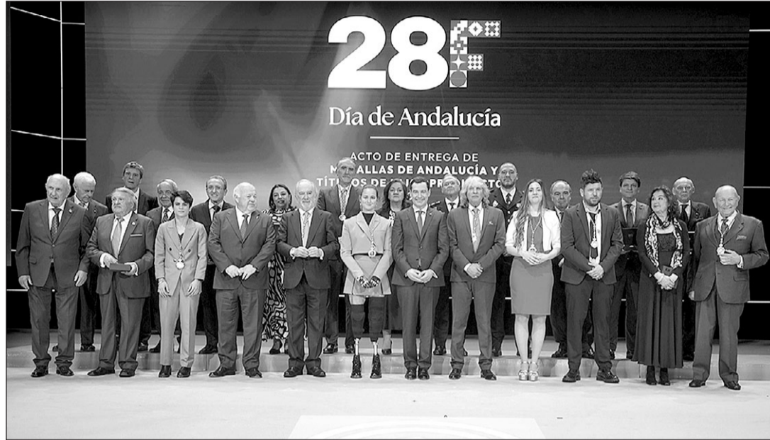
El presidente de la Junta —centro—, con los premiados en la conmemoración del Día de Andalucía.

El director de la RAE fue el encargado de tomar la palabra en