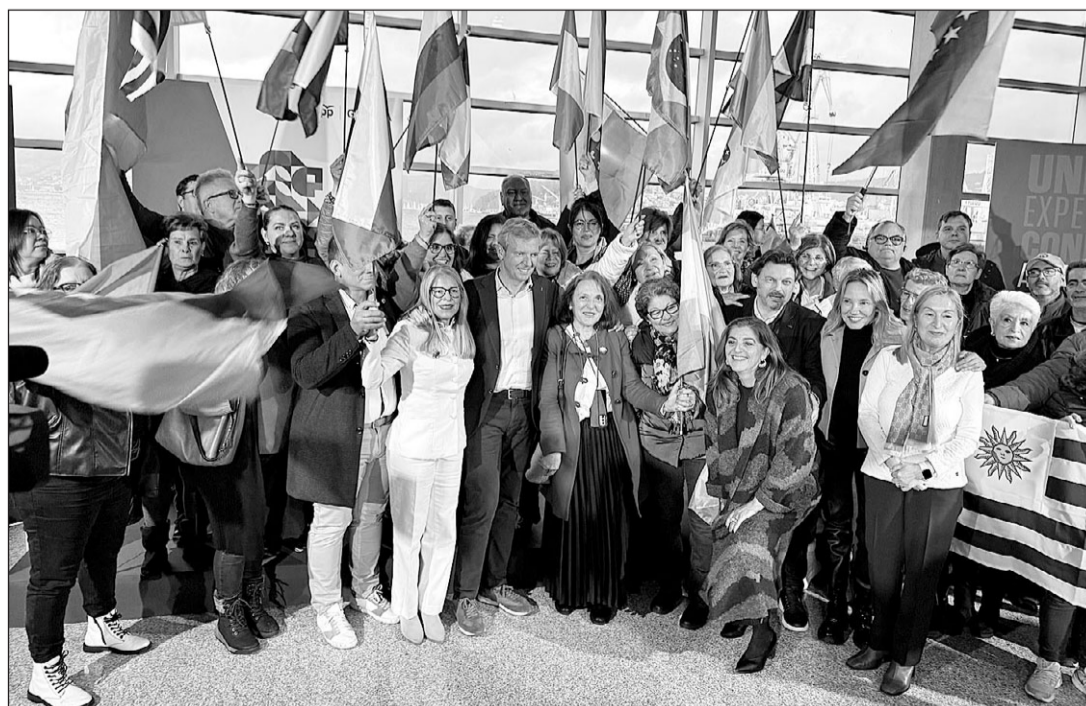
Alfonso Rueda y Rodríguez Miranda, junto a gallegos retornados de distintos países durante un acto electoral.

En su intervención, el presidente gallego ha agradecido el apoyo dado al PPdeG por los gallegos del exterior, a los que ha trasladado que todo el trabajo hecho por la Xunta "durante toda la legislatura", "con independencia de que se acerquen o