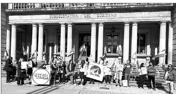
Diversos colectivos se manifestaron frente a la Subdelegación del Gobierno.

Los manifestantes argumentan que la falta de reconocimiento de sus estudios extranjeros crea ba-