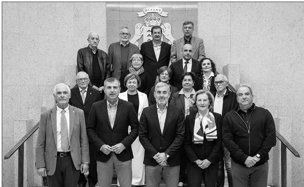
El presidente de Canarias, Fernando Clavijo, junto a los miembros del jurado.

Ha sido el principal renovador de los estudios sobre el proceso de formación de la moderna sociedad canarias, en cuya temática su la-