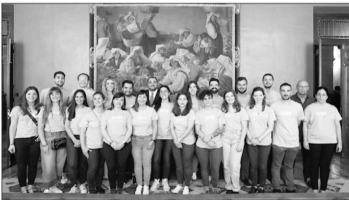
Alumnos de la Escuela de Asturianía de la pasada edición asistieron como invitados a la toma de posesión del presidente del Principado, Adrián Barbón, celebrada en julio de 2023.

La Escuela de Asturianía duplica el número de plazas respecto a la última edición. Así, oferta 28 puestos para la especialidad de gaita y otros 28 para la de baile. La convocatoria cuenta con un presupuesto de 200.000 euros con los que cubrir el coste total de los