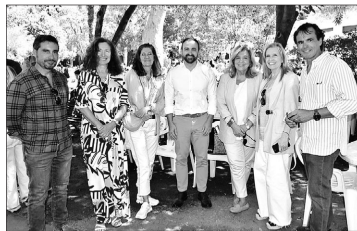
Las autoridades españolas en Montevideo también acudieron a la Romería.