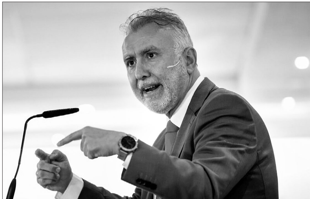
El ministro Ángel Víctor Torres, durante su intervención en el acto en el que anunció la prórroga del plazo.

Hasta el 31 de diciembre de 2023, un total de 226.000 españoles solicitaron la nacionalidad a través de la Ley de Memoria De-