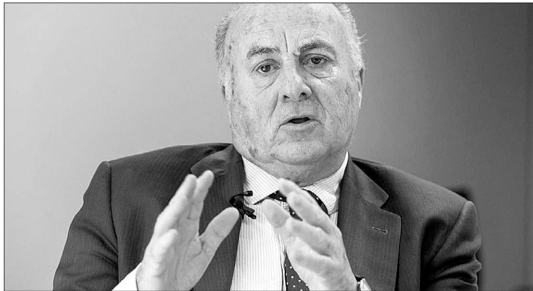
El juez de la Audiencia Nacional Manuel García Castellón.

El magistrado, que investiga a Puigdemont por terrorismo en la causa 'Tsunami', cree que las graves lesiones que sufrieron dos