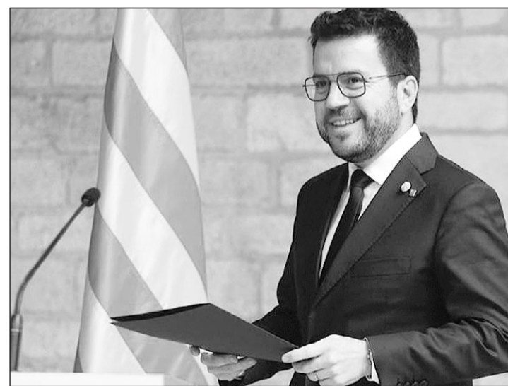
El presidente de la Generalitat catalana, Pere Aragonès.

El PP cree que es la demostración de que Sánchez considera a ERC "un partido peligroso para la integridad territorial"