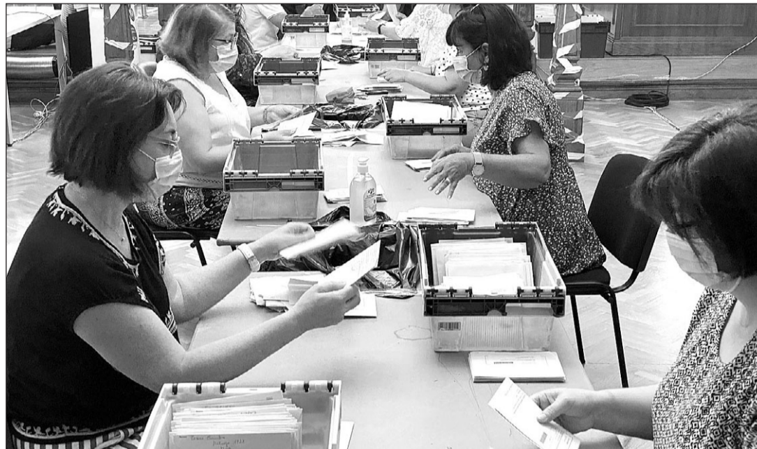
Recuento del voto exterior en 2020, año en el que el CERA dio un escaño al PP en detrimento del PSdeG. GM

más de 4.700 sufragios, por encima de la que dejó el resultado en Lugo y Pontevedra, donde rondó los tres mil. Los liderados entonces por Emilio Pérez Touriño obtuvieron por estas dos provincias 6.093 y 11.823 votos de la diáspora frente a los 3.199 y 8.704, respectivamente, del partido de Feijóo. En Ourense se estrechó todavía más la ventaja, con 7.979