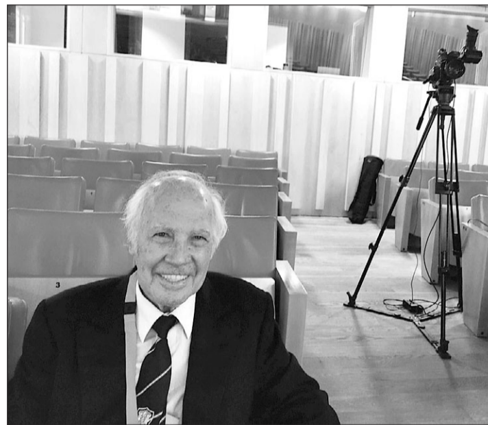
El tenor preside la Casa de Burgos de Madrid. ROSALIA

—, pero con una "inteligencia, sabiduría, belleza y finura" digna de ser resaltada, confiesa— le "impulsó a aprender" y el joven Miguel atendió a su recomendación, seleccionando a los mejores "maestros" para "estudiar todas las facetas de la ópera, que son mu-