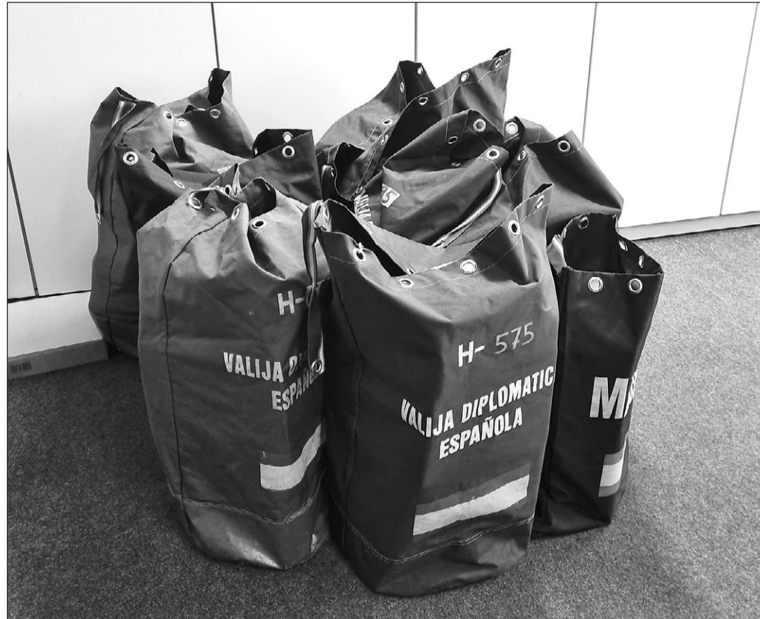
Sacas con votos del exterior en las últimas elecciones generales, celebradas el 23 de julio de 2023.

Si se extrapolan los datos del 23-J a Galicia, donde el próximo 18 de febrero se celebran elecciones autonómicas, el nivel de participación estuvo 4,5 puntos por debajo del que se registró en el ámbito nacional. El incremento del número de gallegos que en esa convocatoria se decidieron a depositar su papeleta rondó, con respecto a cuatro años antes, los dos puntos porcentuales (1,9, concretamente). De los 472.142 inscritos en el CERA por Galicia, en las últimas generales ejercieron el derecho al voto un total de 26.974 electores, lo que supone el 5,5% de ese censo, frente al