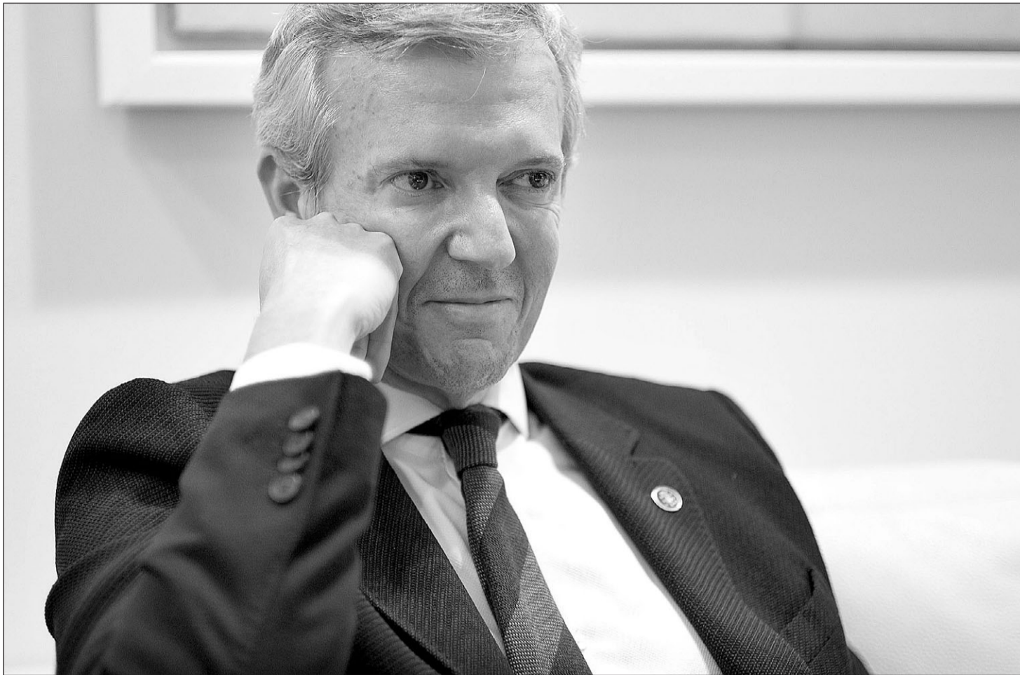
El cabeza de cartel del Partido Popular a las automómicas de febrero sustituyó a Núñez Feijóo al frente de la Xunta hace casi dos años.