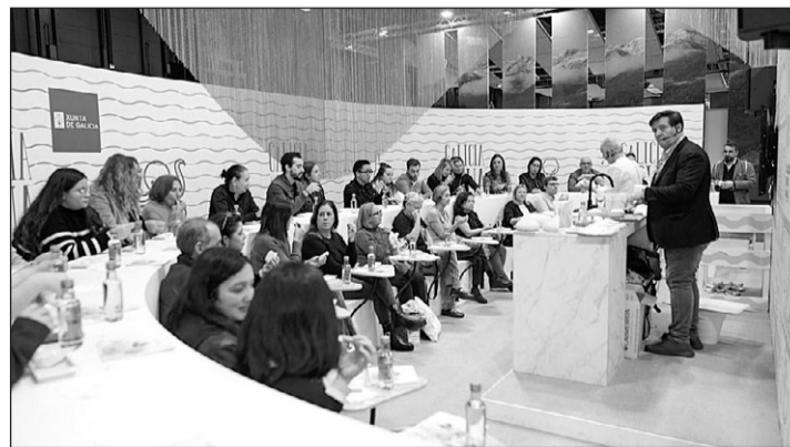
Una de las degustaciones en el pabellón de Galicia en Fitur.

En Fitur 2024, Galicia ofreció también distintas demostraciones