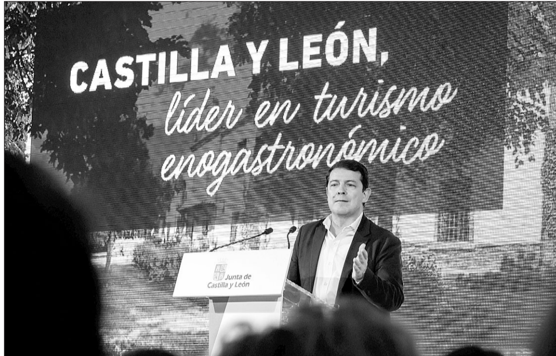
Alfonso Fernández Mañueco, durante su intervención en Fitur.