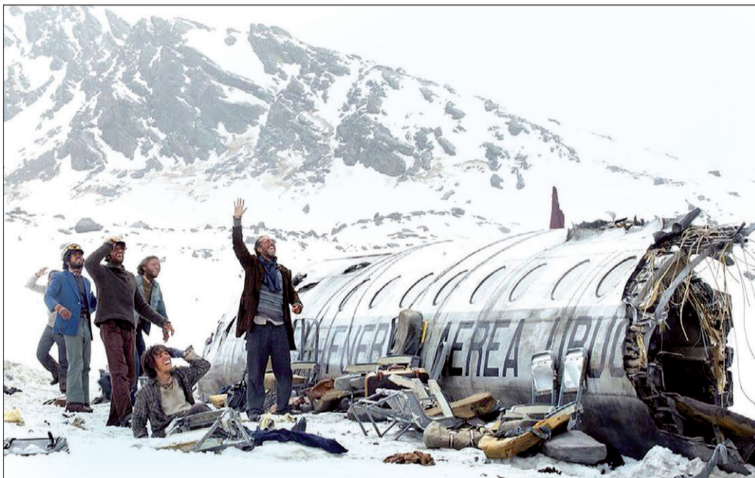
Un fotograma de la película 'La sociedad de la nieve', candidata a dos estatuillas.

'La sociedad de la nieve' relata la hazaña de los 16 supervivientes del accidente del vuelo