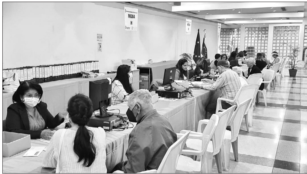
Trabajadores de la oficina de atención social de la Hermandad Gallega de Venezuela, tramitando ayudas.

El grado de dependencia, la gravedad de las enfermedades y sus tratamientos, los ingresos