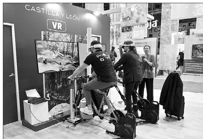
El turismo de naturaleza se dio a conocer a través de una experiencia inclusiva con gafas de realidad virtual.

La tecnología ayudaba al viajero a adentrarse en la oferta turística, dando a conocer todos los rincones de la comunidad a través de una actividad tecnológica e inmersiva para disfrutar de la gastronomía y el enoturismo guiados