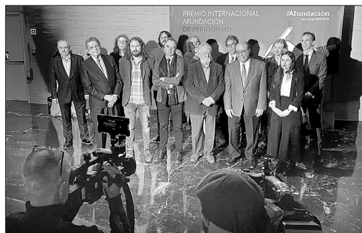
La ganadora, los dos finalistas, el jurado y autoridades posan durante la gala.