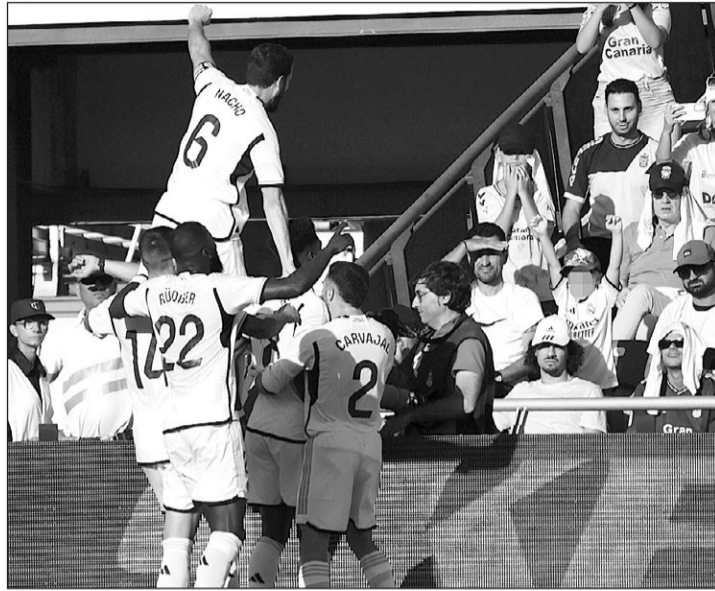
Los jugadores del Real Madrid celebran uno de los goles.

Necesitó el conjunto blanco recibir una bofetada en forma de gol para despertar de su letargo y reaccionar en la segunda parte, mejorado con los cambios de Ancelotti, con una presión alta que le permitió robar el balón en campo rival, someter al conjunto canario, y acabar por