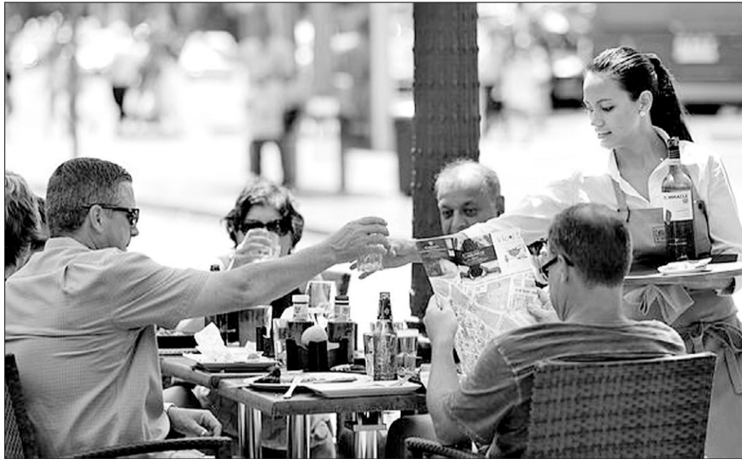
El empleo creció en todas las áreas a lo largo del año, sobre todo en el sector Servicios. GM

La recuperación del turismo, principal motor de la economía nacional, y las altas temperatu-