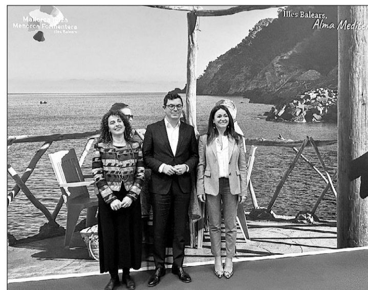
Los dirigentes de Canarias y Baleares que se reunieron en Fitur

Asimismo, los dos consejeros, que también coordinan las áreas de gobierno de Vivienda, han coincidido en que ambos archipiélagos atraviesan una situación de alta demanda habitacional, y han comentado los decretos sobre esta materia que han desarrollado los gobiernos insulares, en el caso de Baleares vigente desde hace cuatro meses, y, en el caso de Canarias, la Consejería trabaja en una propuesta que será presentada en los próximos meses.