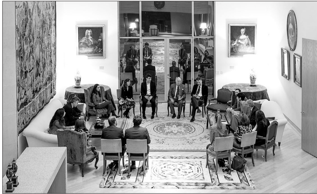
La ministra Elma Saiz, durante el encuentro con representantes de la colectividad española en Estados Unidos. GM

En un encuentro que la ministra calificó como “una experiencia enriquecedora que nunca olvidaré”, les ha transmitido el interés del Gobierno por la comunidad española en Estados Unidos. Prueba de ello, manifestó, es el refuerzo del Ministerio de Inclusión, Seguridad Social y Migraciones con una Dirección