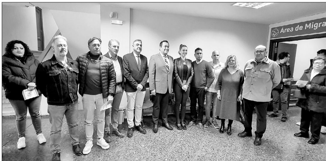
Diferentes autoridades de la administración, asociados, familiares y amigos, durante la inauguración.

Para ello, ASER ha firmado un convenio de colaboración con UGT-Sevilla por el que la asociación de retornados se compromete a atender a los afiliados del sindicato que necesitan información sobre emigración y retorno