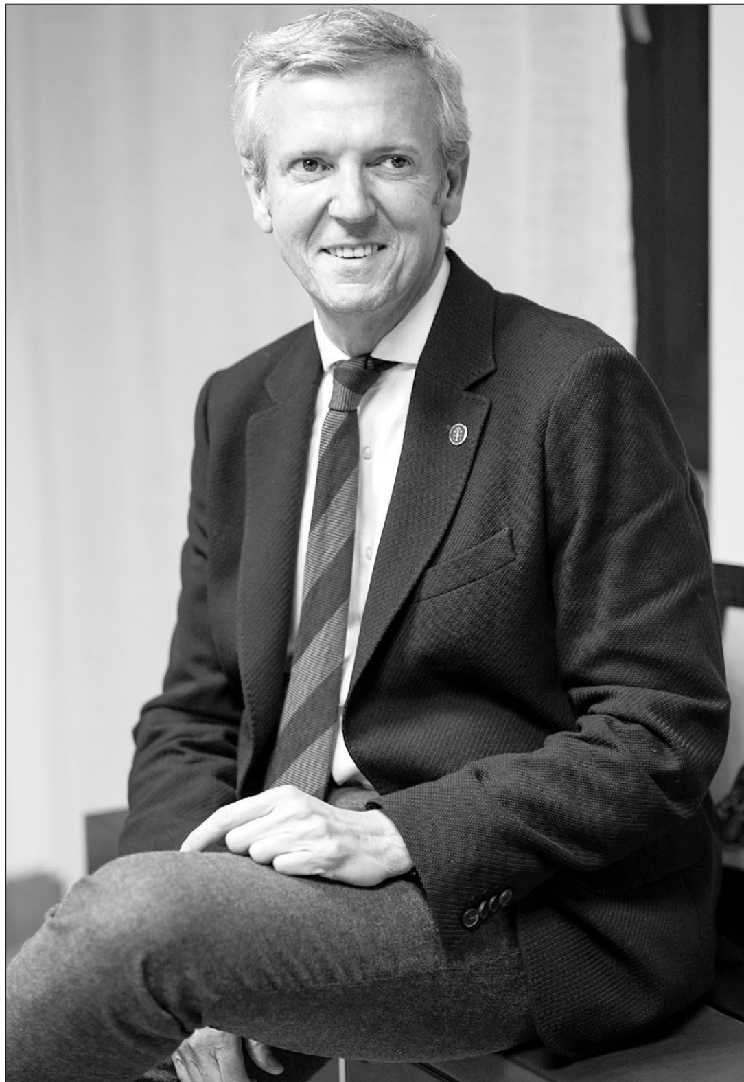
Alfonso Rueda Valenzuela, candidato del PP en las elecciones gallegas del 18-F.

R. No pesa, al contrario, es un orgullo suceder a Feijóo como presidente de la Xunta. Aunque con otras responsabilidades, he estado trabajando en el gobierno gallego desde 2009, y creo que el trabajo que hemos hecho en esta legislatura, y en la anteriores, ha hecho progresar a Galicia. Por mucho que se empeñe la oposi-