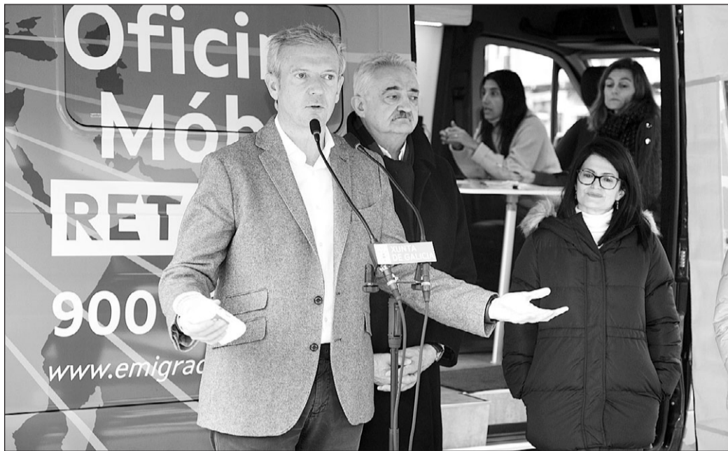
Alfonso Rueda, durante su intervención en la visita a la Oficina móvil de atención al retorno en Chantada.

Durante una visita a la Oficina a su paso por el ayuntamiento de Chantada (Lugo), Rueda destacó que el objetivo de esta iniciativa es garantizar que ningún retornado se quede sin apoyo por tener dificultades para desplazarse hasta la ciudad. De este modo, la Oficina recorre el rural gallego para resolver cualquier tipo de duda sobre trámites, cuestiones tributarias, el sistema educativo o la vivienda, así como para ofrecer asesoramiento y orientación laboral personalizada. Un servicio que completa el que ya ofrecen las sedes físicas de la oficina en