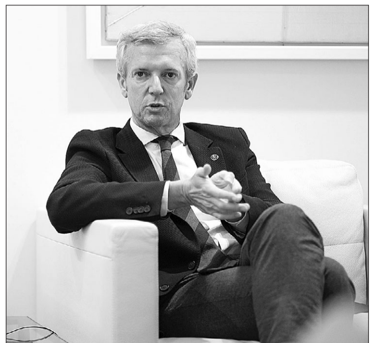
Rueda confía en que la voz de los gallegos emigrados se escuche en estas elecciones “más fuerte que nunca”, una vez quedó abolido el voto rogado.

prioridad del día a día. Ya lo era cuando era vicepresidente y visité los principales países con presencia gallega. Ahora como presidente, en este último año, he visitado países tan relevantes como Argentina, Uruguay, Venezuela, México o Suiza, en el que residen en torno al 60% de los gallegos del exterior. Creo que conocer la realidad de la Galicia exterior, de primera mano, es la mejor forma de aplicar medidas más eficaces e incluso pioneras en materia de atención a nuestros emigrantes y ahora también, absolutamente novedosas, en el acompañamiento y atención en el proceso de retorno.