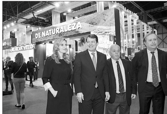
El presidente de la Junta recorre el stand de Castilla y León.