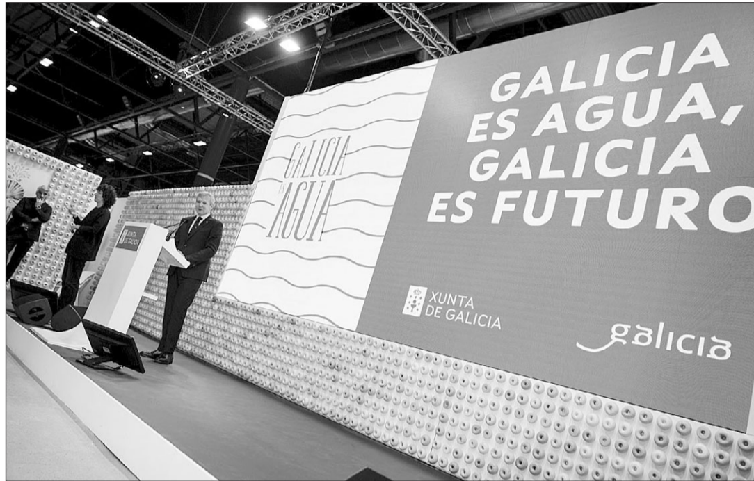
Alfonso Rueda dio a conocer la campaña 'Galicia es agua, Galicia es vida', en la inauguración de Fitur.

Rueda destacó que la comunidad ha alcanzado esta cifra de visitantes de la mano del sector "sin obsesionarnos y con sentidoño", un número que consideró una