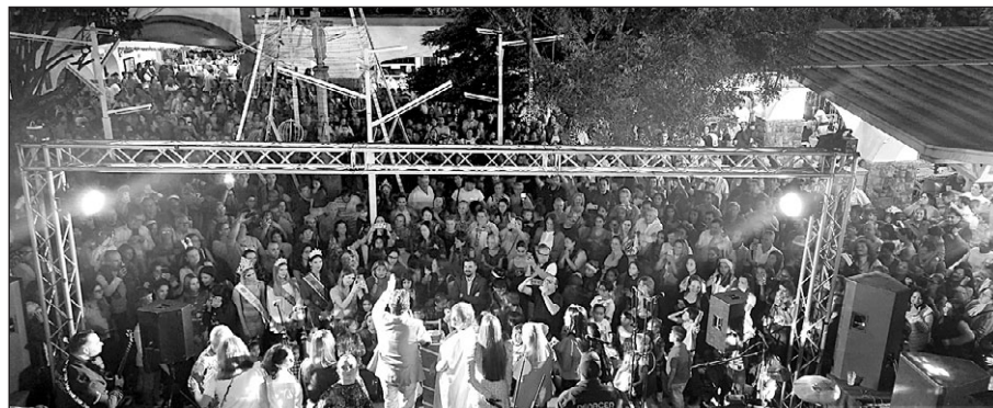
Miranda se dirige a los asistentes al tradicional ‘Encendido de la Navidad’ en la Hermandad.

El secretario xeral de Emigración se reunió con la directiva del Centro Gallego de Maracaibo