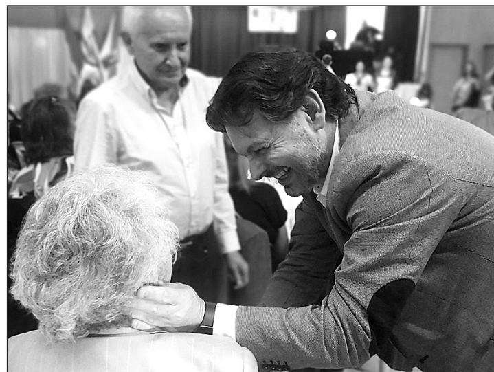
El secretario xeral saluda a una de las asistentes al acto de 'Alma Gallega'.