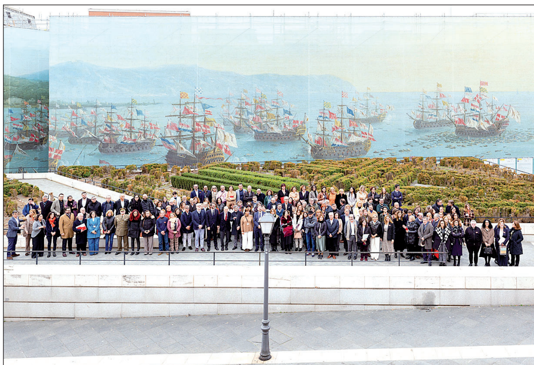
Foto de familia de los asistentes a la presentación del proyecto 'Prado extendido'.

Con este proyecto se pretende “otorgar mayor coherencia a las más de 3.400 obras depositadas, reforzar su conexión territorial y