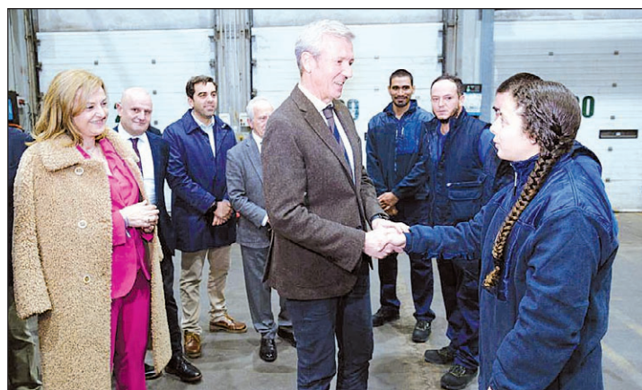
Rueda saludó a los beneficiarios del programa con los que se reunió en Oroso.

Rueda destaca la cifra de 200 beneficiarios del programa ‘Retorna Cualifica Empleo’