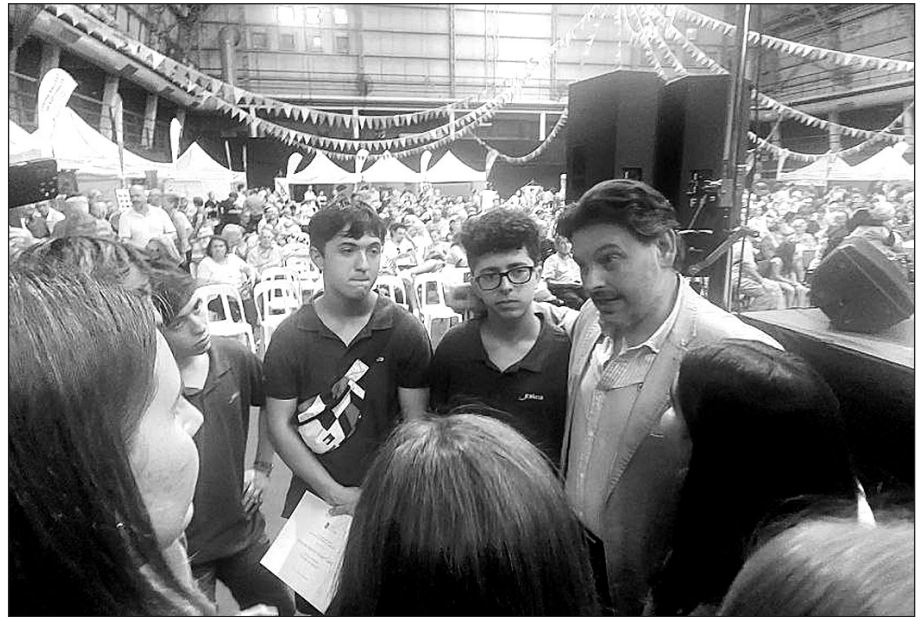
Las autoridades, junto a los jóvenes que hicieron el Camino el pasado verano.