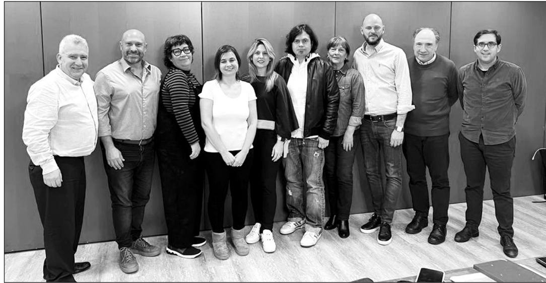
Los miembros de la Comisión Técnica de Asuntos Jurídicos, durante el pasado Pleno del CGCEE, en Oviedo.

El trabajo que han realizado lo han llevado a cabo en la sombra para cumplir con el "acuerdo de confidencialidad" exigido, debido a la calidad de los documentos