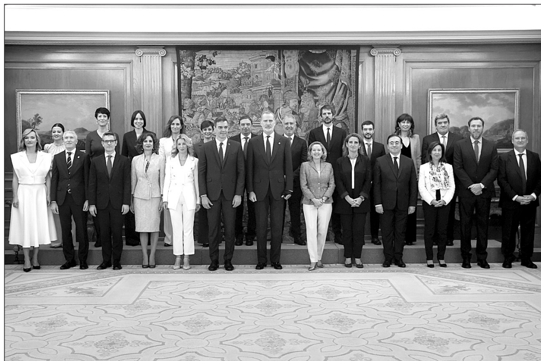
El presidente Pedro Sánchez y los miembros de su nuevo gobierno posan junto al Rey tras haber prometido sus respectivos cargos todos los ministros.

Con un Congreso de los Diputados partido por la mitad, Sánchez apostó por un Gobierno de