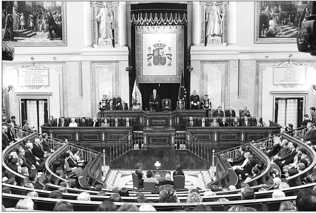
El Rey, durante su discurso en el Congreso en el acto de apertura de la XV Legislatura.

Por su parte, el rey Felipe VI hizo un llamamiento a superar las “divisiones” y los “enfrentamientos” para llegar a los más jóvenes “una España sólida y unida” y felicitó a Sánchez por su elección, así como a sus ministros, al tiempo que dio la en-