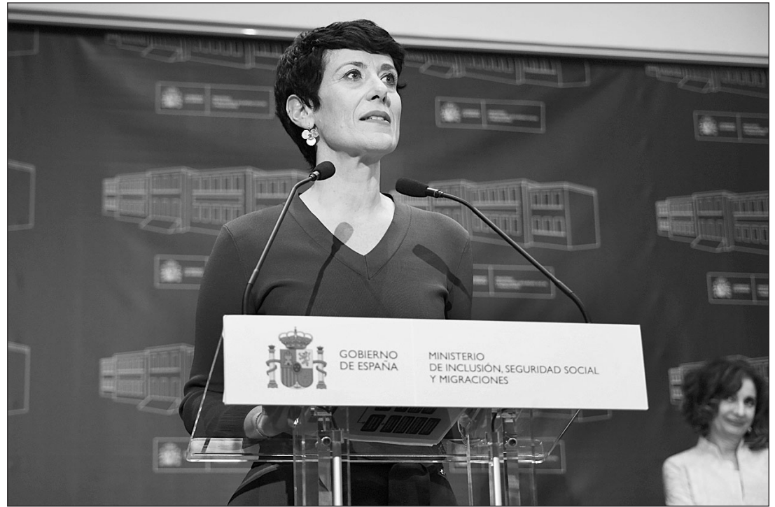
Elma Saiz, durante su intervención en el acto de toma de posesión como ministra.

“A los españoles en el exterior también les vamos a prestar la mejor atención”, dijo la nueva ministra