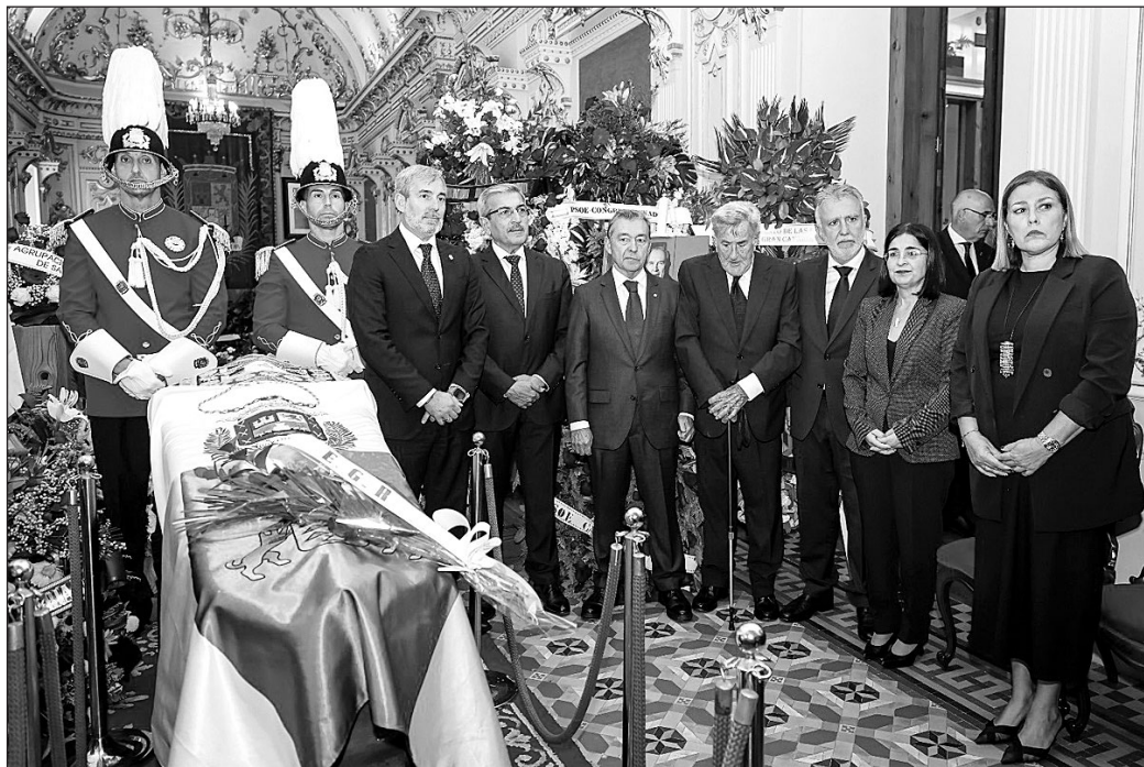
Fernando Clavijo, expresidentes canarios y la alcaldesa de Las Palmas acudieron a la capilla ardiente.