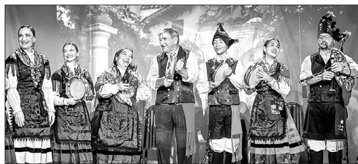
Uno de los grupos participantes en el espectáculo.

El Parque Bicentenario de Vitacura es uno de los parques más importantes de la ciudad, con 27 hectáreas que se extienden por la ribera sur del río Mapocho, y cuenta con más de 4.000 árboles, de los cuales son 1.300 de especie nativa. Recibe, en promedio, alrededor de 35.000 visitas al mes. “Es un tremendo orgullo para nosotros como Vitacura contar con este hito en nuestra comuna, símbolo de amistad entre ambas ciudades”, señaló la alcaldesa de Vitacura, Camila Merino.