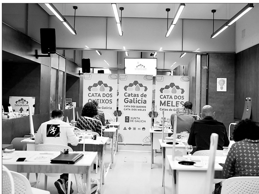
Miembros del jurado, durante una de las catas que se llevaron a cabo.

En la línea de seguir apoyando al sector primario, la Xunta cuenta con estrategias sectoriales, una de ellas para el lácteo. Su objetivo es buscar un aumento del peso de las denominaciones de origen de queso gallegas en la transformación industrial láctea, adaptando los formatos y los envases a las nuevas demandas de consumo. Estas estrategias se completan con otras para el cárnico y el vitivinícola.