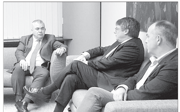
Santos Cerdán, secretario de organización del PSOE; Carles Puigdemont, presidente de Junts, y el secretario general de Junts, Jordi Turull, en Bruselas.

Esto puede abrir la puerta a que la amnistía también abarque a personas que han cometido delitos que no están comprendidos directamente en el proceso independentista, como la presidenta de Junts, Laura Borrás, o el cola-