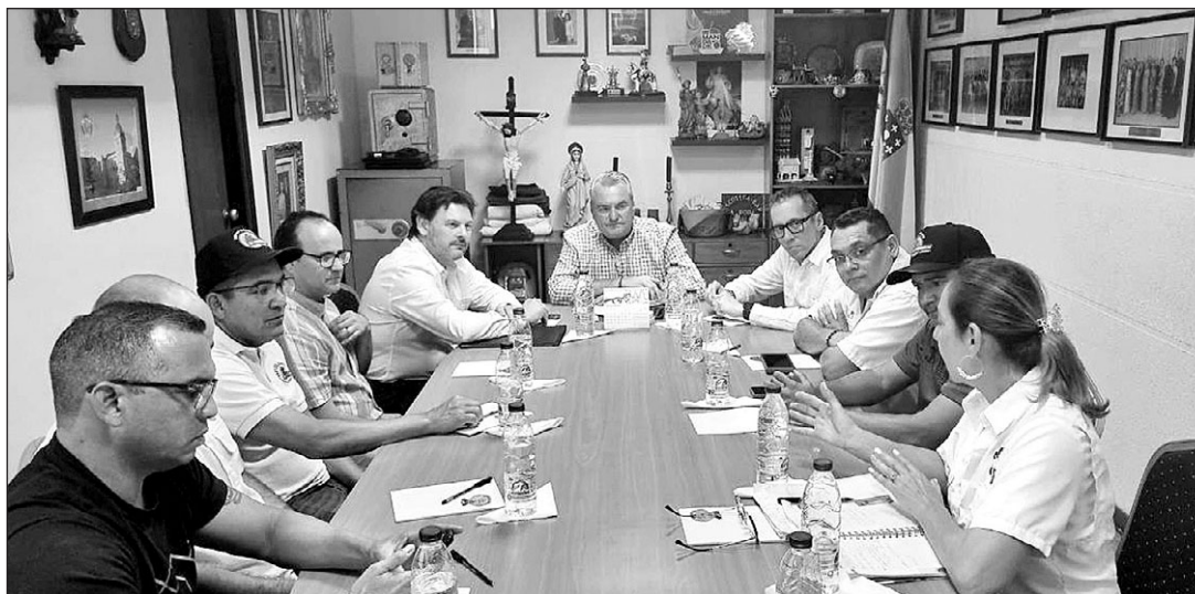
El secretario xeral de Emigración, reunido con los directivos del Centro Gallego.

directiva del Centro Gallego de Maracaibo, el secretario xeral de Emi-