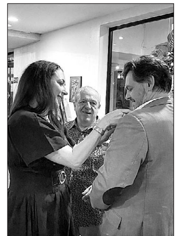
La imposición del Botón de Oro.