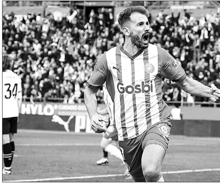
Stuani celebra uno de sus goles marcados al Valencia en Montilivi.

ÁRBITRO: Iglesias Villanueva (Gallego). Amonestó a los locales Blind, Yan Couto y Sávio y a los visitantes Yarek, Hugo Duro y Gabriel Paulista.