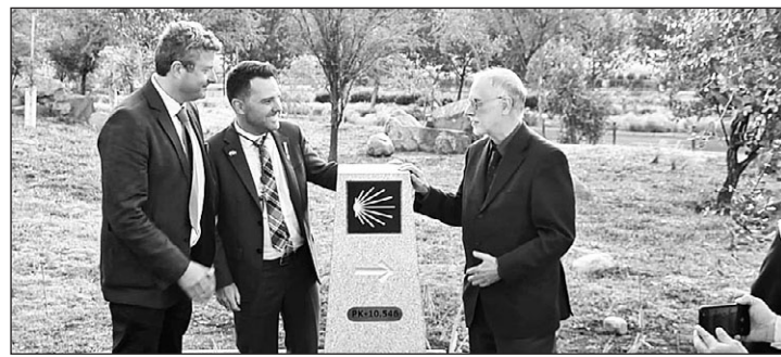
Inauguración en Chile del hito más austral del Camino de Santiago.

El Consello da Cultura Galega, en colaboración con la Secretaría Xeral de Emigración, mantiene el especial ‘Historias de ida e volta’ para dar a conocer aquellos materiales que documentan el fenómeno migratorio. En más de veinte entregas se documentaron los procesos de salida y llegada, la vida social y cultural, etc., para, de este modo, explicar todo el ciclo migratorio a partir de los materiales que custodia el Archivo da Emigración Galega.