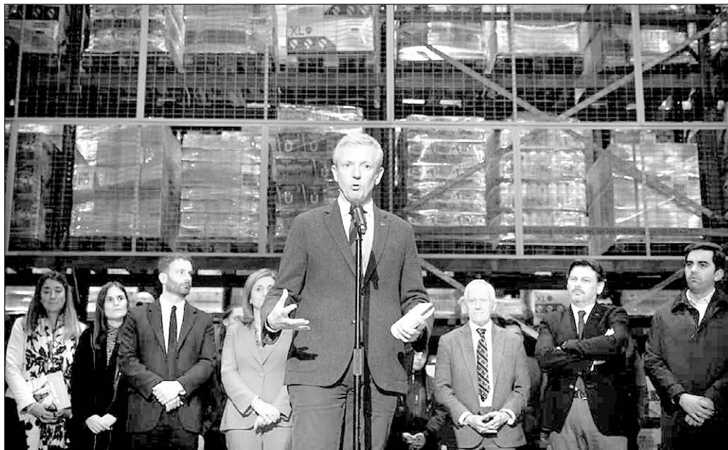
Alfonso Rueda, durante su intervención en el encuentro con participantes en el 'Retorno Cualifica Empleo'.

en el acto estuvo acompañado, entre otros dirigentes, por el secretario xeral de Emigración, Antonio Rodríguez Miranda, destacó que la Xunta está consiguiendo el asentamiento de población en el rural y generar empleo de calidad; facilitar el intercambio de conocimiento; ofrecer una oportunidad a los gallegos del exterior; incrementar la población activa de Galicia; y dar respuesta a las necesi-