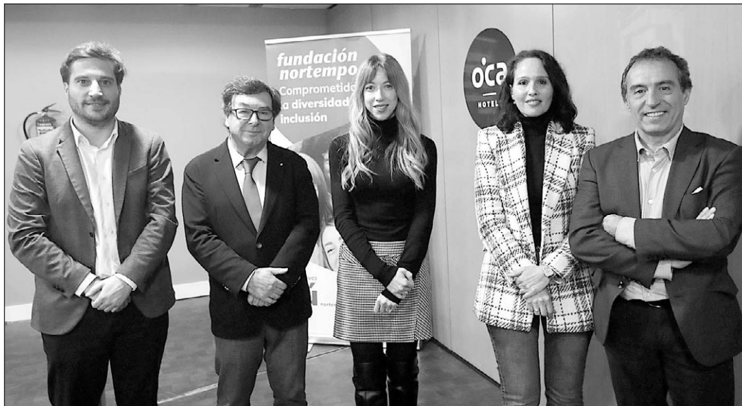
Zeltia Lado —en el centro—, junto con otros participantes en el Foro Retorna Empleo.

En su intervención, la directora xeral afirmó que el Gobierno gallego continuará el año que viene a desarrollar esta iniciativa, que otorga a las personas beneficiarias ayudas para el viaje, formación orientada al empleo, contrato de trabajo indefinido y también un apoyo económico para el comienzo de su vida de