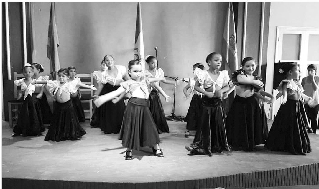
Las niñas de la escuela de baile, durante su actuación en el evento conmemorativo.