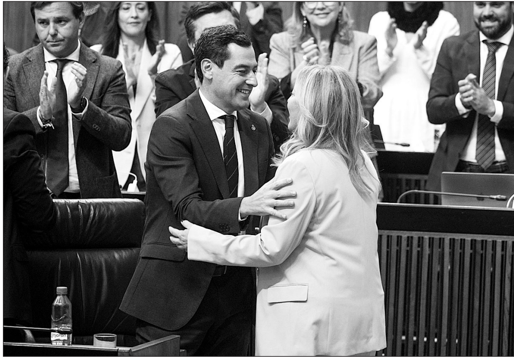
El presidente andaluz, Juan Manuel Moreno, felicita a la consejera de Economía, Carolina España, tras el rechazo de las enmiendas a la totalidad al proyecto de Presupuestos.

El proyecto de presupuestos del Gobierno andaluz para el próximo año recuerda que los objetivos estratégicos en el ámbito de los andaluces en el exterior son la divulgación, formación e investigación en este ámbito; el apoyo a las actividades de las comunidades andaluzas, la asistencia a andaluces en el mundo en situaciones de gran necesidad; asistencia e información a la población andaluza retornada y coordinación del Consejo de Comunidades Andaluzas. Asimismo, se quiere fomentar el gobierno abierto entre los an-