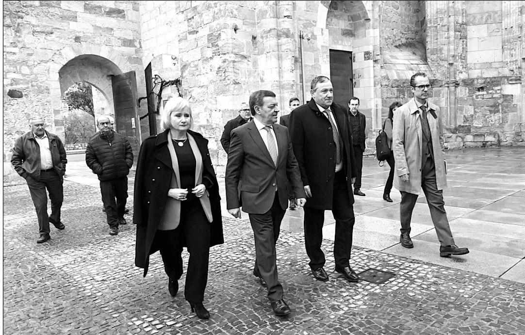
El consejero de la Presidencia, junto a otros participantes en la Jornadas Ibéricas 2023.

Además, resaltó el compromiso de la Junta de Castilla y León con