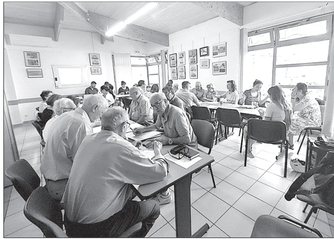
Reunión de trabajo de las asociaciones de la demarcación de Paris en la Casa de España en junio 2023.

Desde la Casa de España recuerdan que la entidad se ha enfrentado a desafíos en el pasado y actualmente se encuentra en una situación financiera saneada. La verdadera preocupación es la falta de voluntarios para liderar proyectos y la dependencia de sub-