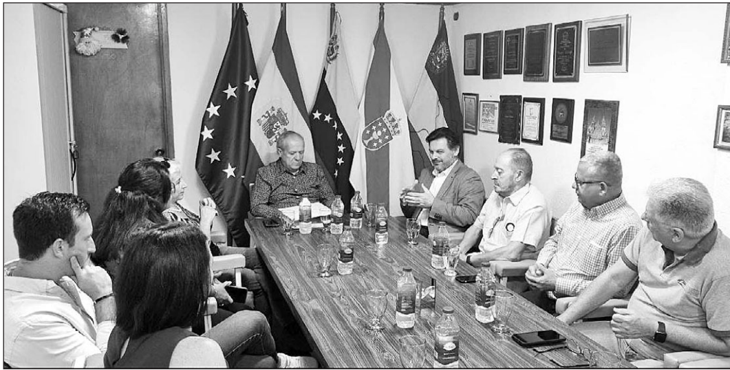
El secretario xeral se reunió con la directiva del Centro Gallego de Puerto La Cruz.

El secretario xeral visitó la entidad en el inicio de su viaje a Venezuela