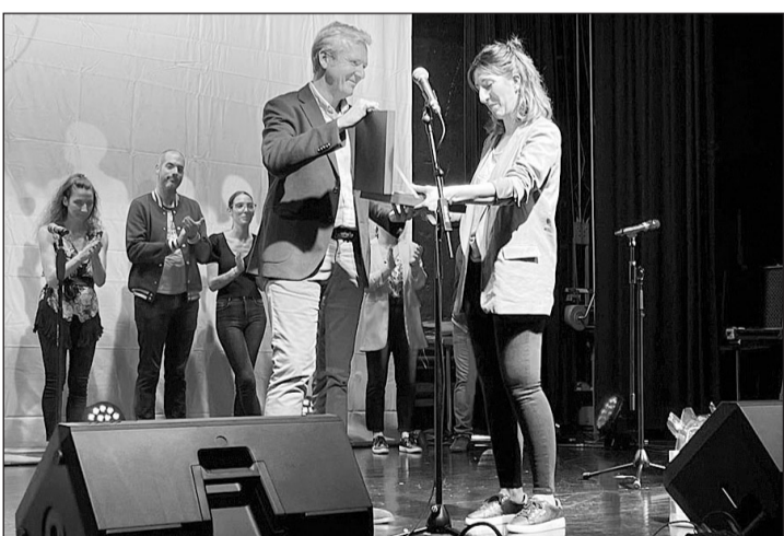
El presidente de la Xunta entrega una placa, durante el acto por el aniversario.

El presidente incidió en la importante labor que realizan entidades como As Xeitosiñas en apoyo de la colectividad