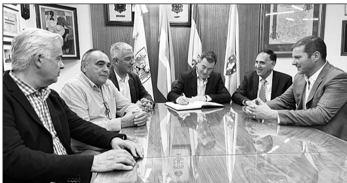
El conselleiro firmó en el libro de honor de la entidad.

Los actos incluyeron un amplio abanico de actividades para festejar la patrona del ayuntamiento de Lalín como música, baile, una misa y un desayuno en el propio centro. La institución anfitriona muestra así su decidido compromiso por divulgar la identidad gallega con actividades culturales entre sus casi 1.000 socios, las nuevas generaciones y el público en general.