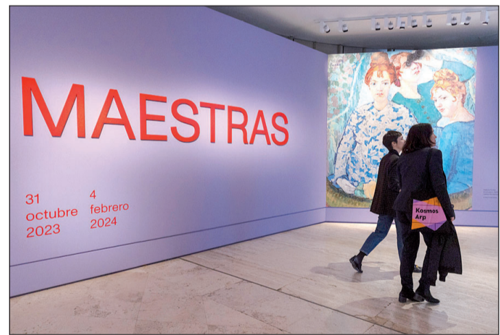
La exposición quiere reivindicar el papel de la mujer en el arte.