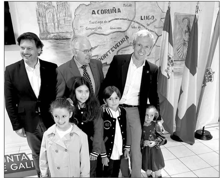
Rueda, Miranda y el presidente de Xeitosiñas, junto a los más pequeños.

El presidente de la Xunta participó en un encuentro con la colectividad gallega en Zúrich