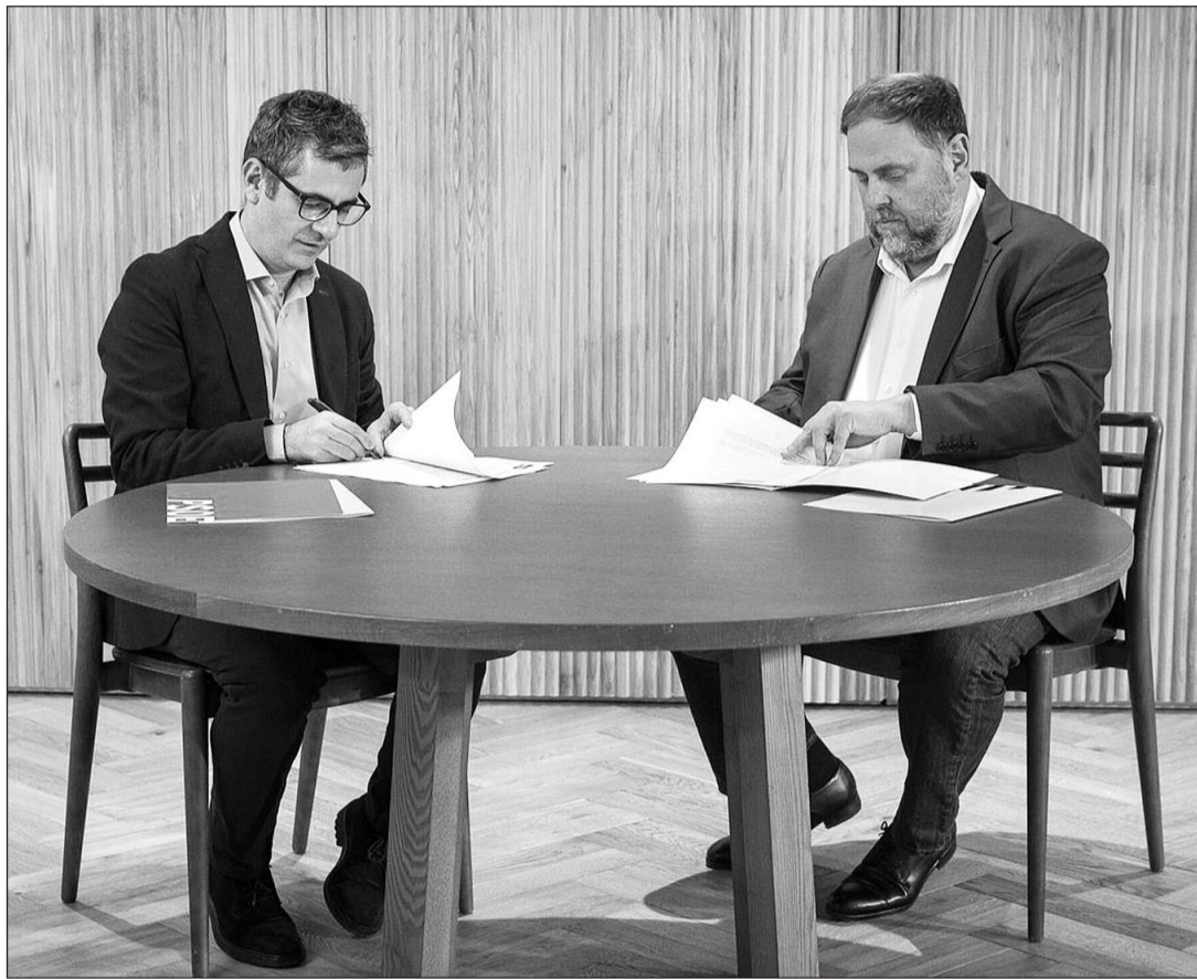
Félix Bolaños y Oriol Junqueras, en la firma del acuerdo entre el PSOE y ERC.

Con este documento los socialistas se garantizarían los votos a