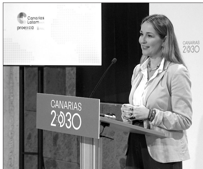
Una de las participantes en el programa Canarias Latam Tech.

En Gran Canaria, las empresas también aprovecharon para asistir al evento ‘Canarias Destino Startup’, en el que las empresas tuvieron la oportunidad de conocer a compañías canarias y otros agentes del ecosistema.