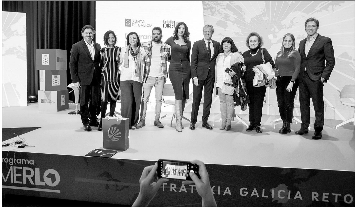
Alfonso Rueda, acompañado por Antonio Rodríguez Miranda, clausuró el encuentro ‘Retorno Emprendedor de la Rede Programa Merlo’.

Desde que se puso en marcha el programa, se subvencionaron 700 proyectos de gallegos retornados de los cinco continentes, de más de 40 países y de todas las edades y a ello se refirió el presidente gallego, quien destacó: “Son muchos, y la mayoría continúa, con lo difícil que es emprender en un país desconocido, con normas diferentes y con necesidades de adaptación” a las nuevas circunstancias.