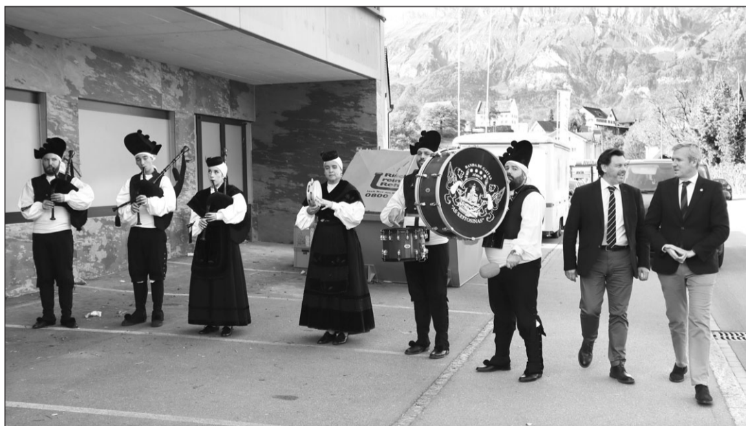
El grupo folclórico de la asociación As Xeitosiñas estuvo presente, acompañando a las autoridades de la Xunta.