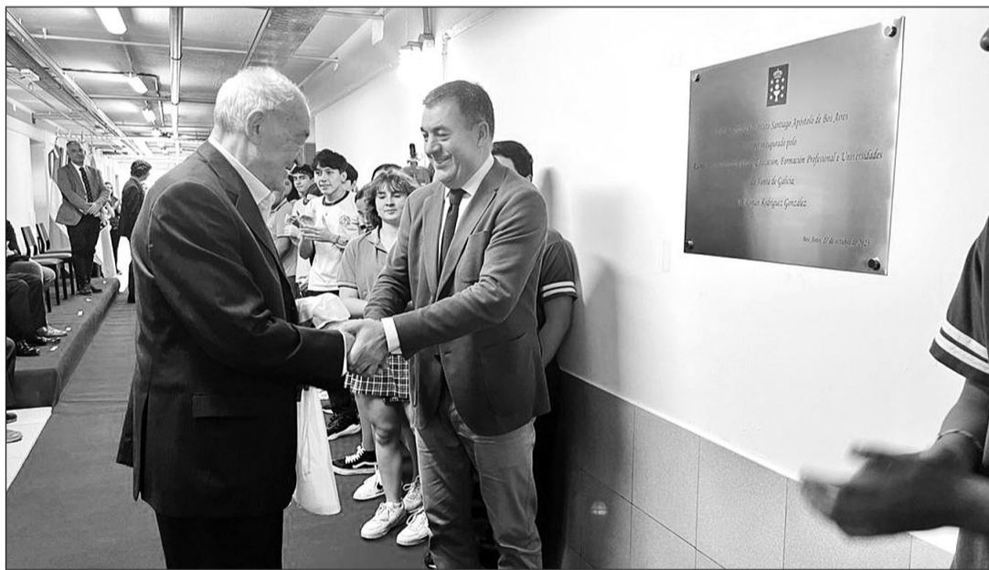
El conselleiro inauguró la renovación de la sexta planta del edificio que alberga esta institución académica.

un honor poder participar en un acto tan emocionante, tan lleno de presente, tan lleno de futuro, como es inaugurar una planta en este colegio, lo que muchos gallegos conocemos y que llevamos en el corazón”, añadió.