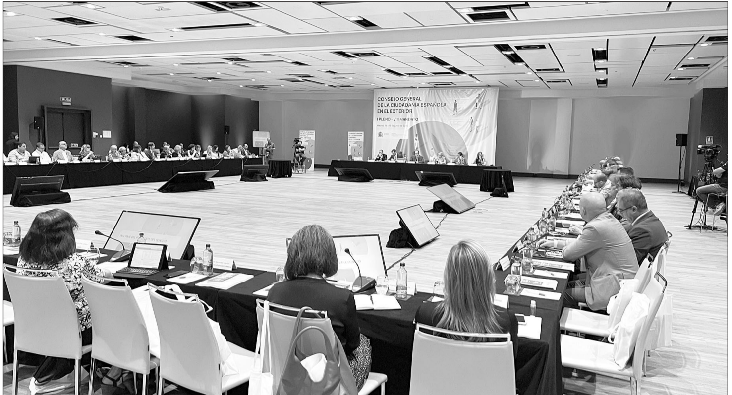
Participantes en el último Pleno del CGCEE, celebrado en el mes de junio de 2022.