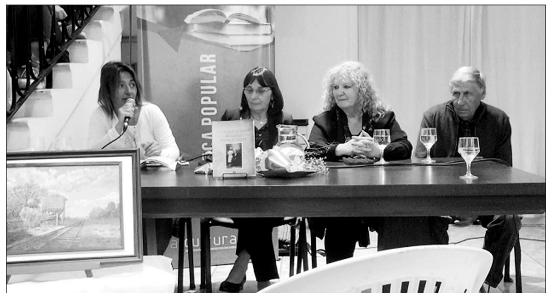
La autora –2ª izda.– y la presidenta de la entidad asociativa fueron las encargadas de presentar el libro.