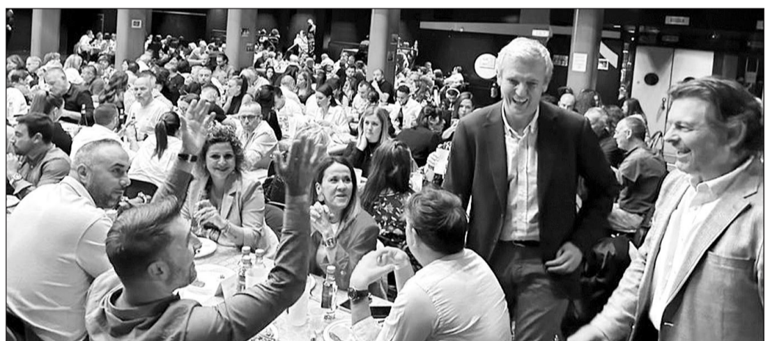
Los dirigentes de la Xunta saludaron a los asistentes a la celebración.

REDACCION, Ginebra El presidente de la Xunta, Alfonso Rueda, puso en valor la contribución de las entidades gallegas presentes en el exterior a la hora de difundir la lengua y la cultura de la comunidad en la diáspora. Así lo destacó, el pasado día 28, durante la celebración del 50º aniversario de la Irmandade Galega na Suíza, de la que ensalzó su función como nexo de todos los gallegos en Ginebra y en su relevante papel a la hora de transmitir y difundir las costumbres gallegas a las nuevas generaciones. Durante el acto, en el que estuvo