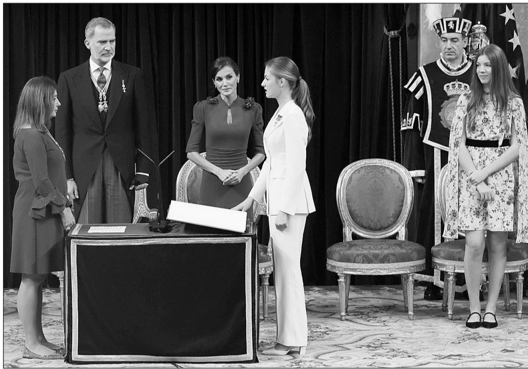
La princesa Leonor jura la Constitución en presencia de su familia y de la presidenta del Congreso.

El presidente del Gobierno en funciones, Pedro Sánchez, y los presidentes del Congreso y el Senado, Francina Armengol —fue la responsable de tomar juramento a la Princesa— y Pedro Rollán, respectivamente, así como representantes de los partidos políticos, acompañaron a la heredera en su jura, que contó, sin embarco, con ausencias notables, como la de las dos ministras de Podemos, Irene Montero y Ione Belarra, y el ministro de Consumo, Alberto Garzón. Los representantes de ERC, Junts, EH Bildu, PNV, Podemos y BNG tampoco estuvieron presentes en el