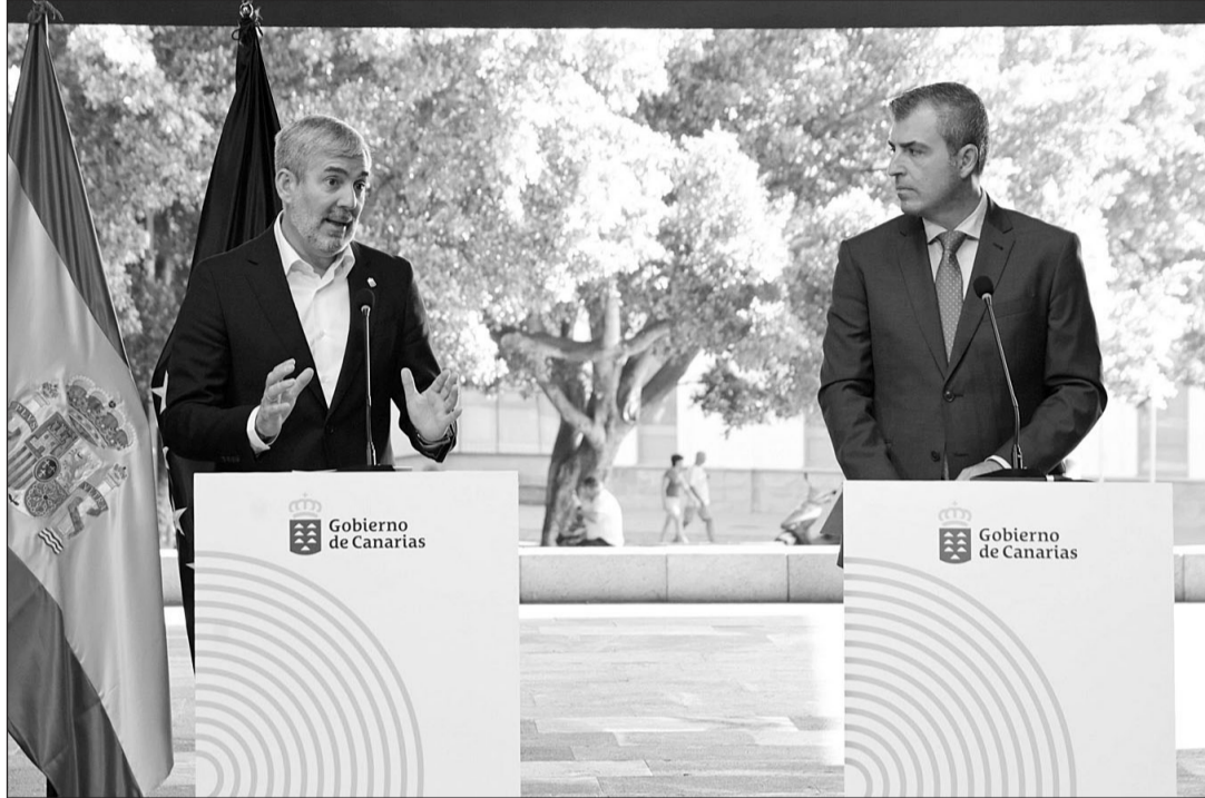
Fernando Clavijo y Manuel Domínguez, durante la presentación del balance de sus 100 días de Gobierno.

El presidente de Canarias considera la cohesión como otra de las señas de identidad de su Gabinete. “Me comprometí a liderar un Gobierno unido con el objetivo de abordar de cara, sin ponernos de perfil, los numerosos retos a los que se enfrenta Canarias. Así lo hemos hecho”, ha resaltado para agradecer a las cuatro fuerzas políticas que sustentan al Ejec