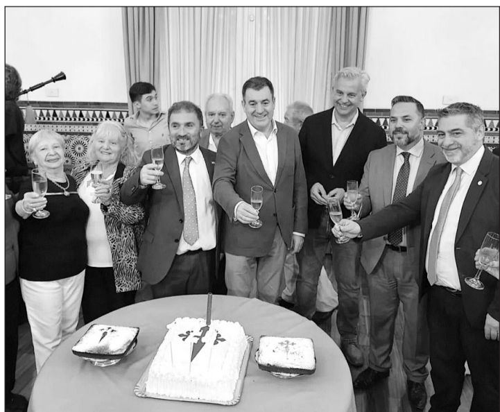
El presidente de la entidad, el conselleiro y otras autoridades, durante el brindis.

Posteriormente, el representante del Gobierno gallego mantuvo una reunión con miembros de la entidad social Ospaña, institución fundada en 2010 con el objetivo de atender las necesidades del colectivo de españoles emigrantes en Argentina que no contaban con una cobertura sanitaria suficiente.