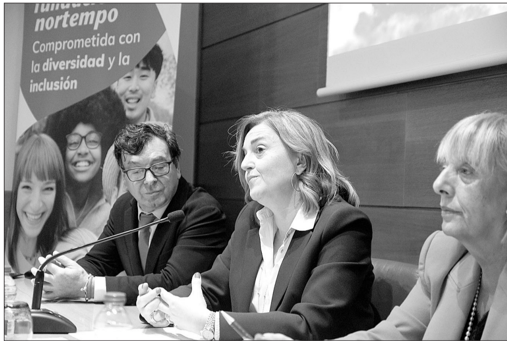
La conselleira Elena Rivo, durante la presentación del programa, en Ourense.

En concreto, el programa incluye acciones formativas para la adquisición de capacidades relacionadas con el puesto que se va a ocupar, a lo que se incorporarán con un contrato indefinido. También se sufragarán los gastos de traslado y se concede una ayuda de 1.300 euros para el inicio de la vida en nuestra comuni-