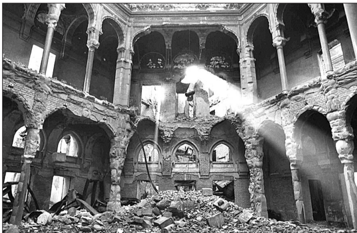
Fotografía de Gervasio Sánchez en donde se muestra un rayo de luz entre las ruinas del ayuntamiento de Sarajevo.

Tras conocer la noticia, Gervasio Sánchez, visiblemente