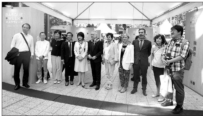
El lehendakari, durante la inauguración de la Basque Week.

El programa incluyó: 27 actuaciones y exhibiciones desde el esce-