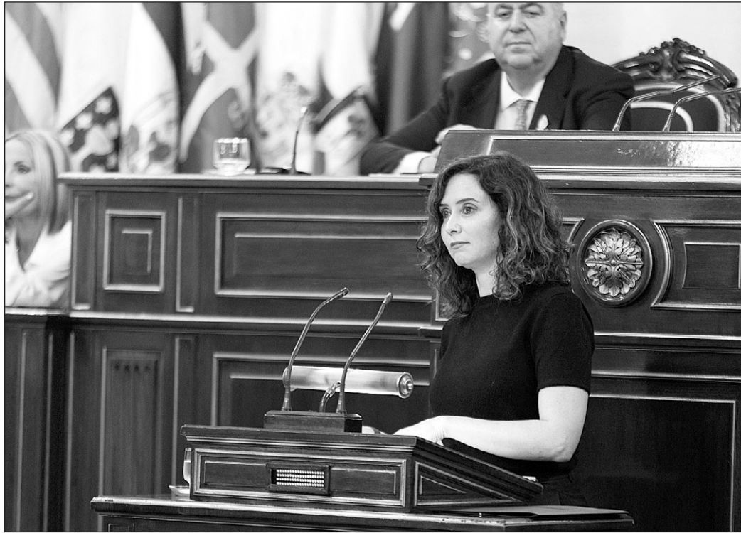
La presidenta de la Comunidad de Madrid, Isabel Díaz Ayuso, durante su intervención en la Comisión General de las Comunidades Autónomas del Senado.

El presidente catalán (ERC) tomó protagonismo en el acto y se mostró seguro de que se votará: “Cataluña votará en refe-