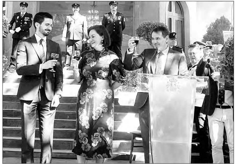
El embajador en México brinda con el resto de invitados en la celebración de la efeméride.