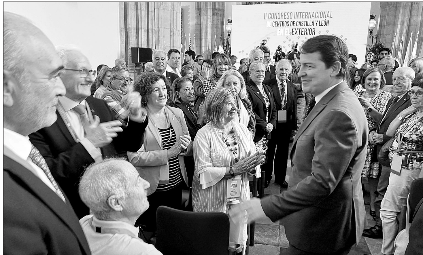
Fernández Mañueco saludó a los participantes en el II Encuentro Internacional de Centros de Castilla y León en el Exterior, el día de la inauguración.

Por eso, la Administración autonómica puso en marcha el programa ‘Pasaporte de vuelta’, que cuenta con una ayuda de 6.600 euros para facilitar el retorno desde fuera de España a los que quieran regresar, así como un programa pionero “para facilitar la vuelta de aquellos castellanos y leoneses que viven en otras comunidades autónomas”. Asimismo, anunció que, en colaboración con la CEOE, con las cámaras de comercio y con la Confederación Internacional que se encarga de organizar este evento, se destinarán 300.000 euros para “promover