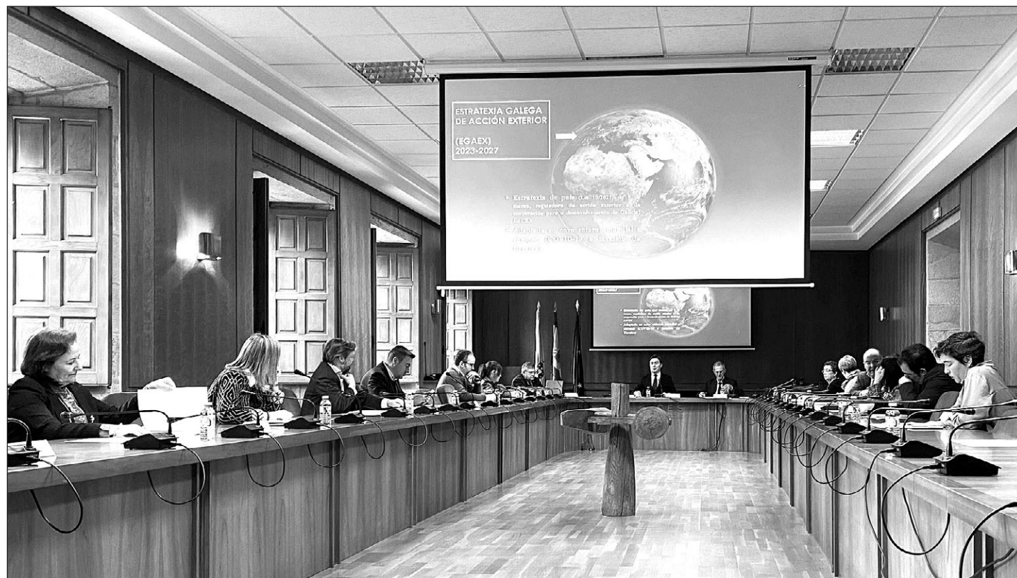
El Consello Galego de Acción Exterior, durante su reunión del pasado mes de marzo, en el que dio su informe favorable a la segunda EGAEX. GM

todos los instrumentos de acción exterior tengan la debida calidad.