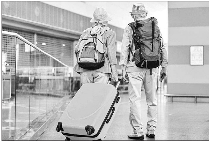
Se podrán anotar mayores de 65 años que residan en países europeos.

También podrán apuntar españoles de origen emigrante que hayan retornado a España, siempre que sean pensionistas