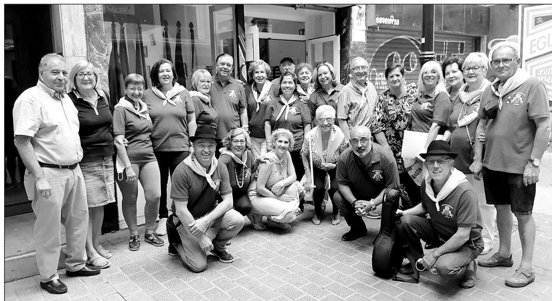
Miembros de la Casa de Canarias de Aragón, en la puerta de la sede de la entidad.

nario para ello”, pero hay muchas asociaciones en el exterior en Uruguay, Venezuela y Cuba y en algunas de ellas hay dotación para alimentos y medicamentos.