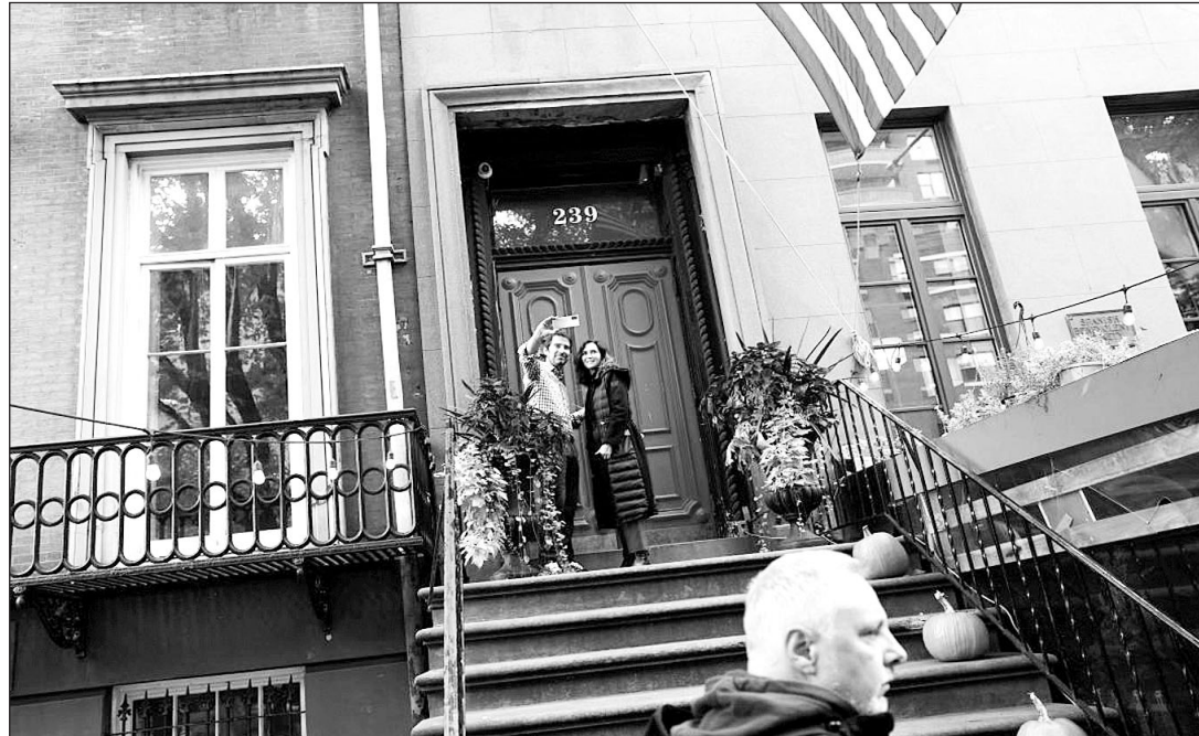
La presidenta de la Comunidad de Madrid, en la entrada de la sede de La Nacional, en Nueva York.

“El español no puede quedarse fuera en todo el lenguaje que construye internet y el mundo digital. Ahí está el reto y ahí tenemos que afrontarlo”, se ha dirigido la presidenta a los jóvenes estudiantes con los que se ha reunido en esta escuela de negocios que ha visitado en el marco de la agenda programada en su viaje oficial a esta ciudad de EE