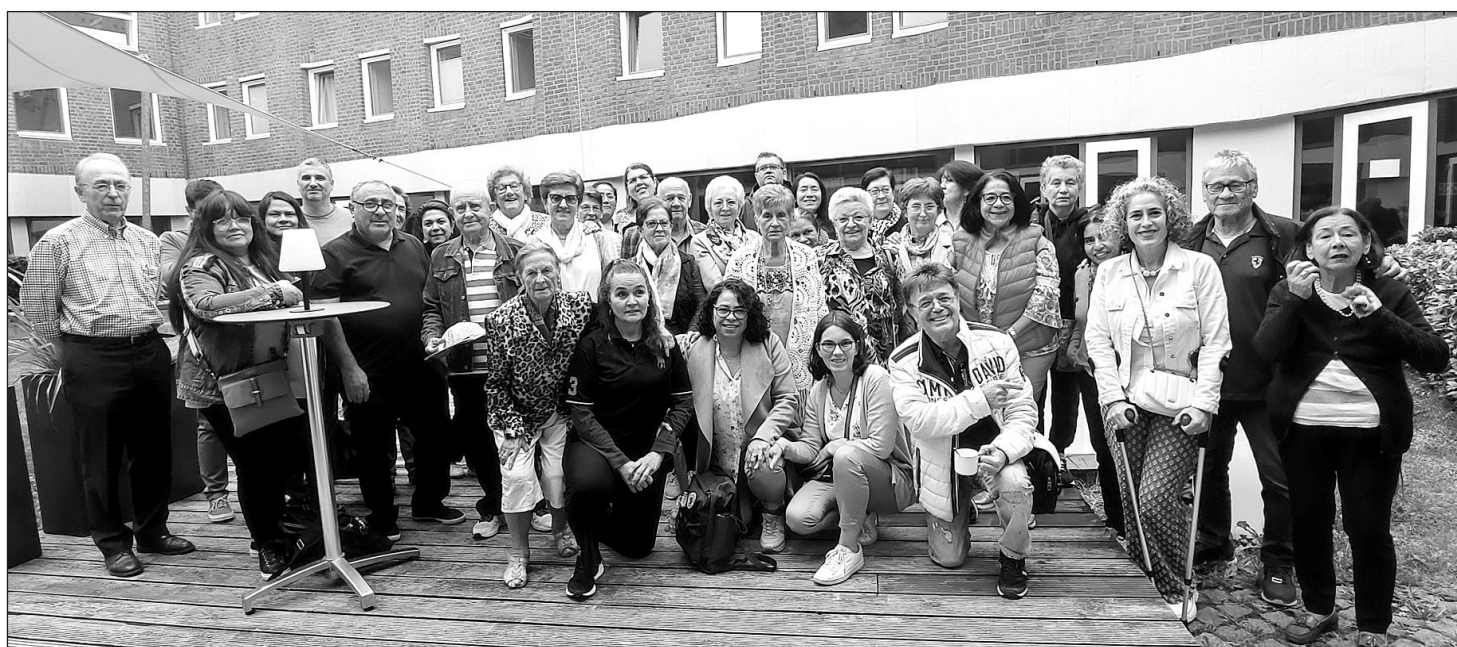
Foto de familia de los asistentes a este último seminario del año de Adentro.