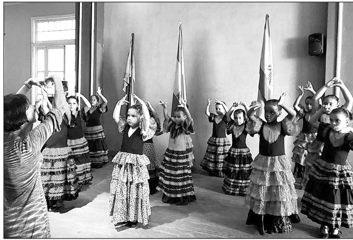
Las más jóvenes demostraron sus cualidades en este acto festivo.