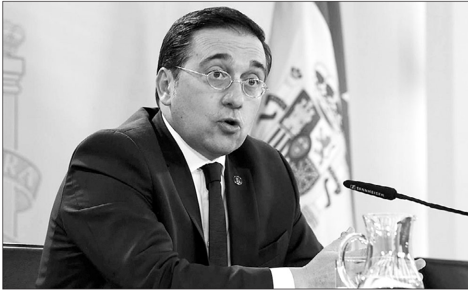
Albares, durante la presentación del Plan de Acción para 2023-2024.

REDACCION, Madrid El ministro de Asuntos Exteriores, Unión Europea y Cooperación en funciones, José Manuel Albares, presentó, este martes 17, un Plan de Acción para el periodo 2023-2024 en aplicación de la Guía de Política Exterior Feminista. A través de este plan se potenciarán resultados concretos en materia de desigualdad y discriminación de género; la igualdad en el servicio exterior; y prevé mecanismos de interlocución y coordinación entre los diferentes actores, así como la rendición de cuentas.