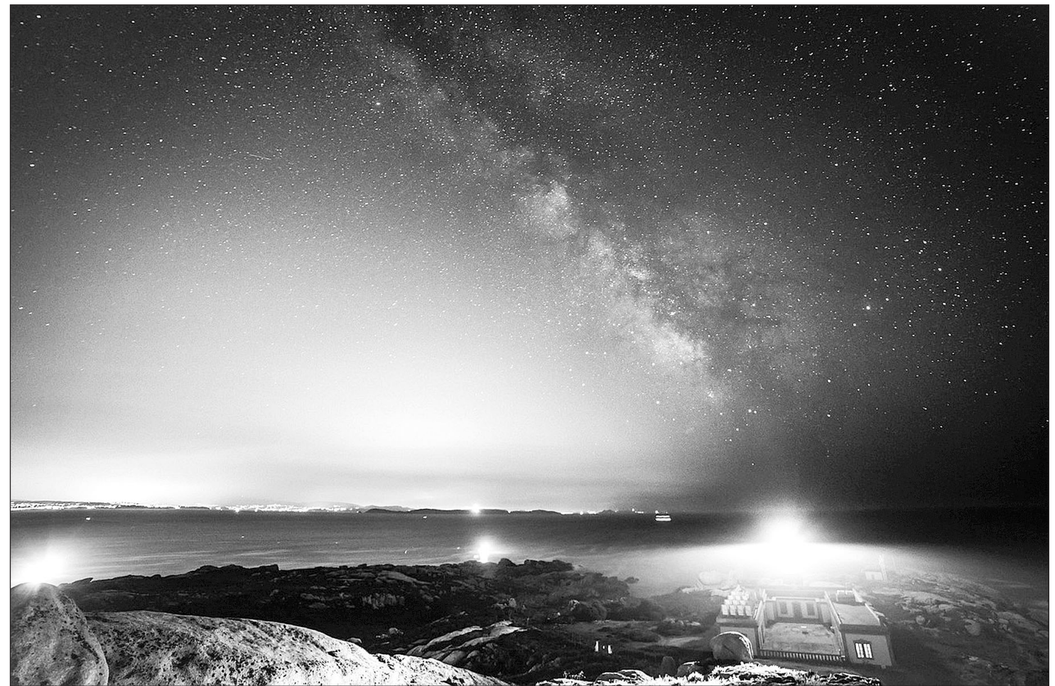
Un cielo totalmente estrellado visto desde el Parque Nacional das Illas Atlánticas.

Los Destinos Turísticos Starlight son lugares visitables que disfrutan de excelentes cualidades para la contemplación de los cielos estrellados