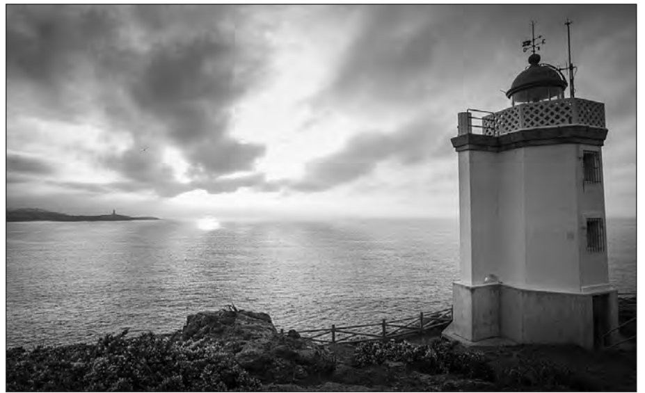
El destino Starlight de Muras depara unos cielos estrellados a los observadores.