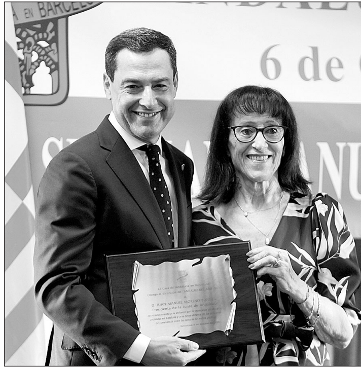
El presidente de la Junta recoge el galardón que le otorgó la Casa de Andalucía en Barcelona.

Apelo a esa Cataluña universal, madura y abierta. Por encima de todo, incluso pese a las sombras que siempre hay, merece la pena conservar este proyecto común que nos dimos al amparo de nuestra Constitución y sobre el que se cimentó nuestra democracia y para eso necesitamos altura de miras, sentido de Estado y máxima responsabi-