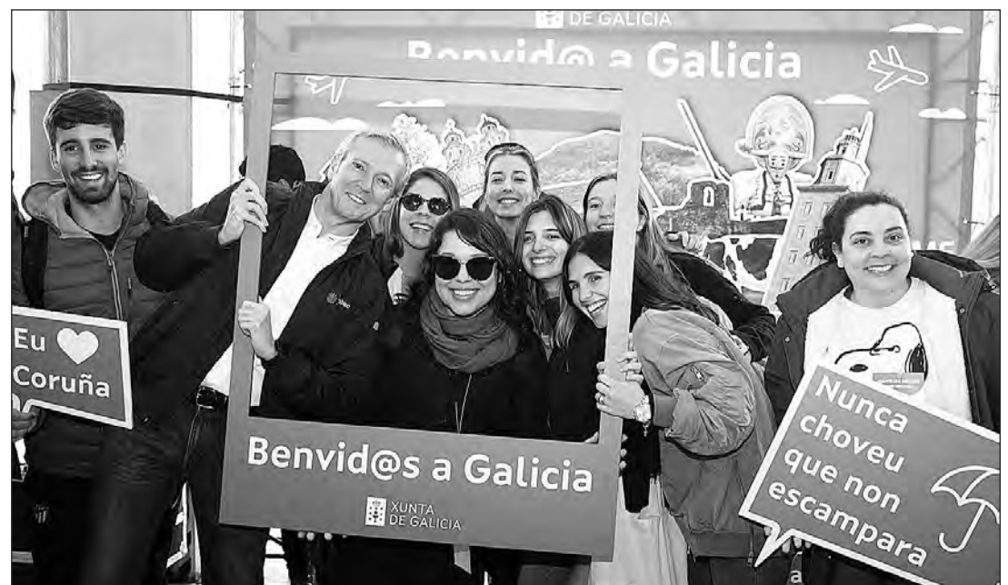
El presidente de la Xunta posa con algunas de las becarias en el acto de Oroso.

La Xunta incrementa un año más la cuantía de estas becas que oscilarán entre los 7.500 y 12.000 euros en función de la duración del máster cursado y el continente de origen de los beneficiarios. En concreto, las ayudas – que sufragan los costes del viaje, a la manutención, el alojamiento y la matrícula – aumentan este curso un promedio de 500 euros. El presupuesto del Gobierno autonómico para estas bolsas es de 2,3 millones de euros, un “destino de fondos públicos potente, pero que vale la pena, sin duda”, tal y como indicó Rueda.