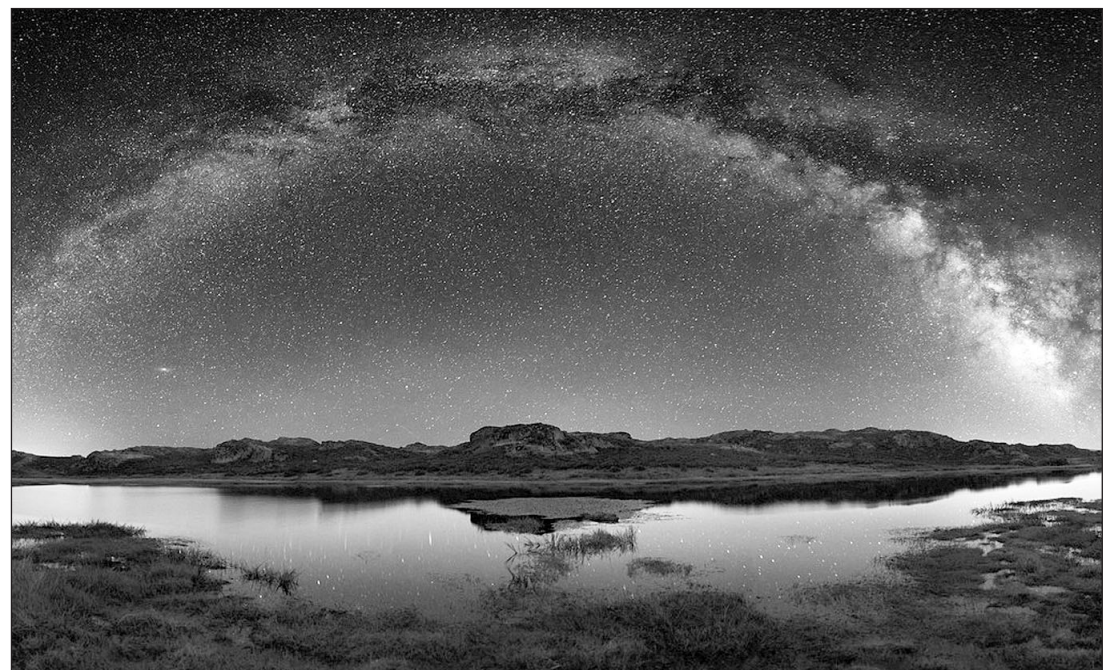
El destino Pena Trevinca ofrece un firmamento espectacular en las noches claras.

Además de eso, posee un gran valor ambiental, ya que gran parte de su territorio forma parte de la Red Natura 2000 y alberga por lo menos dos Lugares de Impor-