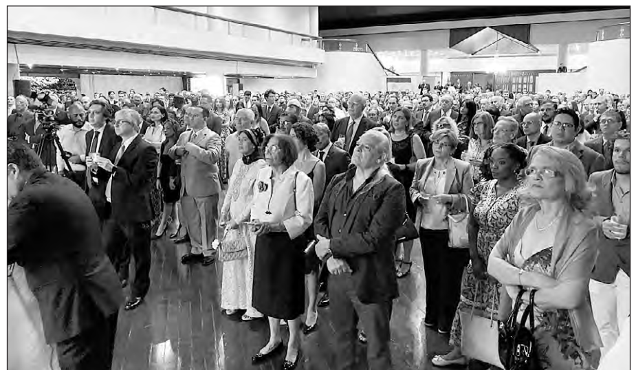
Cerca de 800 invitados se reunieron en la fiesta celebrada por la Embajada en Venezuela.