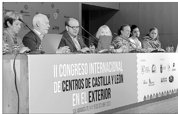
Representantes de cada grupo de trabajo presentan las conclusiones.

También se pidió que se facilite a los jóvenes conocer la tierra de la que proceden, facilitándoles visitar la comunidad autónoma. Por último, se insta a la generación inter-