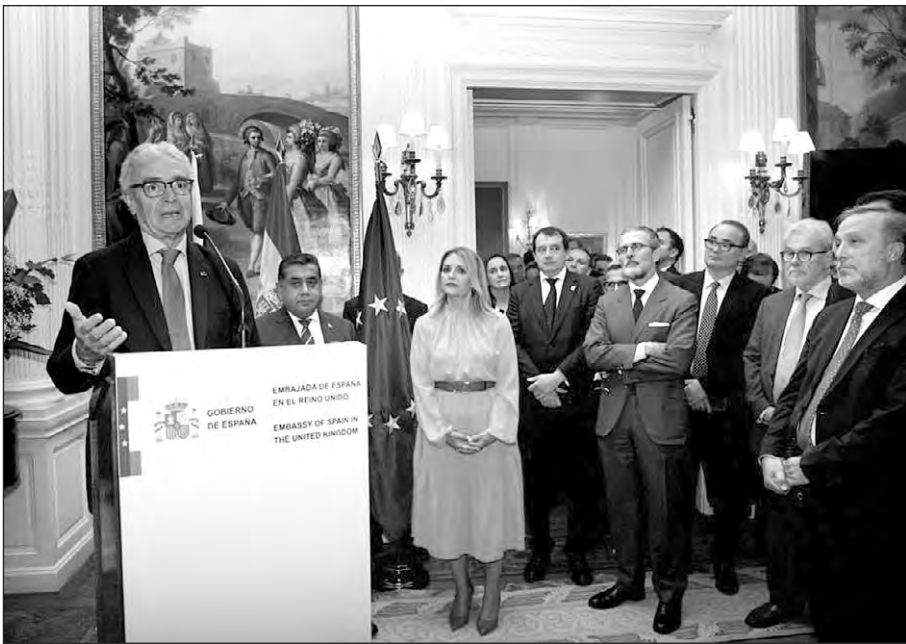
El embajador de España en Reino Unido, durante su intervención en el acto en Londres.