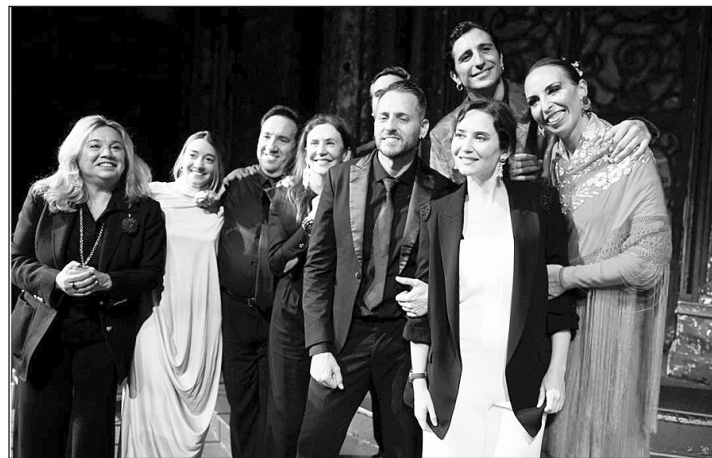
Isabel Díaz Ayuso posa junto a los protagonistas de ‘Authentic Flamenco’.

Isabel Díaz Ayuso asistió el domingo 15 en la Fundación Ángel Orensanz de Nueva York al espectáculo ‘Authentic Flamenco’, donde ha destacado el importante papel que desempeña la región como capital mundial de este arte tan arraigado a la tradición española y declarado Patrimonio Cultural In-