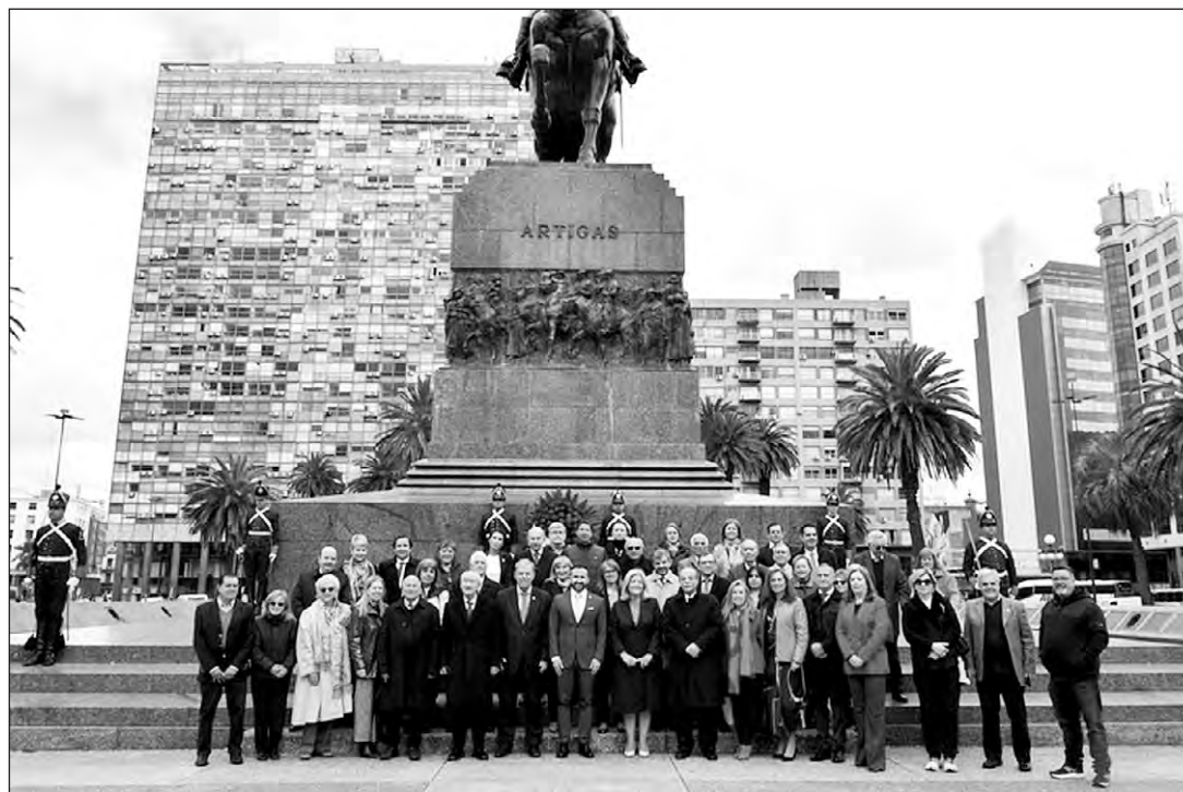
Autoridades y representantes de la colectividad en Uruguay, en la ofrenda floral ante el monumento de Artigas.

bajada de España en Uruguay y la FIEU (Federación de Instituciones Españolas en Uruguay), ha contado con la presencia de todos los consejeros, el Consulado de España, la delegada de la Xunta de Galicia y presidentes de distintas instituciones españolas en el país.