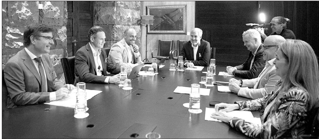
El presidente Clavijo, reunido con los portavoces parlamentarios.

El Pacto Canario por la Migración rubricado en la sede de Presidencia del Gobierno pide al Estado para que recupere la Comisión Delegada de Asuntos Migratorios, además de establecer “un sistema de coordinación permanente dentro del Gobierno del Estado” y un “modelo de integración y coordinación tanto de la Administración General del Estado como de las diversas comunidades autónomas y de los ayuntamientos” para mejorar la respuesta a la crisis migratoria.