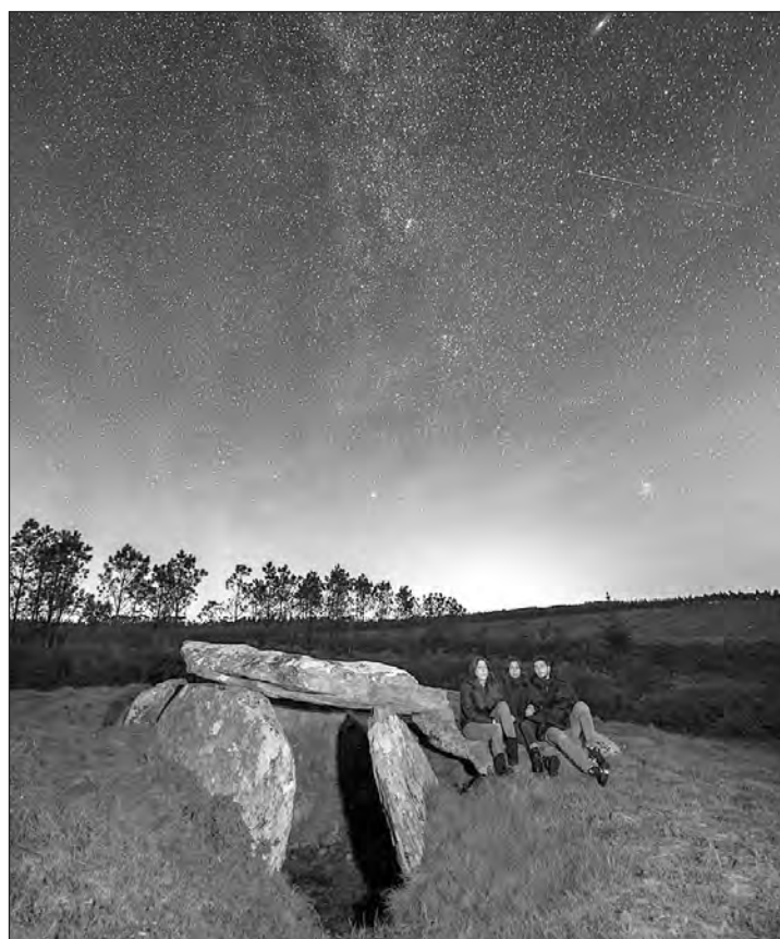
El destino Starlight de A Costa da Morte se extiende a lo largo de docenas de kilómetros.