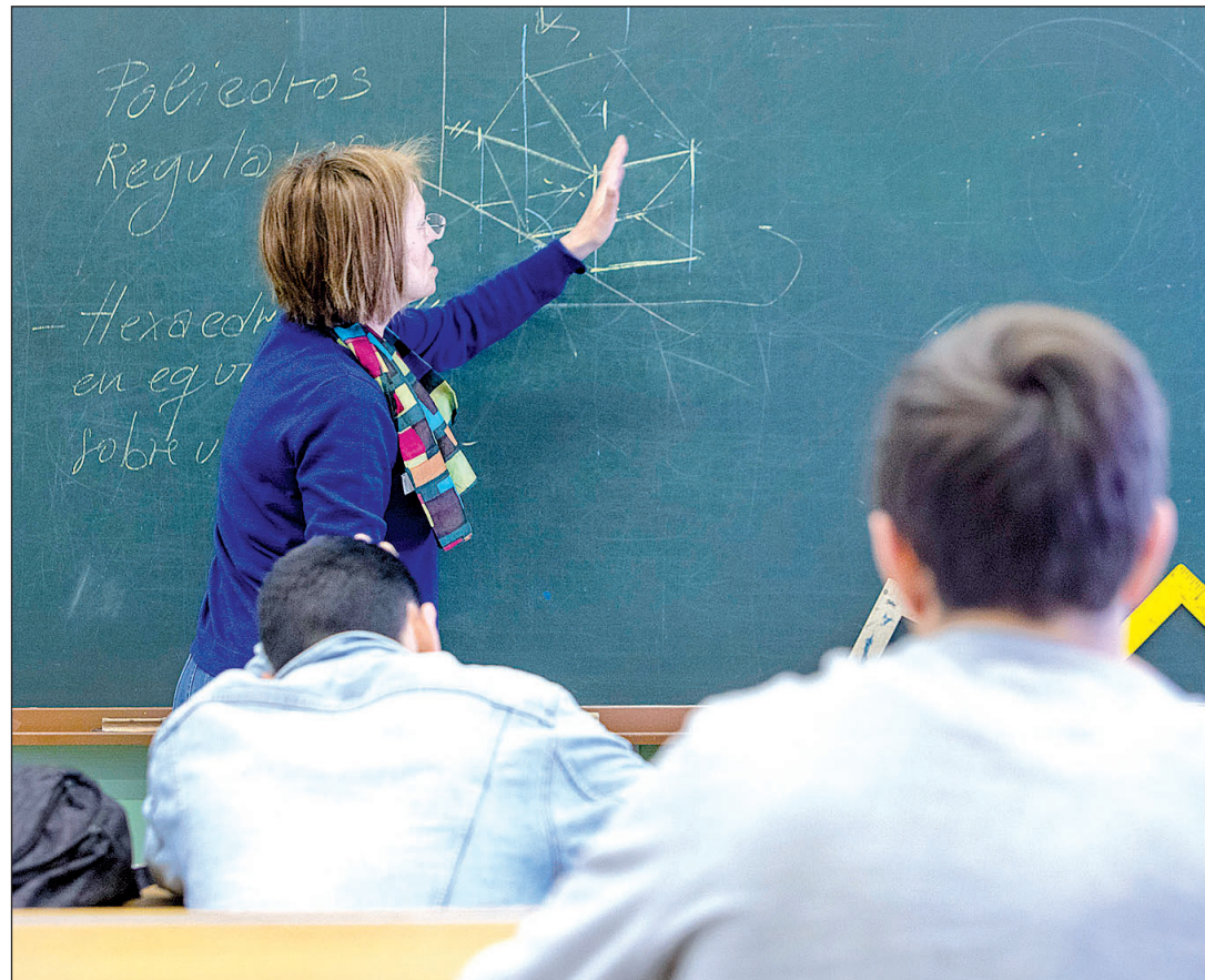
Este mes de septiembre, en Galicia se abrieron las puertas de las aulas para más de 311.000 alumnos de Infantil, Primaria, Educación Especial, ESO y Bachillerato.

El desarrollo tecnológico y la digitalización no son un fin en sí mismos, sino un medio de apoyo al proceso de aprendizaje. En este sentido, se va a avanzar en la aplicación de nuevas metodologías didácticas y en la formación de docentes y alumnos para el uso