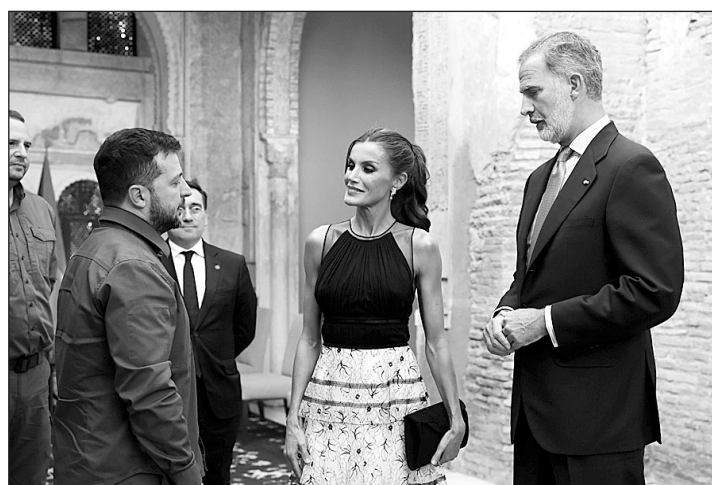
Zelenski conversa con los Reyes de España en la Cumbre de Granada.

vierno. A la cumbre, a la que asistieron los Reyes de España y en la que Pedro Sánchez ejerció de anfitrión, estaban invitados los jefes de Estado o de gobierno de los 27 países que componen la UE y otros 20 de países del continente, además de los presidentes de las instituciones comunitarias (Consejo, Comisión y Parlamento) y el alto representante de la política exterior, Josep Borrell. Sin embargo, hubo dos ausencias destacadas: la del presidente turco, Recep Tayyip Erdogan, que se ha excusado por problemas de salud; y el de Azerbaiyán, İlham Aliyev, que ha cancelado su viaje por discrepancias con Alemania y Francia sobre el conflicto de Nagorno Karabaj.