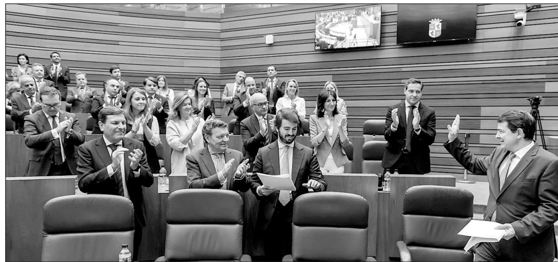
Alfonso Fernández Mañueco es aplaudido tras su intervención en el Debate del Estado de la Autonomía.

se refirió a las ayudas al retorno que concede la Junta a los que residen fuera y se disponen a volver, a los que indicó que "tienen a su disposición el programa 'Pasaporte