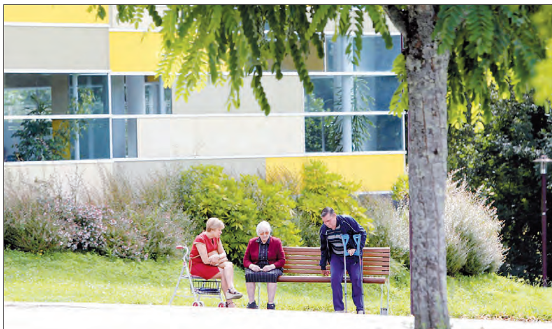
Los centros de mayores del futuro son más humanos, más acogedores y más confortables.

La nueva tecnología también permite informar a los trabajadores de una posible caída de la cama, de