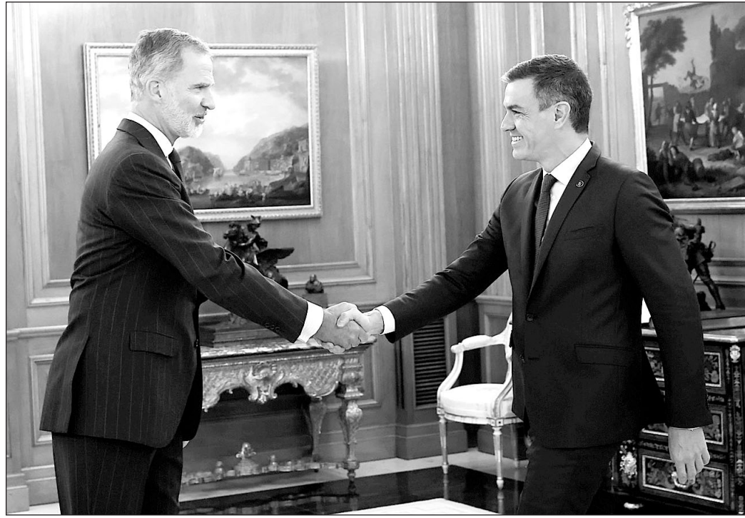
El Rey recibió, el pasado día 3, a Pedro Sánchez para encargarle formar gobierno.

De resistirse el acuerdo más allá de noviembre, España en-