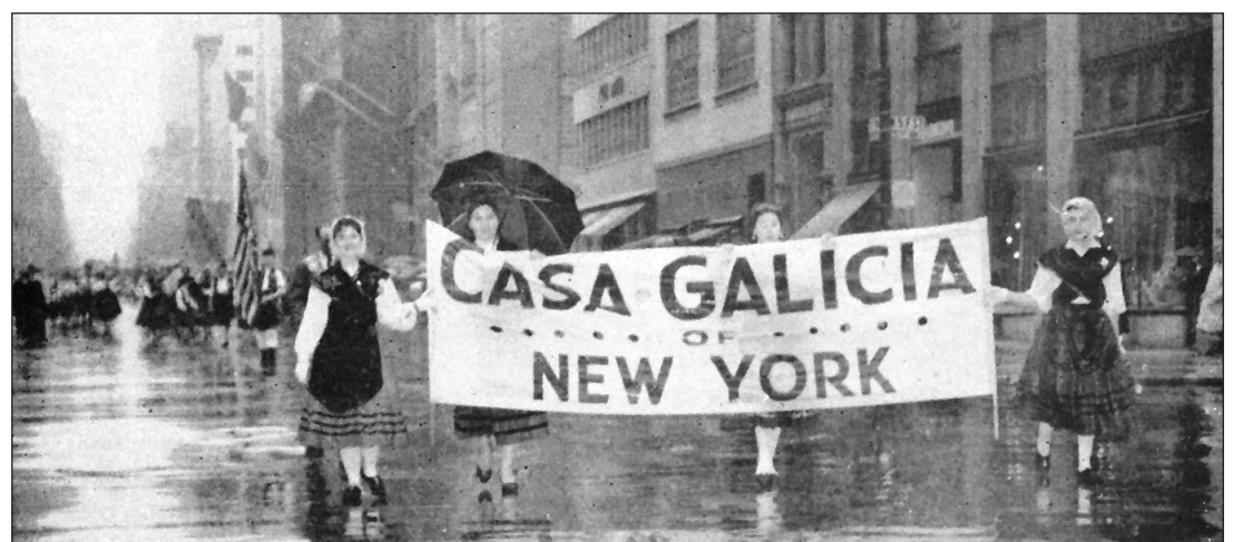
Celebración del 10º aniversario de la Casa de Galicia de Unidad Gallega de Nueva York, 28 de octubre de 1950.

dos que más emigrantes gallegos aglutinó, junto con el vecino de Nueva Jersey, aunque también hay presencia gallega en Luisiana y California. Y Sada fue uno de los municipios de la costa coruñesa con mayor tasa de emigración hacia Estados Unidos.