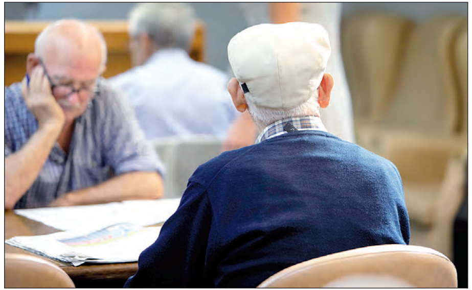
Los avances tecnológicos en los centros gallegos para mayores permitirán que sus usuarios ganen en seguridad y confort.