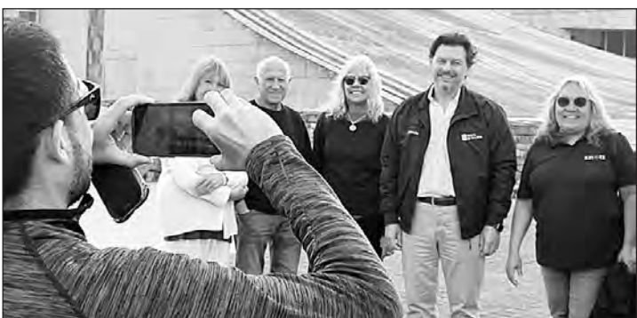
Miranda compartió un encuentro con el grupo del Centro de Carballiño. GM

les, culturales y deportivas y promocionar la cultura y la tradición gallegas entre los descendientes gallegos.