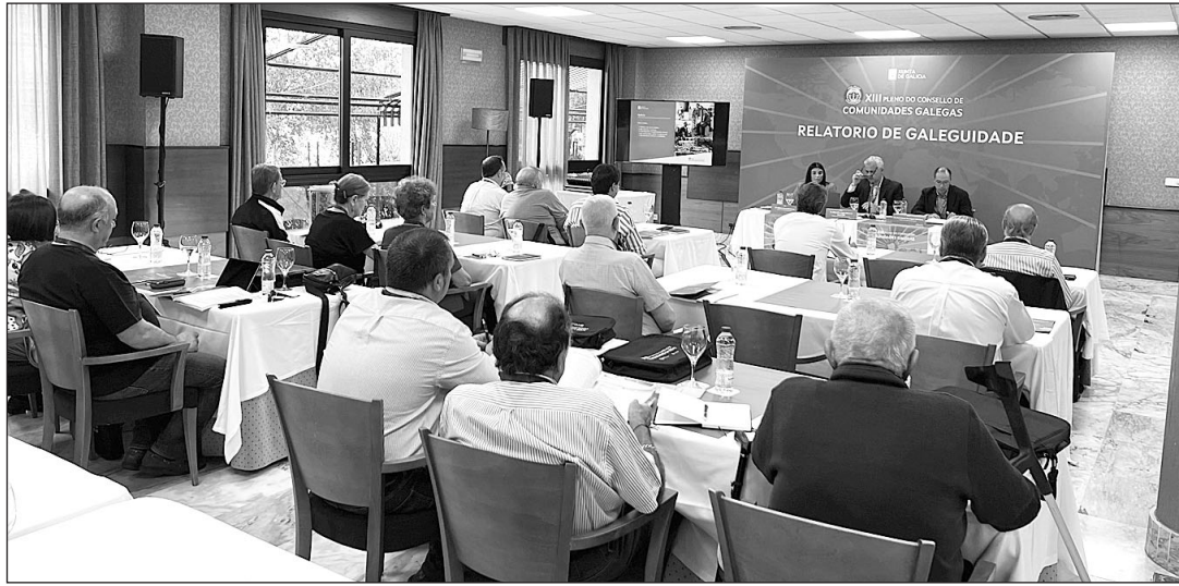
Los integrantes del Relatorio de Galeguidade, el pasado septiembre, en Ourense.

Conscientes de que Galicia luce hoy como una comunidad autónoma "actual y moderna", fruto del "trabajo constante de un pueblo orgulloso que no olvida sus raíces ni a los hijos de la diáspora re-