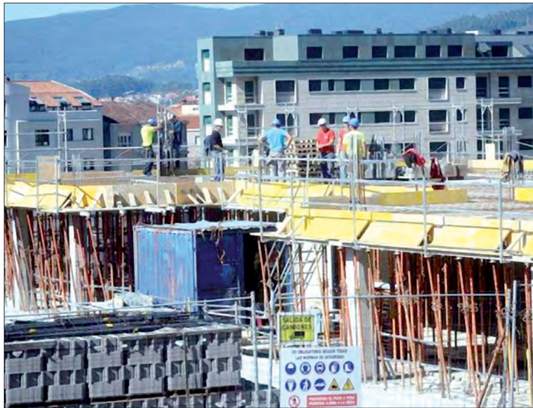
Parte de la oferta de trabajo se dirige a personas con experiencia en el campo de la construcción.

La medida, además de garantizar a los gallegos en el exterior la posibilidad de retornar, también está encaminada a fijar población en el medio rural, ampliar las oportunidades laborales de los emigrantes y facilitar el