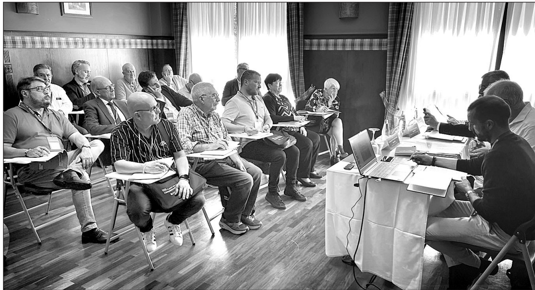
Participantes en el Relatorio de Cultura, durante el XIII Pleno del Consello de Comunidades Galegas.

Para lograrlo, proponen “dotar a la industria tecnológica de las bases necesarias para que desarrollen productos en lengua gallega”, avanzando en la puesta a disposición de los