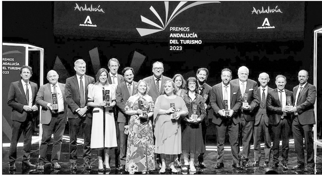
Premiados y autoridades posan tras el acto de entrega de los Premios Andalucía de Turismo 2023.

Los galardones vienen a agradecer la labor en favor del turismo en Andalucía en diez categorías, como son ‘Excelencia Turística de Instituciones, Asociaciones o Fundaciones’, ‘Trayectoria empresarial’, ‘Trabajador o Trabajadora’,