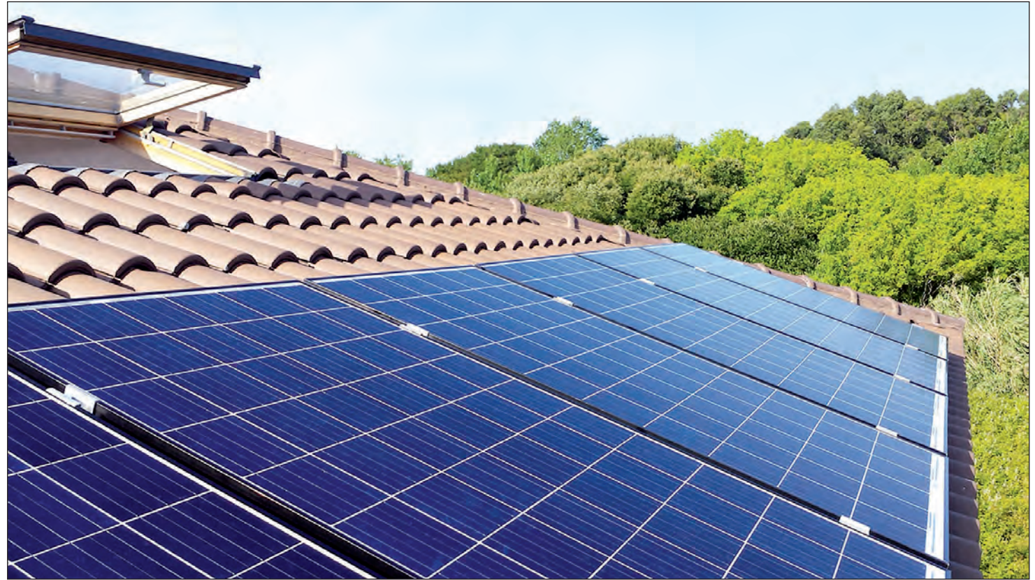
La utilización de placas solares permite reducir la factura energética de los hogares.

La Axenda Enerxética promueve el desarrollo de energías renovables, el autoconsumo y la descarbonización