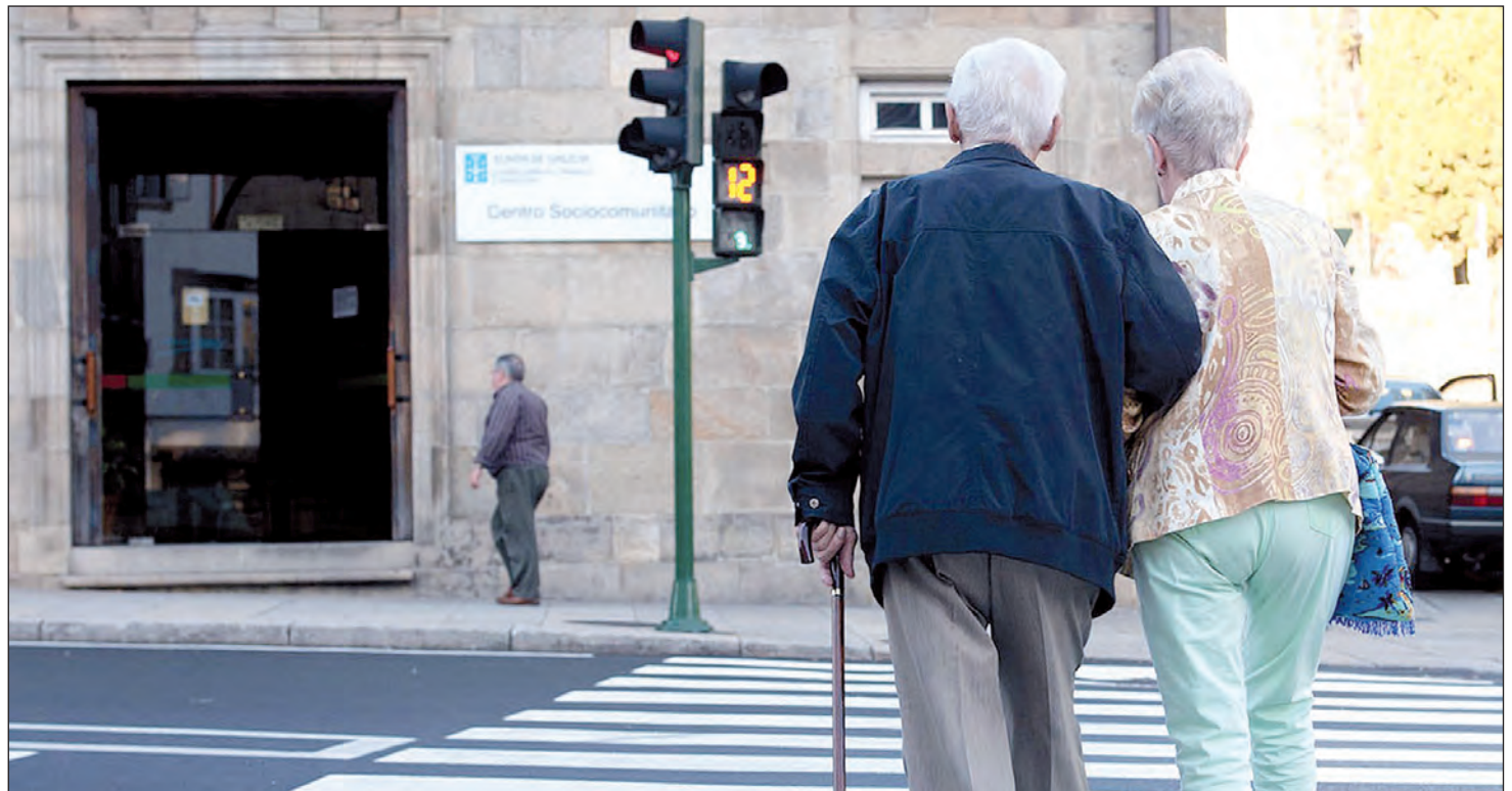
Los cuidados de proximidad son otra herramienta básica para garantizar que los mayores disfruten de esta etapa de sus vidas sin abandonar sus entornos.

La pandemia supuso una prueba de estrés a todos los niveles, pero muy especialmente en las residencias de mayores, al tratarse de centros en donde convivían personas vulnerables. Galicia no solo logró convertirse en la comunidad autónoma con la tasa de mortalidad más baja de toda la Península, sino que aprovechó un momento tan convulso para diseñar los centros del futuro: más humanos, más acogedores, más confortables... en definitiva: más hogares.