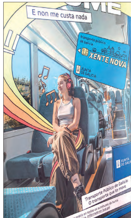
Cartel de la campaña 'Móvome', que trata de incentivar un modelo más sostenible de movilidad.

ron que, durante los primeros seis meses de este año, el transporte público de Galicia registrara 18 millones de viajes, un 17% más que en el mismo periodo del año pasado. Durante el verano se mantuvo esta progre-