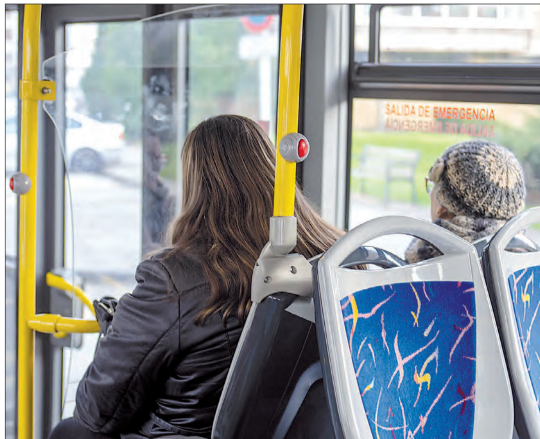
La Xunta destina casi 100 millones de euros al año para mejorar el transporte público.