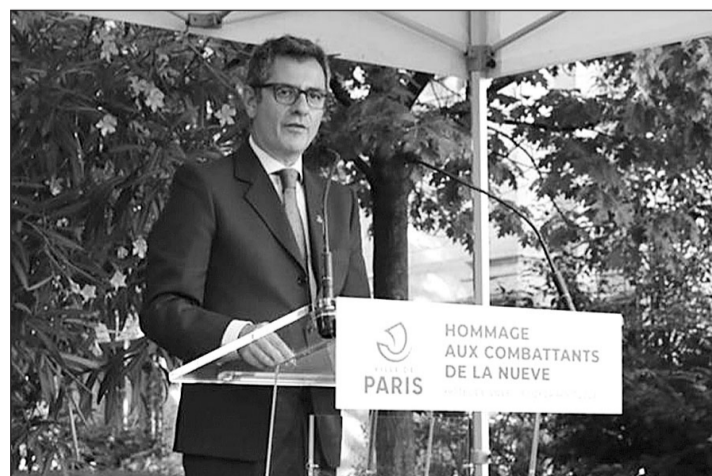
El ministro Bolaños, durante su intervención en el homenaje a ‘La Nueve’.

Durante su intervención, también ha puesto en valor el avance que ha supuesto la aprobación de la Ley de Memoria Democrática en España: “Una ley humanista que pone en el centro a las víctimas de la guerra de España y de la dictadura franquista, y que nos conecta con la memoria democrática europea y el Derecho Internacional”. En este sentido, el ministro ha destacado los valores democráticos de libertad,