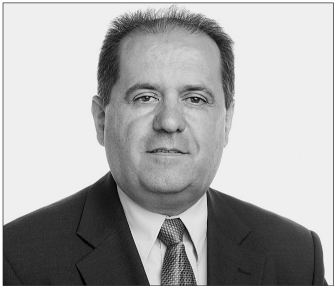
Perestelo fue diputado en el Congreso y en el Parlamento canario..

En estos momentos estoy todavía en el aire, pero me mantengo en contacto con gente que quiere hablar y está dispuesta a colaborar y establecer vínculos