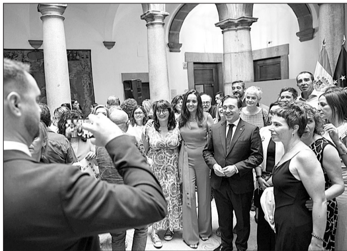
El ministro Albares, durante el homenaje al equipo Start de la Aecid desplegado en Turquía, durante el terremoto.

En los actos de celebración del Día de las Personas Cooperantes el foco ha estado en los propios profesionales de la Cooperación, con especial hincapié en su compromiso solidario y en la explicación de los desafíos a los que se enfrentan en su trabajo cotidiano. La secretaria de Estado de Cooperación Internacional en funciones, Pilar Cancela, ha subrayado que con la nueva ley se aspira a “refor-