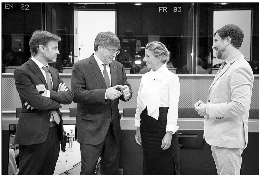
Carles Puigdemont y Yolanda Díaz se reunió el pasado día 4 en Bruselas.

En principio, Sánchez considera importante que Junts desechara la idea de exigir un refe-