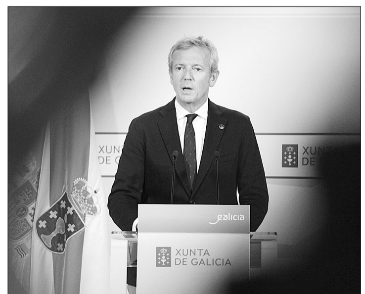
Alfonso Rueda, en la rueda de prensa posterior al Consello de la Xunta donde anunció la puesta en marcha de la oficina móvil.

Desde la puesta en marcha de la Oficina Integral de Asesoramiento e Seguimento ao Retorno se atendieron ya a más de 16.000