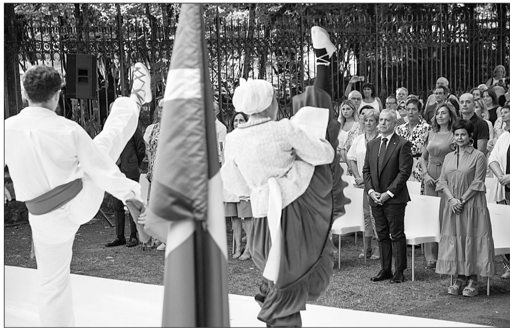
Iñigo Urkullu presidió el acto institucional por el Día Internacional de la Diáspora Vasca.

Finalmente, el lehendakari ha anunciado que todas estas cuestiones serán puestas en común en el próximo Congreso Mundial de Comunidades Vascas en el Exterior que se va a celebrar en Donostia en diciembre, bajo el lema ‘Eraldaroa’.