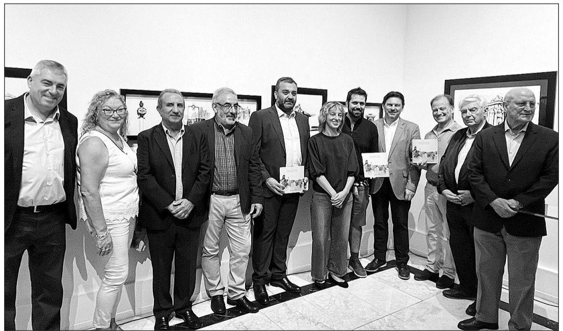
Participantes en la inauguración de la exposición de la figura Antonio Palacios, en Casa de Galicia de Madrid.

realizados por Antonio Palacios en la capital española, se puede visitar en la Casa de Galicia de Madrid entre el 5 y el 29 de septiembre.