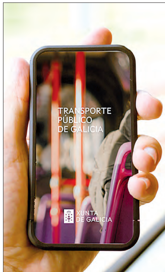
La aplicación de transporte público permite conocer los horarios y el estado de las recargas de las tarjetas.