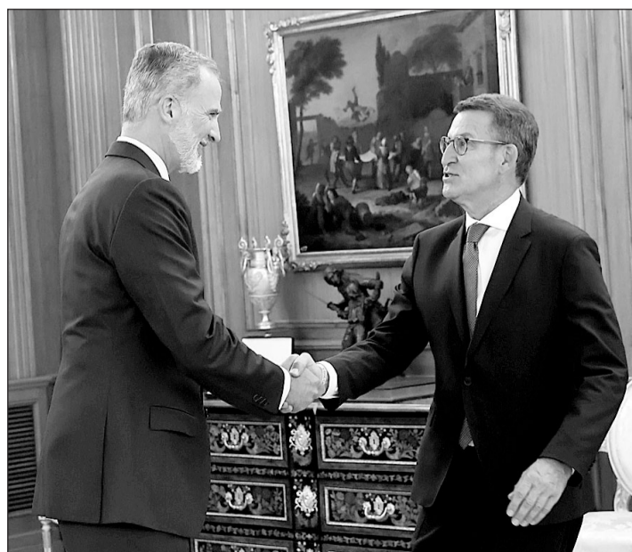
El Rey y Alberto Núñez Feijóo, durante su encuentro en la Casa Real.

“Daremos voz a los más de 11 millones de ciudadanos que quieren cambio, estabilidad y moderación con un Gobierno que defienda la igualdad de todos los españoles”, aseguró Feijóo en un mensaje en su cuenta de Twitter, en el que agradeció al monarca su decisión.