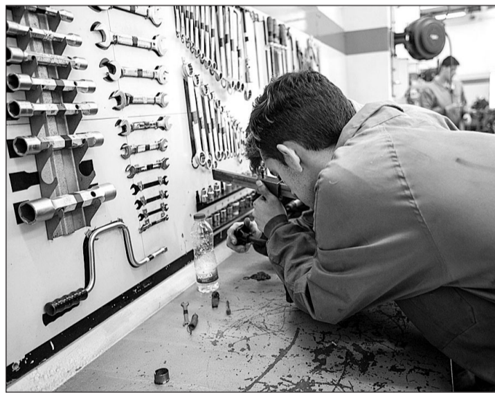
El alumnado se podrá formar en diversas materias.

En total, la Xunta destina a este programa un total de 960.000 euros a lo largo de tres años, de