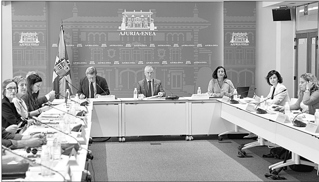
El lehendakari, Iñigo Urkullu, ha presidido la reunión del Patronato de Etxepare Euskal Institutua.

Hay nuevas cátedras de estudios vascos en Gales, Montreal y California