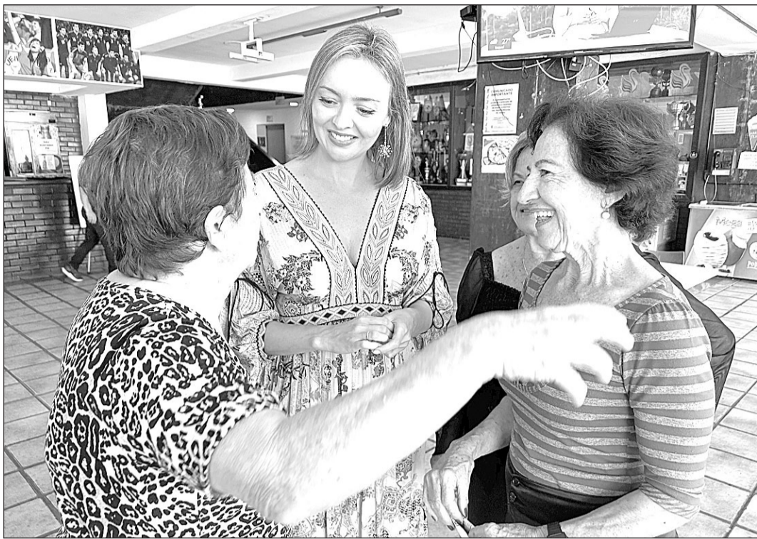
La conselleira de Política Social, Fabiola García, durante su visita a la Casa de España en Río.