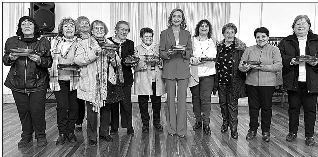
La conselleira, junto a las premiadas con 'A barca de Sálvora', en el Centro Gallego de Avellaneda.

Esta distinción, que brinda un homenaje a las mujeres que lideraron, en 1921, el auxilio a las víctimas del naufragio del buque 'Santa Isabel', es un reconocimiento que el Centro Gallego de esa ciudad brinda cada año, en el Día Internacional de la Mujer, a tres mujeres de la colectividad, en reconocimiento a su labor solidaria, valiente y empática en favor del colectivo residente en el país y de las asociaciones que