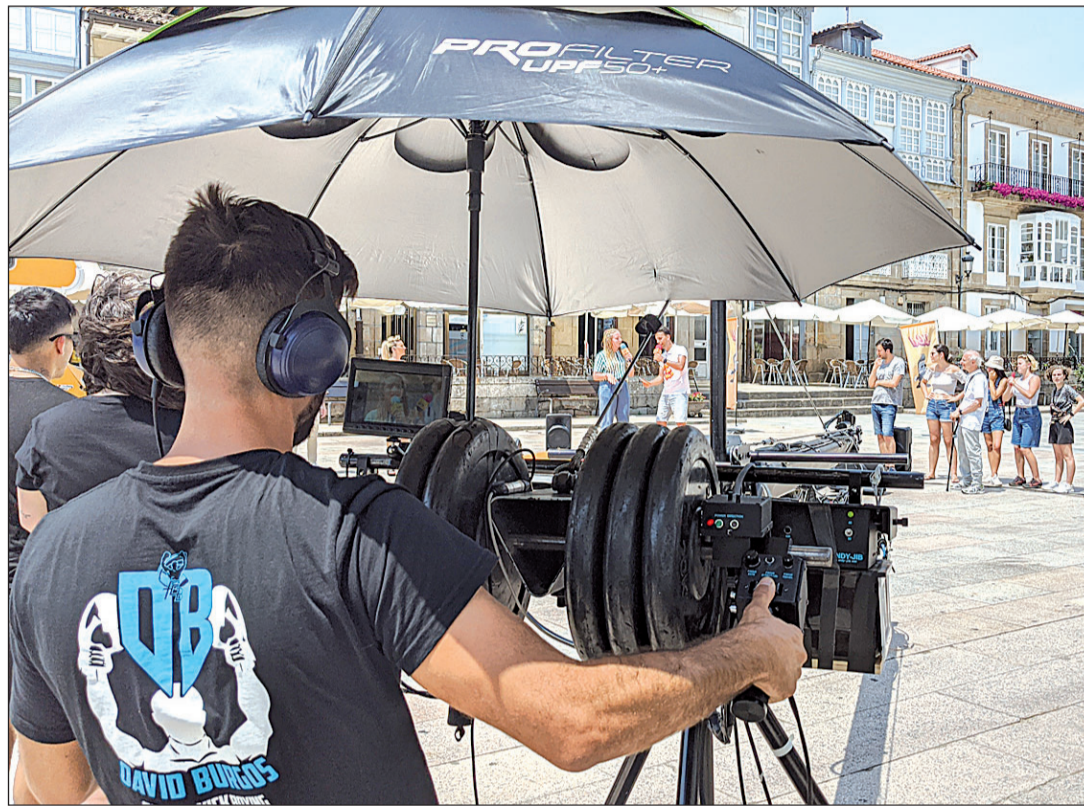
Participantes en el campo Audiovisual, que tiene lugar en Celanova (Ourense), hacen prácticas en la calle.

Además, se recupera un campo de voluntariado específico para jó-