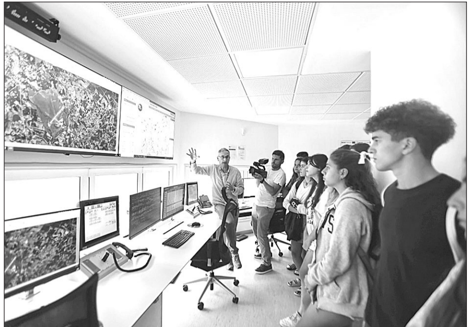
Los jóvenes conocieron las instalaciones y las labores que se realizan en el Polo Aeroespacial.