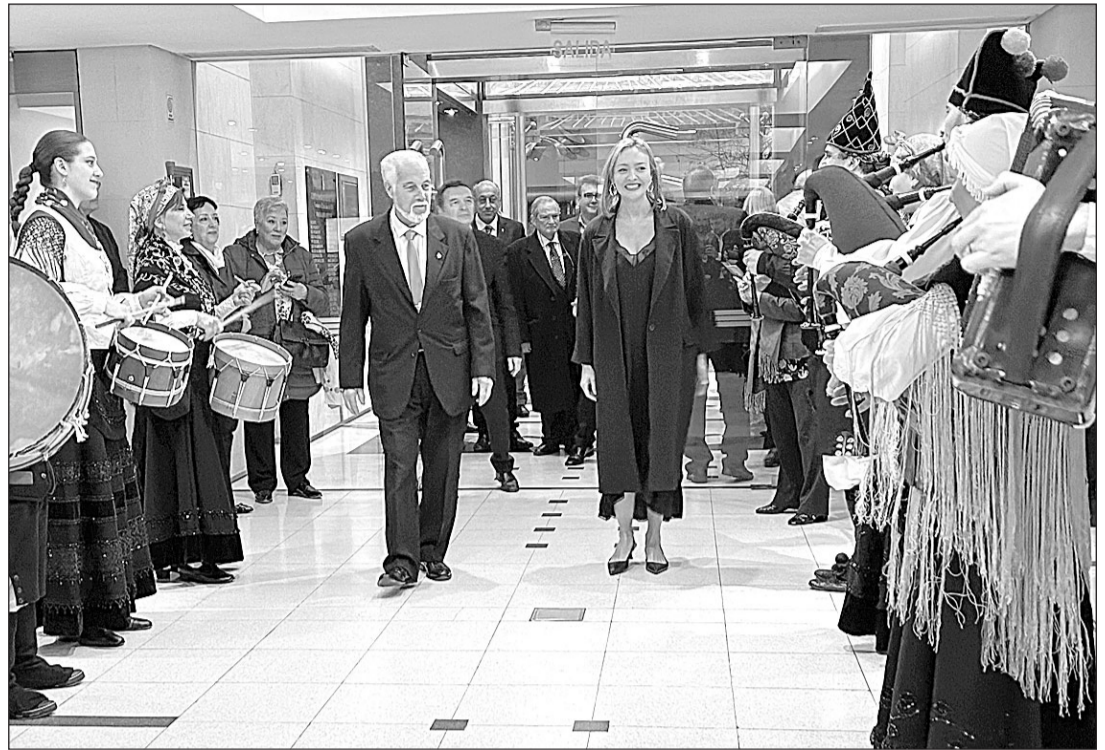
La agrupación folclórica del Centro dio la bienvenida a la conselleira al son de gaitas y tambores.

“El Gobierno gallego –avanzó la conselleira– seguirá estando aquí presente, en cada momento, junto a todos los que emigraron”