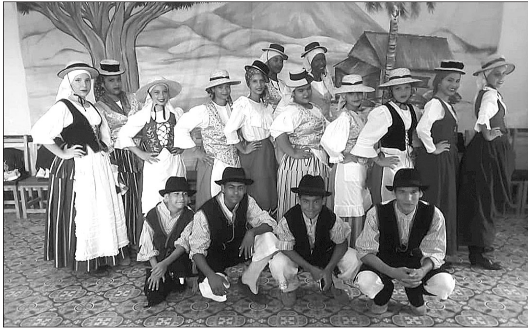
Integrantes del grupo 'Rumores del Teide'.

La Casa Canaria de Santa Clara también ha abierto sus