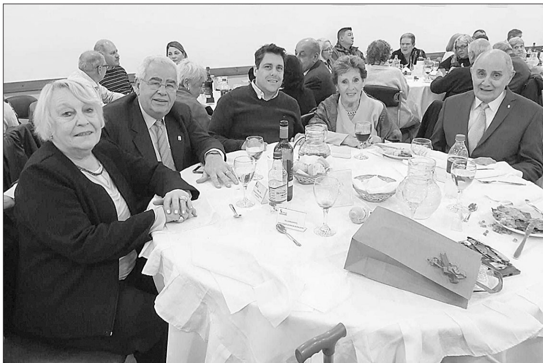
Autoridades en la mesa principal del acto de celebración del 73 aniversario.

Esta institución española es muy reconocida en Mar del Plata y también en toda la Argentina. Es muy buena representante de las tradiciones culturales de Castilla y León a nivel local y nacional.