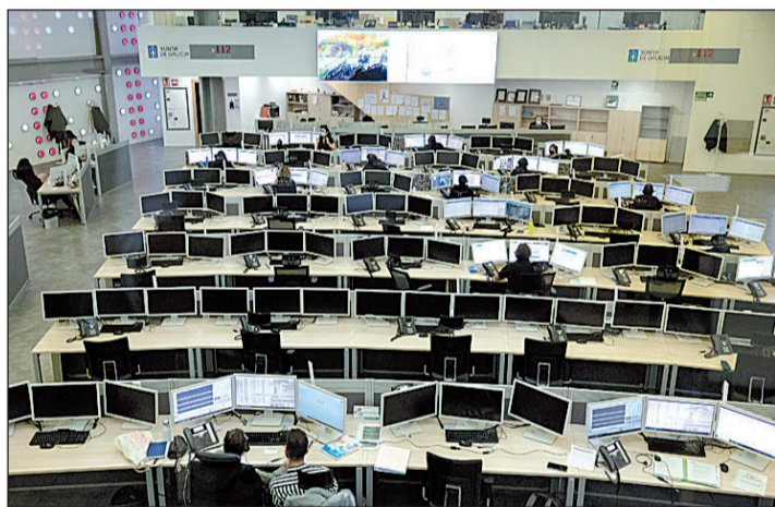
El Centro cuenta con tecnología puntera para atender a las urgencias.