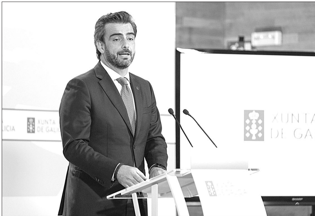
El vicepresidente primero, Diego Calvo, durante la rueda de prensa posterior a la reunión del Consello de la Xunta.

El objetivo "es atraer gallegos del exterior para que se formen en Galicia y se incorporen después a nuestro mercado laboral", indicó Diego Calvo