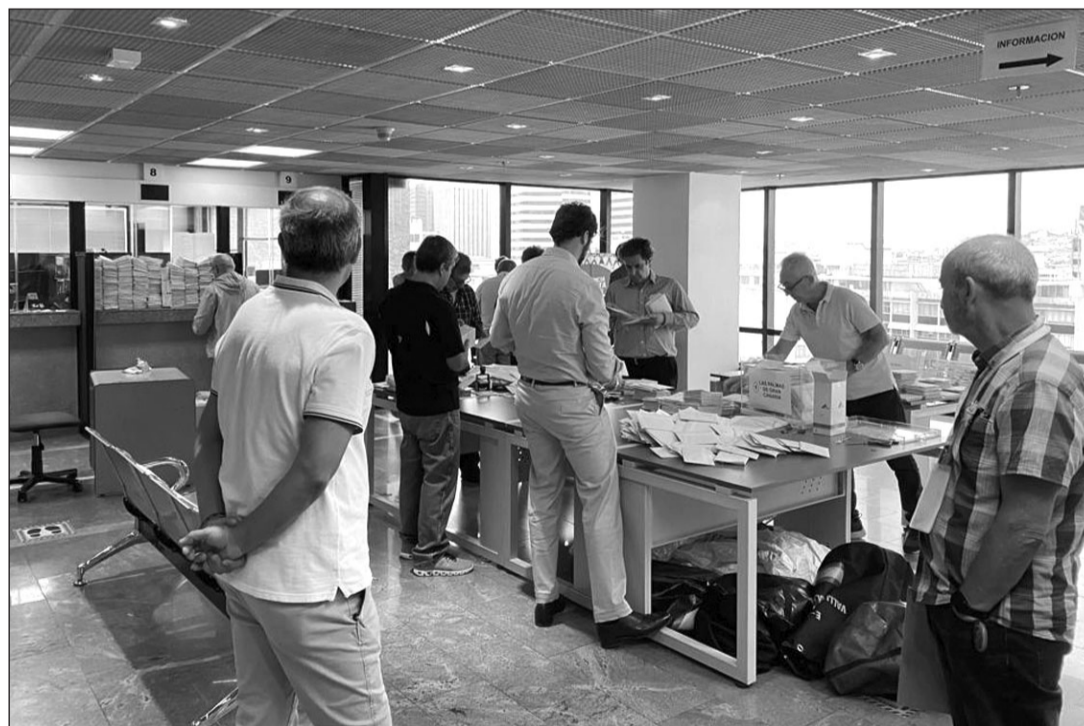
El personal del Consulado en Caracas, en el momento del recuento de los votos.

En Palencia , los residentes del exterior dieron la victoria al PSOE sólo por 7 votos frente al PP (262 de los socialistas por 255 de los populares). Vox recibió 87 votos y Sumar, 85. Hubo 63 votos a otros partidos, 12 nulos y 6 en blanco.