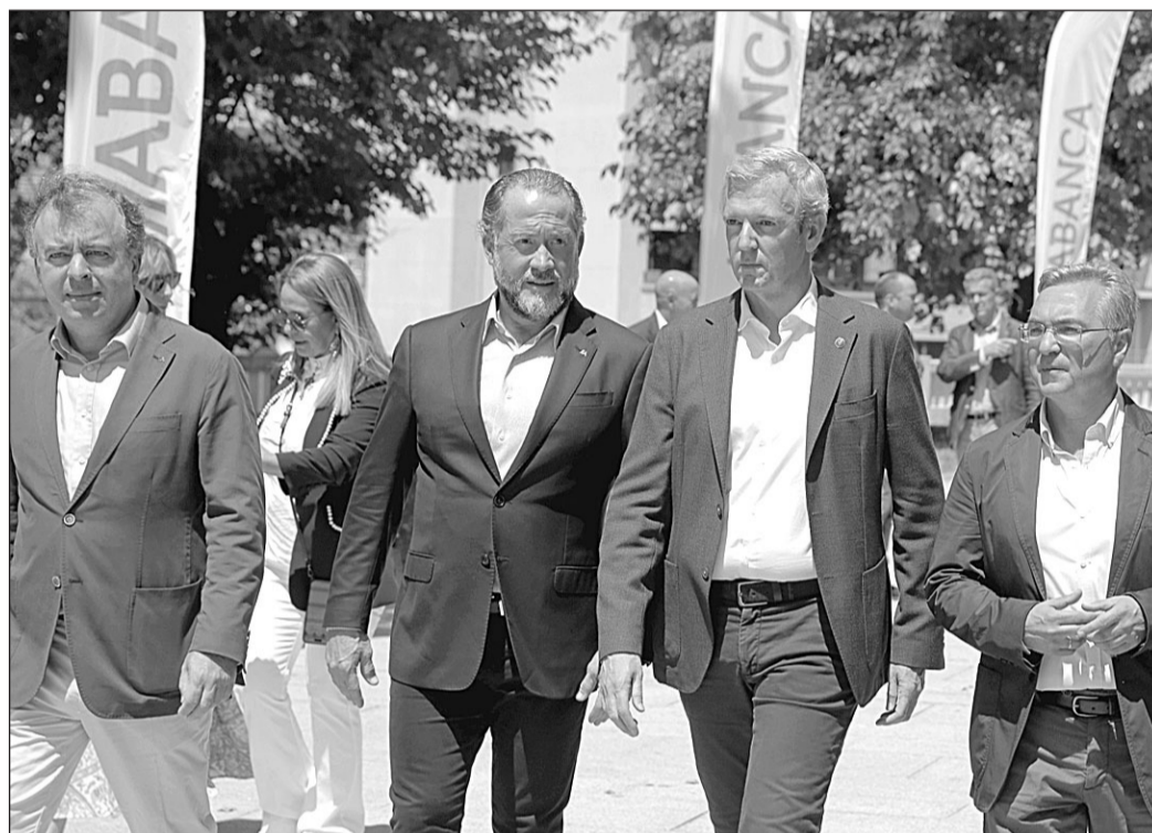
Alfonso Rueda, con dirigentes de Abanca, el pasado sábado, en Ourense.

Las medidas llevadas a cabo por la Xunta en los últimos años tienen como resultado la estabilidad económica de Galicia que se muestra con hechos como