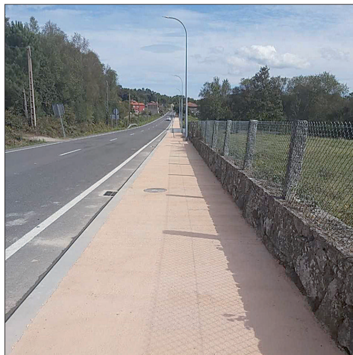
Hay más de 250 kilómetros de sendas ejecutados en los últimos seis años en los márgenes de las carreteras autonómicas.

firmes, garantizando su conservación y reforzando la seguridad viaria y la comodidad en los desplazamientos de los usuarios, ascendió en seis años a 115 millones de euros.