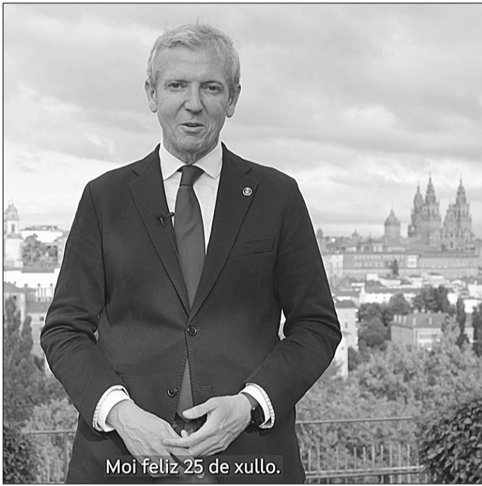
Alfonso Rueda, durante el mensaje dirigido a los gallegos de la diáspora.

Asimismo, hizo referencia al encuentro con buena parte de los que residen fuera durante los viajes que en este año como presidente de la Xunta protagonizó al exterior, por lo que les recordó la idea que ya les transmitió entonces de que “Galicia