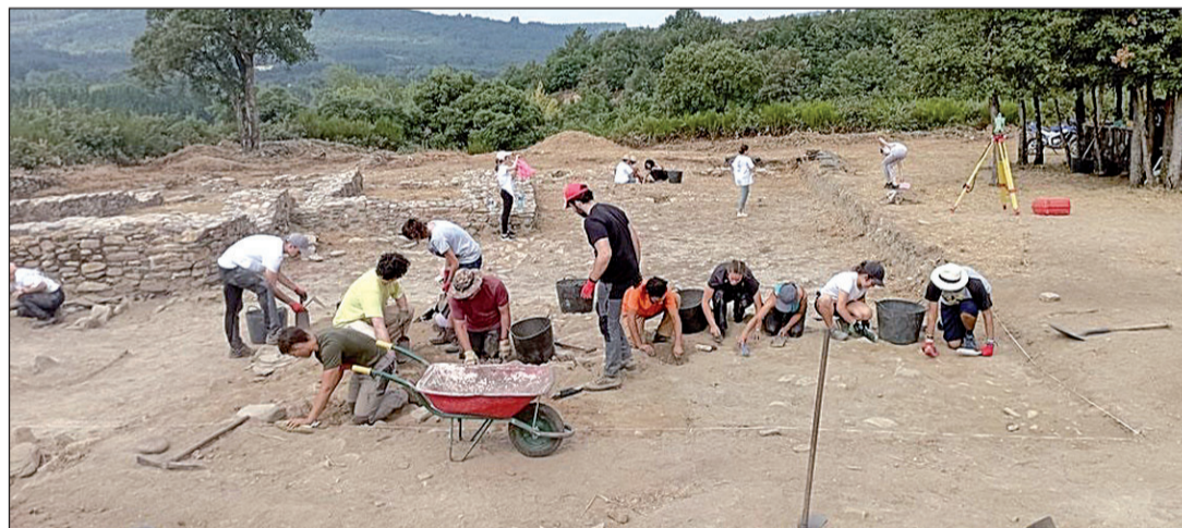
Beneficiarios de los campos, en el Castro romería San Lorenzo, en Pobra de Brollón, Lugo.

venes gallegos que residen en el exterior en Castro de Rei (Lugo).