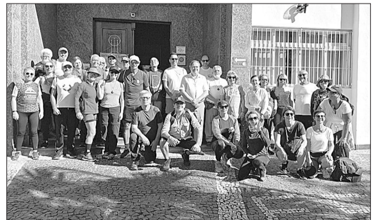
Miembros de la comunidad española que participaron en el acto.

esa fecha, todos los 25 de julio, con motivo del ‘Día da Patria’, se rinde homenaje a la escritora gallega más universal.