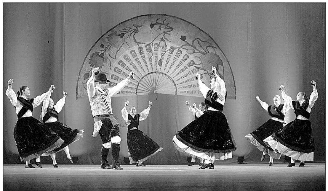
'Aires Galegos', en un momento de su actuación en el festival que se organiza en el estado federativo.

Como novedad en el grupo, este año estrenaron las cantareiras y pandereteiras, divulgando la música tradicional gallega.