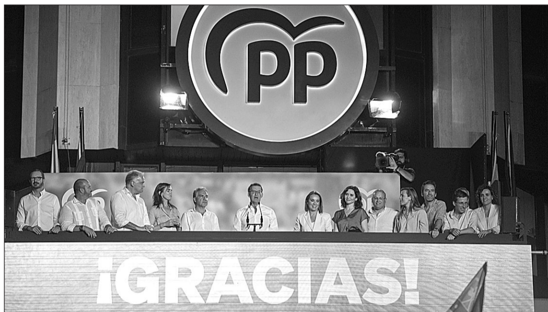
Alberto Núñez Feijóo, acompañado por otros líderes del PP, saludan a sus simpatizantes desde el balcón de la sede del partido en la noche electoral.

Los más de 300.000 votos que el PP sacó al PSOE en la noche electoral suponen poco más de un punto porcentual entre uno y otro partido, lo que deja el escenario abierto en el supuesto de que haya repetición electoral. Núñez Feijóo se mostró dispuesto a poner todo de su parte para evitar esa circunstancia y pidió al PSOE y al resto de fuerzas que “no bloqueen el gobierno de España una vez más”, en alusión a lo que ocurrió con la etapa de Rajoy. Feijóo reivindicó el resultado obtenido y su legitimidad para ser elegido presidente por ser el líder de la fuerza más votada, alegando en su favor que “ningún otro candidato ha gobernado después de perder las elecciones”. Por ese motivo, se comprometió a abanderar el proceso de negociaciones “de acuerdo con la voluntad de los español-