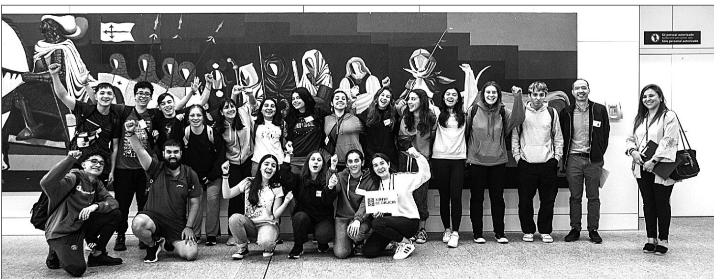
Los participantes en este segundo turno posan con los responsables de Emigración.

para acercarse al mundo de la innovación y la realidad empresarial gallega.