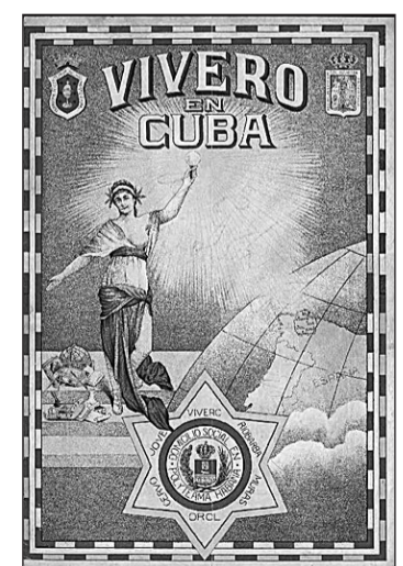
Una portada de la revista.

de las diferentes cabeceras se pueden consultar directamente en las instalaciones del AEG, cada mes se digitalizan nuevos ejemplares que se ponen a disposición de los usuarios para que puedan ser consultados en línea en la web institucional del Consello da Cultura Galega.