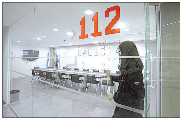
Las instalaciones destacan por su versatilidad, con vistas al futuro.