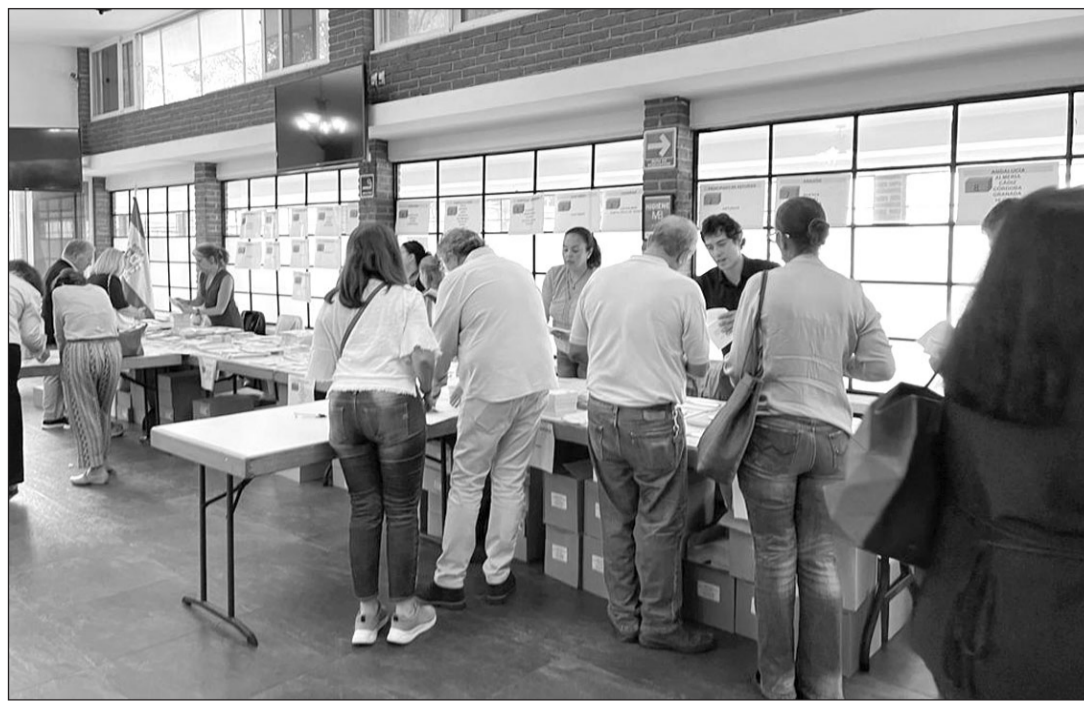
Españoles votando en el Consulado General de España en Ciudad de México. GM

El PSOE ha sido la primera fuerza en Navarra en el escrutinio del voto CERA. En concreto, los socialistas han recibido 671 votos, seguidos del Partido Popular, con 641 votos, y UPN, con 410. El escrutinio da 330 votos a Sumar; 261 votos, a Bildu; 234, a Vox; 102, a Geroa Bai; 39, al Pacma; 28, a Por un mundo más justo; 9, a Frente Obrero; y 7, al Partido Comunista