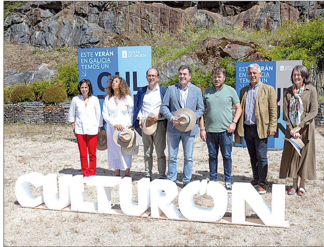
Los responsables de Cultura de la Xunta, durante la presentación de la campaña 'CulturON'.

La programación incluye 60 exposiciones, más de 400 conciertos, festivales y cine, 300 funciones de teatro y un millar de actividades en bibliotecas