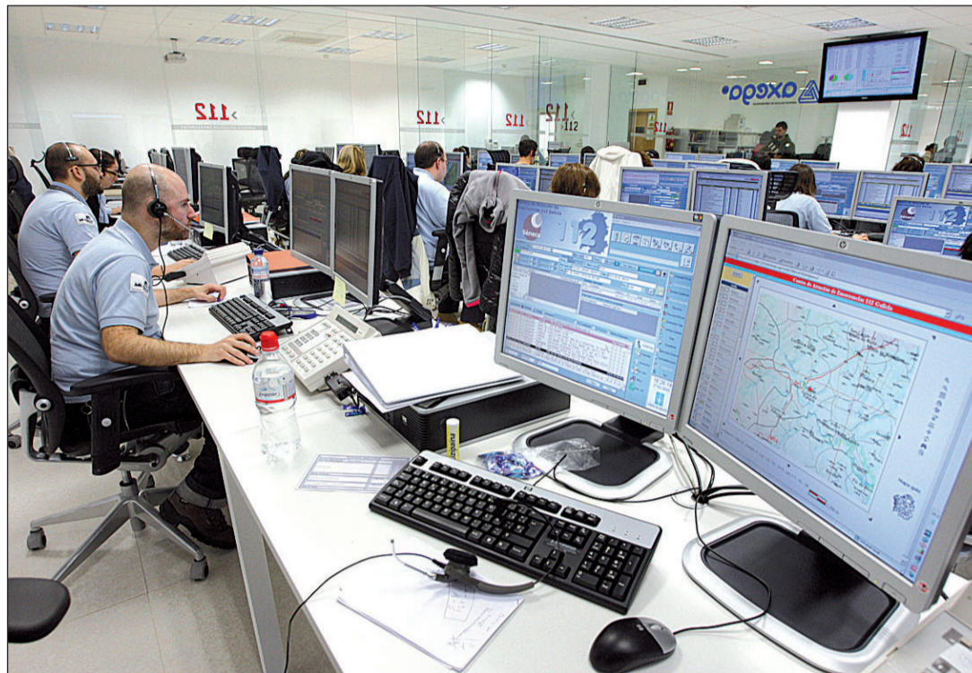
Empleados trabajando en la Sala de Operaciones del Centro Integrado de Atención a las Emergencias.

El nuevo enclave de A Estrada, en activo desde el año 2017, cuenta con un espacio diez veces mayor que el disponible hasta esa fecha y está dotado con la más puntera tecnología para gestionar la seguridad pública. Su ubicación, diseño y