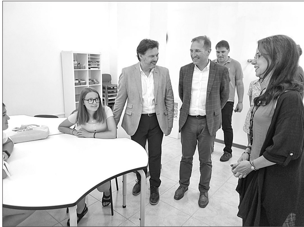
El secretario xeral de Emigración y el alcalde de As Neves, durante la visita a la academia.

tiene como finalidad favorecer el retorno a la comunidad autónoma de los gallegos residentes en el exterior de forma que puedan fijar su residencia e integrarse social y laboralmente en la sociedad, realizando en ella sus actividades empresariales y profesionales, favore-