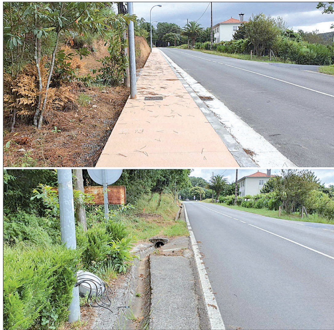
Una de las sendas mejoradas por la Xunta para priorizar la seguridad de los peatones y los ciclistas.