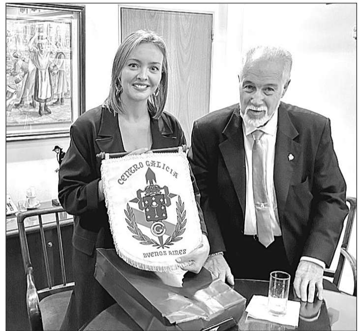
La conselleira muestra el escudo del Centro, junto al presidente.

En Brasil, la conselleira visitó varios centros de día y asociaciones de atención a mayores como la Sociedad Beneficente Rosalía de Castro o la Peña Galega de la Casa de España. La conselleira concluyó su viaje, este lunes 31, en Uruguay, donde tenía previsto visitar la residencia Hogar Español de Ancianos de Montevideo; entidad con la que la Xunta colabora con el objetivo contribuir a mejorar la calidad de la atención.