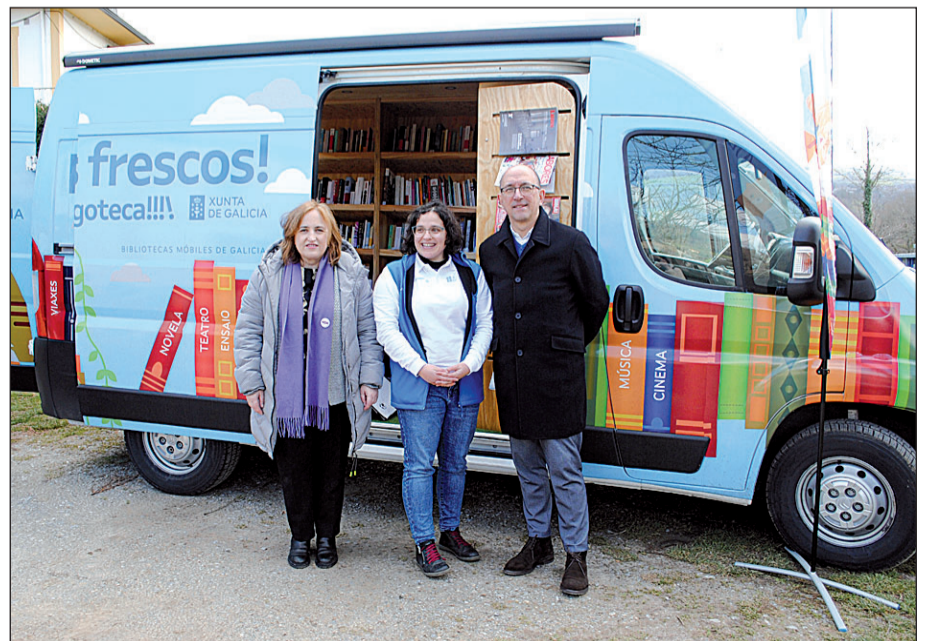
'A Furgoteca', el servicio de biblioteca móvil, que lleva la cultura por toda Galicia.