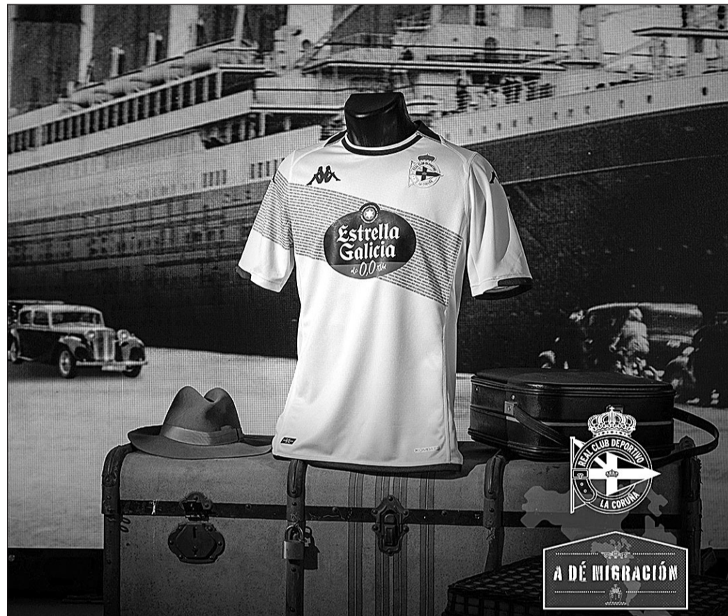
Diseño exclusivo que el Deportivo de La Coruña lucirá en su segunda camiseta. GM

Estos tres países, explica el club coruñés, contaban con amplísimas colonias y asociaciones gallegas -diversos estudios estiman que alrededor de un millón de gallegos 'cruzaron el charco' entre 1885 y 1930- que recibie-