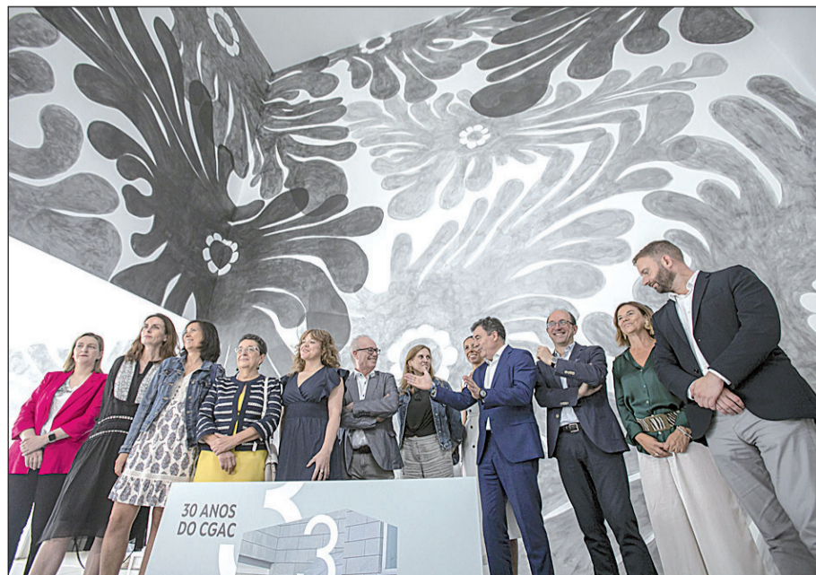
Presentación en la Cidade da Cultura de la exposición de los 30 años del CGAC.

agosto en A Coruña, Viveiro, Foz y Monforte de Lemos. Por último, en lo que se refiere a patrimonio, se celebrarán distintas visitas divulgativas a las últimas intervenciones realizadas en lugares emblemáticos.