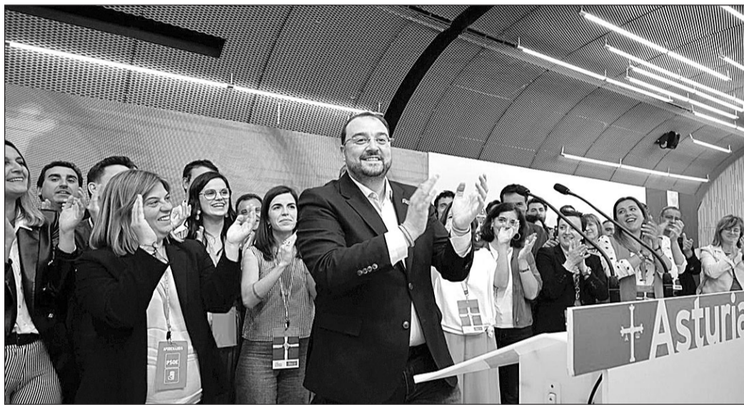
Adrián Barbón celebra los resultados en la noche electoral.

Los populares necesitaban 890 votos más que los socialistas del CERA en la circunscripción oriental para ganar un escaño y empatar a 18 con el PSOE, sin embargo, los resultados les otorgan 539, 108 más que los que ob-