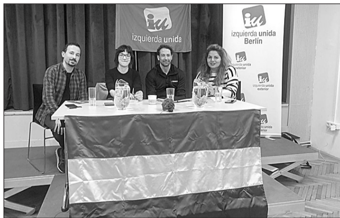
Un momento de la reunión de la Comisión Coordinadora.

El nuevo coordinador y portavoz expresó como principal reto "construir una alternativa al capitalismo desde la emigración, con la defensa de los derechos de la ciudadanía en el exterior y el apoyo a la lucha de la clase trabajadora emigrada como principales ejes". En este sentido, añadió su voluntad de continuar trabajando en mejorar la representación del exterior en la política española, así como ampliar las reivindicaciones de la Federación, para incluir asuntos importantes como la educación ofrecida a las familias en el exterior. Del mismo modo, se intensificará el apoyo a la lucha del Personal