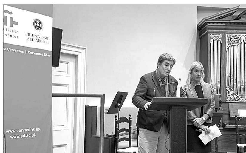
Luis García Montero, durante su intervención en la inauguración de la Cátedra Cervantes en la Universidad de Edimburgo.

La Universidad de Edimburgo, fundada en 1583, es una de las más grandes y prestigiosas de Reino Unido. La enseñanza del español en Escocia en los últimos años ha tenido un crecimiento sostenido, un hecho que puso de relieve el informe 'Language Trends', del British Council, que mostraba el afianzamiento del idioma español como la lengua extranjera más de-