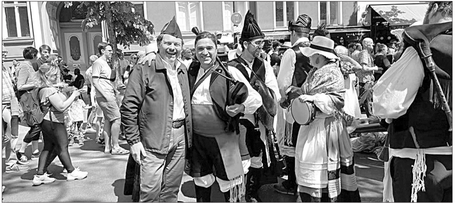
El secretario xeral de Emigración participó de la jornada festiva en Berlín.

Este desfile tiene como objetivo dar a conocer entre los habitantes de la cosmopolita capital alemana las diferentes culturas de las que proceden muchos de sus residentes. Aprovechando este acto, el secretario xeral mantuvo una jornada de convivencia y encuentro con los gallegos de esta asociación, una de las más nuevas, pero muy dinámica, de Europa, y les agradeció el esfuerzo que están realizando por potenciar la cultura gallega en Berlín y en su entorno.