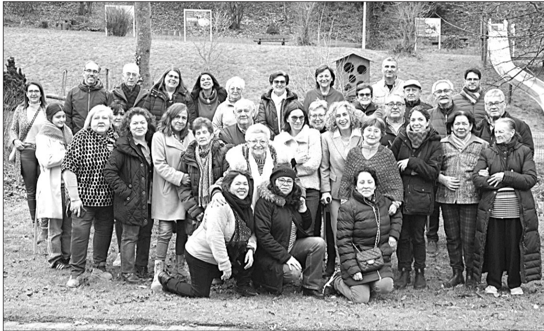
Foto de familia de algunos participantes presenciales en el seminario de marzo de 2023.

Riesgo destaca que “para participar en Adentro lo que vale es la voluntad de querer tomar parte, aprender y multiplicar lo aprendido”, y que “no hay ningún límite de edad, ni hay que tener estudios especiales”.