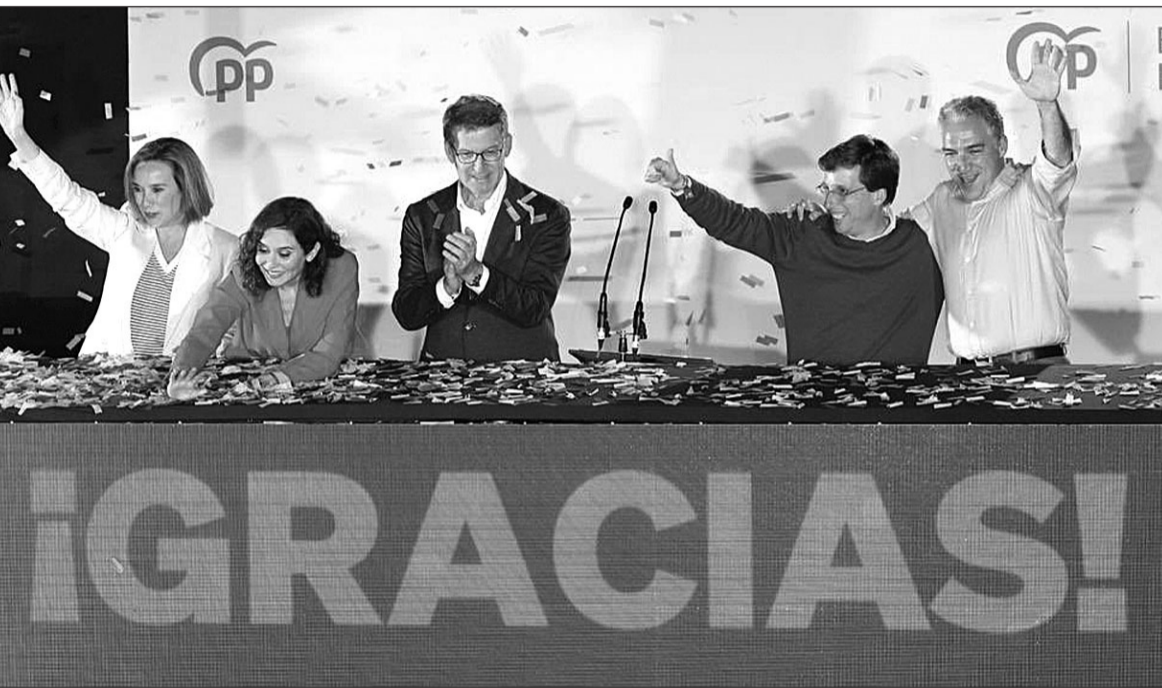
Los dirigentes del PP celebran los buenos resultados en el balcón de la sede de Génova.

En Castilla-La Mancha, con su carismático presidente, Emiliano García Page, al frente, el PSOE bajó de 19 a 17 escaños, los justos para mantener la mayoría absoluta, aunque el sobresalto fue mayúsculo en un momento del escrutinio en que se quedó con 16 y todo parecía indicar que ese gobierno quedaba también en manos de un pacto PP-Vox. En Valencia, el PSOE sumó cuatro más que en la cita electoral de 2019 (de 27 pasó a