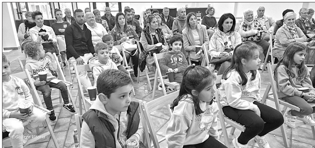
Público asistente a la proyección de 'Valentina' en el Centro Gallego de Álava.