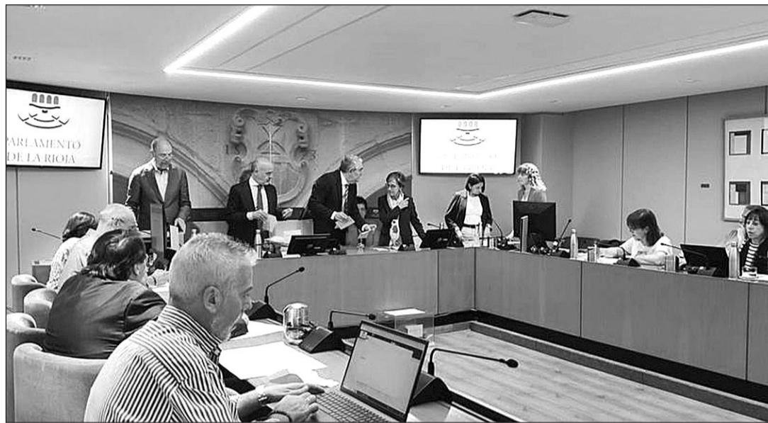
Recuento del voto exterior en el Parlamento de La Rioja.

Hasta las Islas han llegado un total de 2.286 sufragios de baleares que residen fuera de España de un censo de 32.644 personas, lo que supone un 7%. El voto del Censo