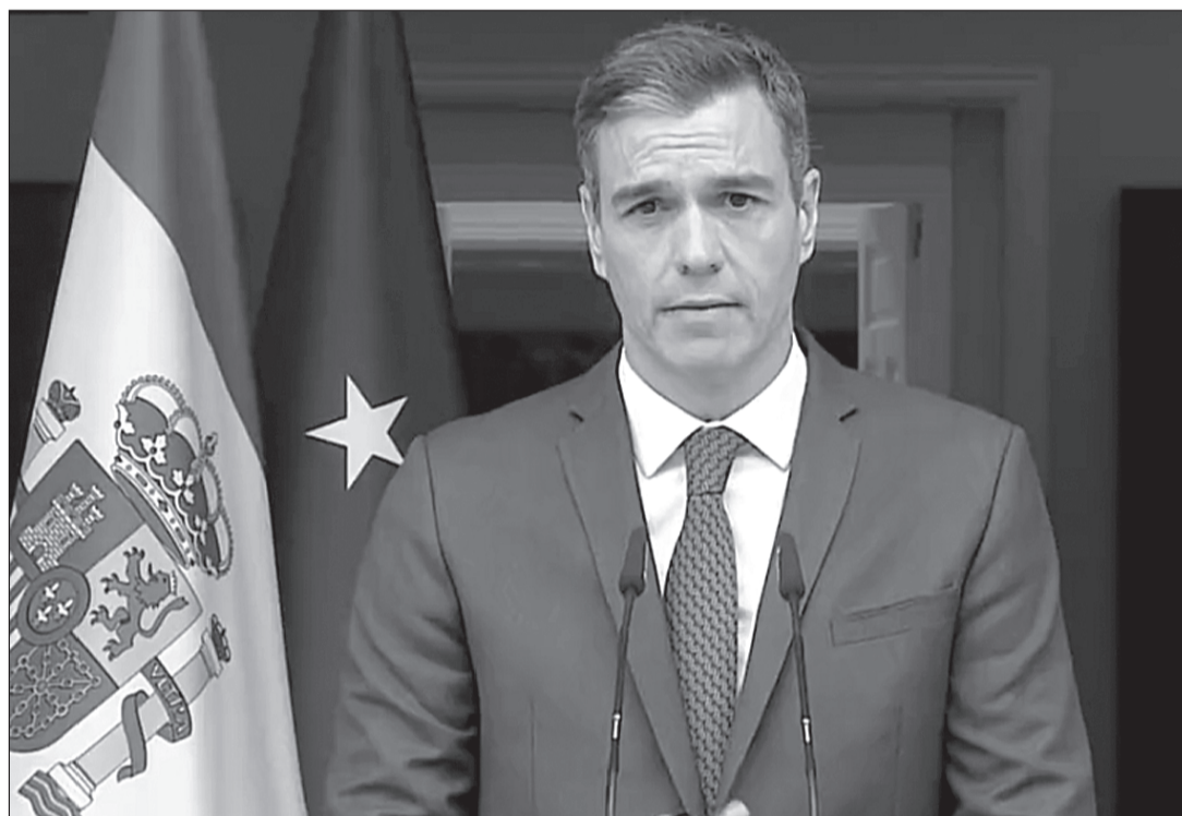
Pedro Sánchez, durante el anuncio del adelanto de las elecciones generales.

Las últimas elecciones generales se celebraron en España el 10 de noviembre de 2019. El PSOE fue entonces la formación ganadora en porcentaje de los votos (28% y 120 escaños).