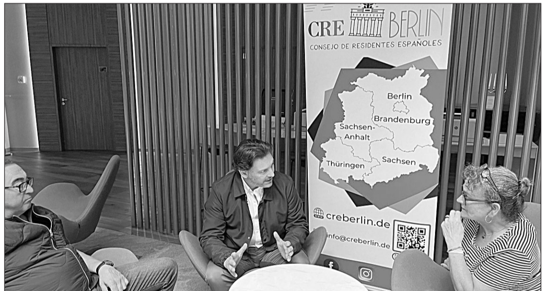
El secretario xeral de Emigración, reunido con los miembros del CRE de Berlín.