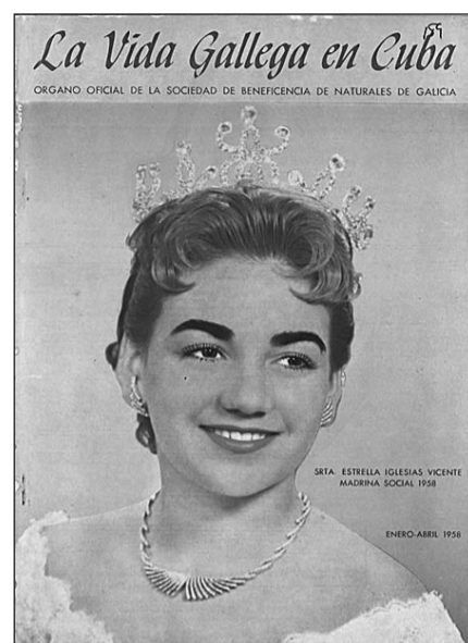
Portada de la revista 'La Vida Gallega en Cuba'.

El asentamiento en otros países como Canadá o México favoreció la creación de centros de la colectividad gallega en Montreal o Toronto, donde también se pusieron en marcha varias revistas, entre las que sobresalen la 'Revista Deportiva. Centro Gallego' de Montreal, por su temática especializada en deportes o la que