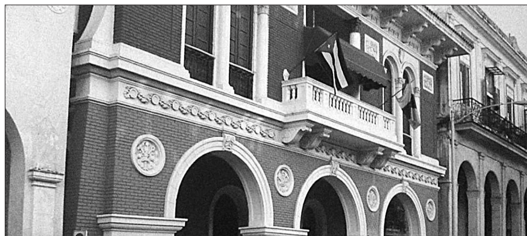
Fachada de la casa canaria Leonor Pérez Cabrera, en La Habana Vieja.

ra, reconocida por su invaluable labor en la promoción y difusión de la cultura canaria en Cuba, ha sido punto de encuentro para los canarios residentes en la isla y un espacio de conexión con sus raíces y tradiciones.