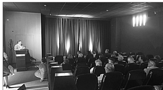
Miranda se dirige a los asistentes antes de la proyección de la película.