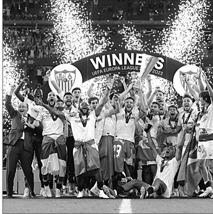
Los jugadores del Sevilla celebran el título conquistado.

El Sevilla ha mudado la piel desde la llegada del entrenador de Zaldívar solucionando primero sus problemas domésticos. Llegó a la última jornada con la posibilidad de quedar séptimo, posición que conlleva disputar la Conference League