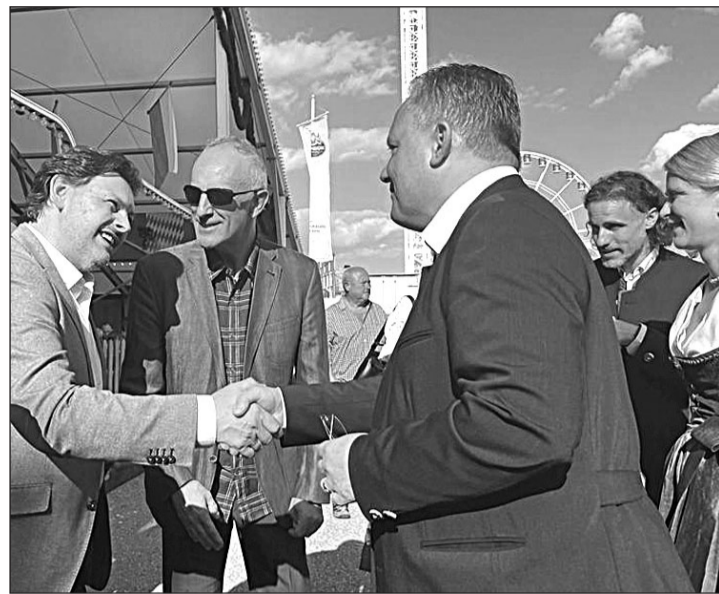
El secretario xeral de Emigración saluda al alcalde de Ingolstadt.

Junto al cónsul en Múnich visitó el Audi Museum Mobile acompañando al Centro Español de Ingolstadt