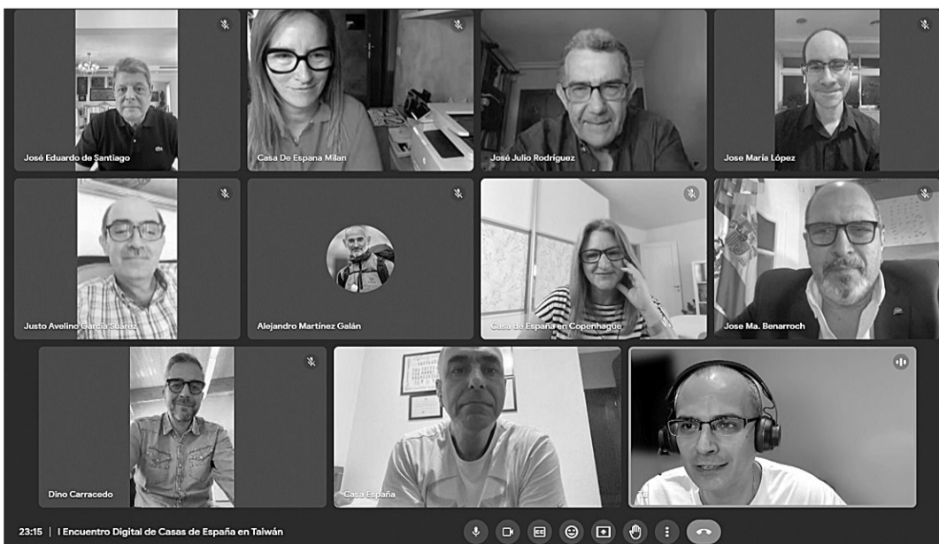
Algunos de los participantes en este primer encuentro de Casas de España.

A continuación, tuvo lugar un foro abierto con la participación de los asistentes en el que se compartieron diferentes experiencias, buenas prácticas y propuestas. Asimismo, se plantearon algunas