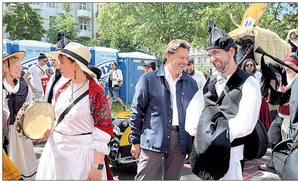
Miranda acompañó a la asociación gallega 'De Berlín Son' en el Carnaval de las Culturas.

22 Aprueban las ayudas para situaciones de extrema necesidad en las colectividades vascas del exterior