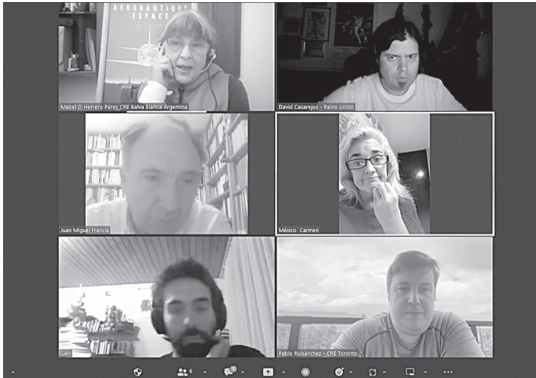
Participantes en el encuentro de parte de la Comisión de Derechos Civiles y Participación.

“Cuando en el pasado Pleno del CGCEE oímos las penurias del Personal Laboral en el Exterior a través de los testimonios de