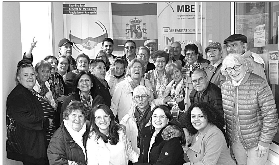
Participantes en el taller para la tercera edad.

Después de una breve pausa de unos 15 minutos, el notario Dominik Gassen dio una conferencia sobre los datos más importantes a saber sobre el derecho testamentario alemán y presentó las diferencias más importantes entre la normativa alemana y la española. Naturalmente, en todo momento tuvieron los participantes la oportunidad de hacer preguntas sobre los detalles más complicados. Para mayor seguridad, dado que la pre-