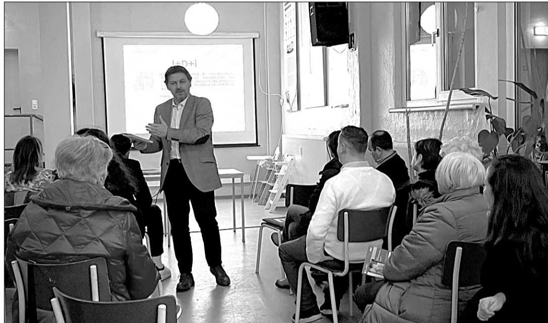
El secretario xeral de Emigración, durante la presentación de la Estratexia Retorna en Fráncfort.