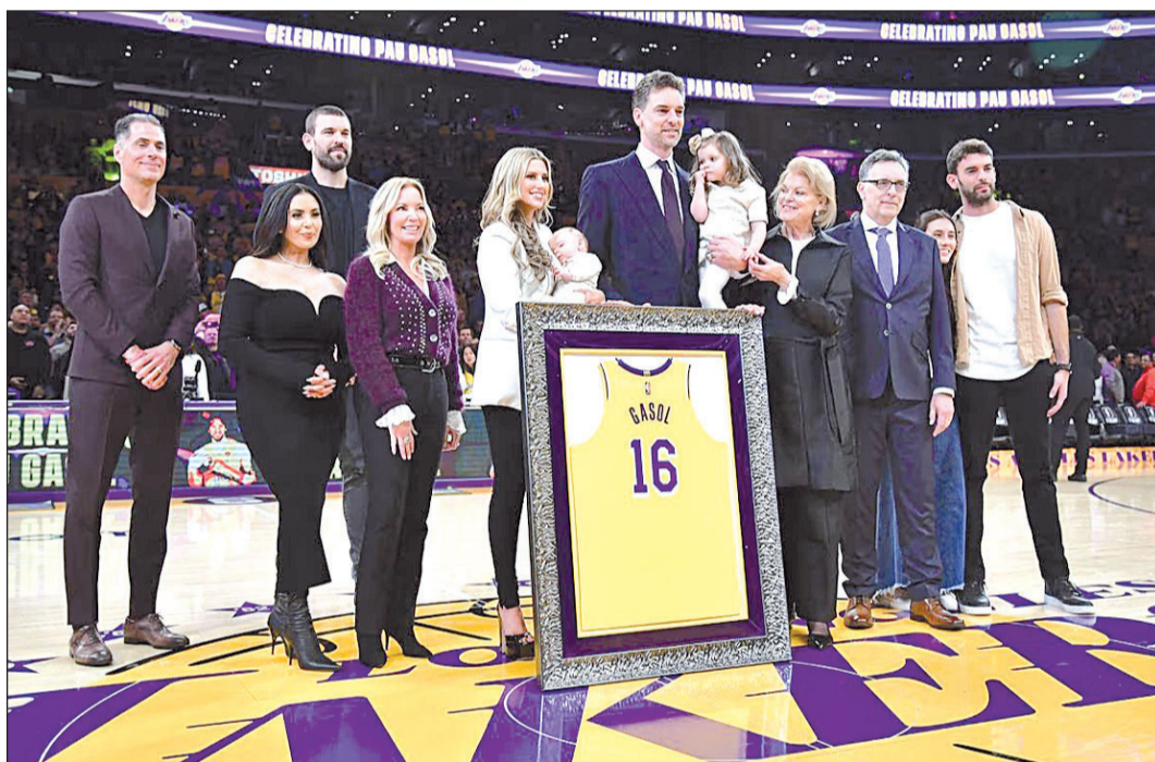
Pau Gasol, rodeado de su familia, la viuda de Kobe Bryant y dirigentes de los Lakers, durante el homenaje.

Arropado por su familia y con su hija en brazos, el seis veces All-Star, que fue aclamado por última vez por los aficionados del club, vivió el momento más emotivo de la jornada al ser descubierta la camiseta en lo más alto del estadio. “Abrumado”, como dijo sentirse, dio las gracias a todos los presentes y se emocionó al recordar a su ídolo y amigo Kobe –fallecido en accidente de helicóptero en 2020–, al que hizo mención en ese día tan especial para él.