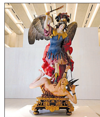
‘La Roldana’, obra de Luisa Roldán.

El histórico de Gasol recorre un camino que empezó en la Escuela deportiva Llor de San Boi de Llobregat (Barcelona) y continuó en el F.C. Barcelona, donde se le abrieron las puertas para dar al salto a grandes de la NBA como los Memphis Grizzlies, los Lakers o los Chicago Bulls.