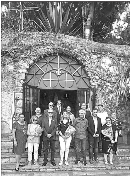
La consejera de Presidencia y su séquito, junto a los directivos del CAC y de la Fundación CAC en la réplica de la cueva de la Santina.