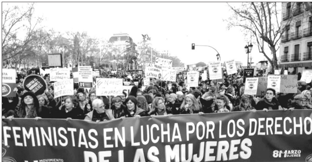
Asistentes a la manifestación organizada por el Movimiento Feminista de Madrid con motivo del Día de la Mujer.

En Madrid, Valencia, Sevilla o Valladolid, muchas mujeres se han visto obligadas a elegir entre manifestaciones dependiendo de su opinión respecto a la ley trans