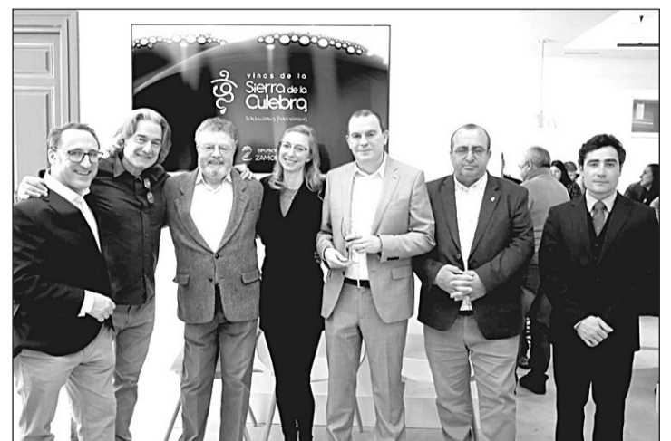
El presidente de la Diputación de Zamora, junto a otros asistentes al acto.

Como cierre del acto de presentación, se ha celebrado una cata de vinos, con el Tinto Bruñal de la Bodega la Mela, el Tinto de Mencía Caminos de Aliste, el Tempranillo de Marina de Aliste, el Tinto Mencía de Vino de Santos y el Blanco de Palomino de Cepas de la Culebra, con el mari-