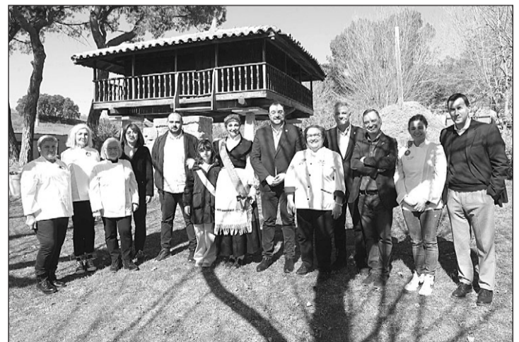
Adrián Barbón, junto a guisanderas y presidentes de centros en Madrid.

El Club de Guisanderas, constituido en 1997, se encarga de mantener viva la memoria gastronómica de Asturias e impulsar una importante divulgación culinaria. El grupo, actualmente integrado por 37 cocineras, recibió en 2021 la Medalla de Plata de Asturias.