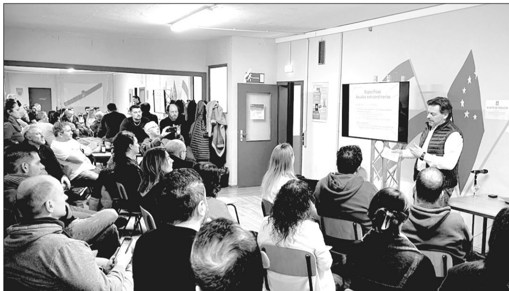
Miranda explica las características de la nueva Estratexia a gallegos que asistieron al encuentro en Bonn.

Miranda finalizó en Bonn la presentación en ese país de la Estratexia Retorna