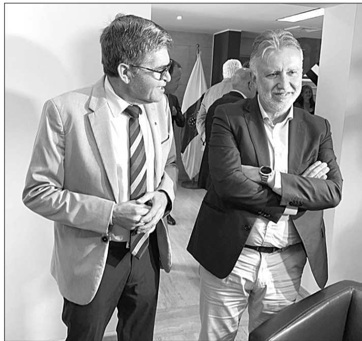
José Montesdeoca y Ángel Víctor Torres, durante la visita del presidente canario a Venezuela.

el Gobierno de Canarias” y los listados de admitidos, la lista de espera y los excluidos se publica en el Boletín Oficial de Canarias (BOC), “de forma clara y transparente para que no haya ningún tipo de duda ni suspicacia”. Respecto a las ayudas a las entidades canarias radicadas en Venezuela “también se va a hacer un esfuerzo económico para incrementarlas”.