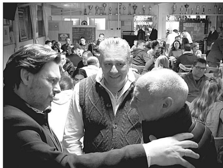
El secretario xeral conversa con algunos participantes en el evento.

de medidas y más de 450 millones de euros de presupuesto para seguir haciendo de Galicia la mejor opción para vivir para los gallegos residentes en el exterior.