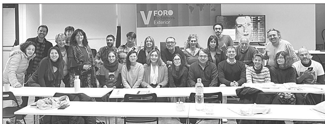
Foto de familia de los participantes presenciales del V Foro de Podemos Exterior.

En el Foro se habló sobre el trabajo realizado por Podemos Exterior para la ampliación del acceso a la nacionalidad