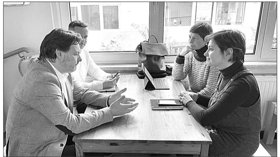
El secretario xeral de Emigración, reunido con los miembros del CRE de Fráncfort.

la colectividad gallega la nueva Estrategia Retorna 2026 (ERG2026), recordándole que tiene como principal novedad ampliar el apoyo y asesoramiento laboral a las familias retornadas gallegas. El nuevo documento se basa en la experiencia de la primera Estrategia Retorna, que ahora se verá duplicada tanto en el presupuesto inicial como en las medidas a aplicar por el conjunto de todos los departamentos gallegos, que rondará las 100 iniciativas, y que incidirá en cuatro áreas: la laboral, la social, la educativa y la del asesoramiento e información.