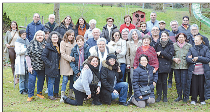
Participantes presenciales en el primer seminario de este año de ¡Adentro!. GM