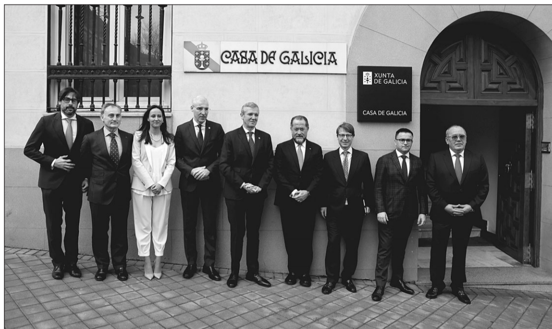
Alfonso Rueda y el vicepresidente Francisco Conde, junto con otros asistentes a la presentación.

estos proyectos transformadores corren riesgo de no llegar a buen puerto si el Gobierno central no agiliza las ayudas europeas que necesitan haciendo ya un reparto justo, proporcionado y transparente de los fondos Next Generation.