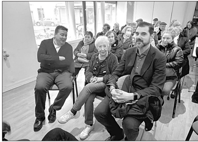
Participantes en el homenaje a la emigración celebrado en París.

Tras recordar que Francia es el segundo país, tras Argentina, con más españoles, ya que cuenta con 300.000 inscritos, a los que habría que sumar los que no