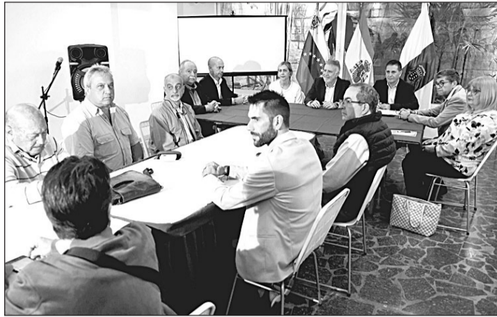
El presidente canario, Ángel Víctor Torres, durante una reunión con centros en su reciente visita a Venezuela.

Junto con esas actuaciones, el programa de medicamentos duplica su partida inicial, al incrementarse desde los 300.000 hasta los 600.000 euros que hubo en la convocatoria inicial de 2022. A estos aumentos, que permitirán elevar el número de beneficiarios, se añade el hecho de que sube la cuantía de