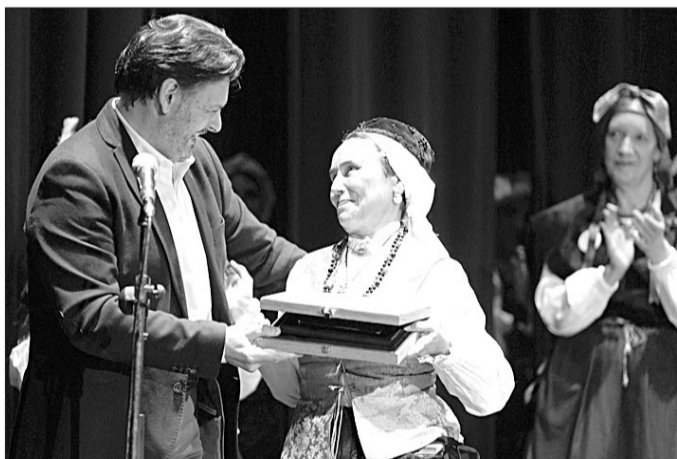
El secretario xeral de Emigración entrega un recuerdo a la presidenta de la Agrupación.