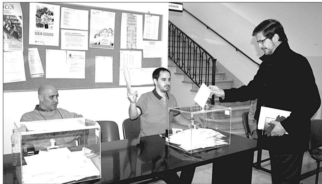
Una persona vota en el Consulado de Buenos Aires, en pasadas elecciones.

Desde mayo de 2019, Madrid fue la comunidad autónoma que experimentó mayor incremento en las cifras del CERA, 63.107. La cantidad está muy por encima del resto de regiones, entre las que destaca la subida de Canarias, con 14.150 personas más en el censo. Asturias sube casi cinco mil (4.977), seguido de Baleares y