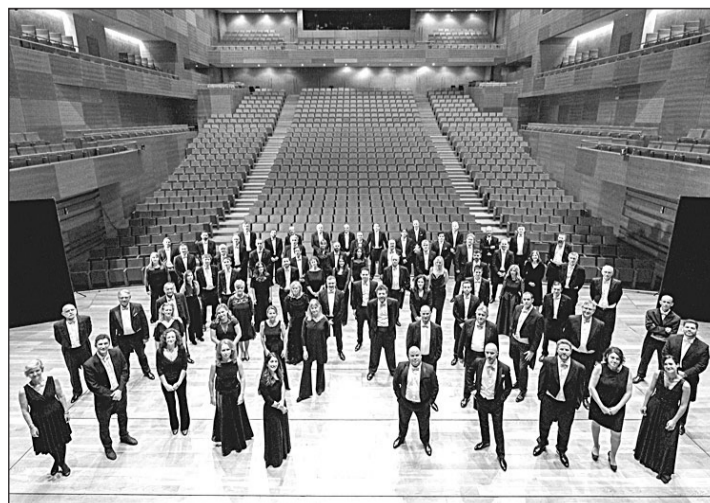
Componentes de la Orquesta Sinfónica de Castilla y León.

ma estará formado por el ‘Bolero’, de Ravel, una de las obras más famosas del compositor francés, considerada una de los exponentes de la música del siglo XX; para continuar con una Suite extraída de la música de la ópera ‘Carmen’, de Georges Bizet, de 1875 y compilada póstumamente por su amigo Ernest Guiraud, con una posterior selección de Thierry Fischer. El concierto finalizará con ‘El sombrero de tres picos. Suite nº 2’, de la segunda parte del ballet del compositor español Manuel de Falla, dedicada a la noche y que consta de tres danzas.