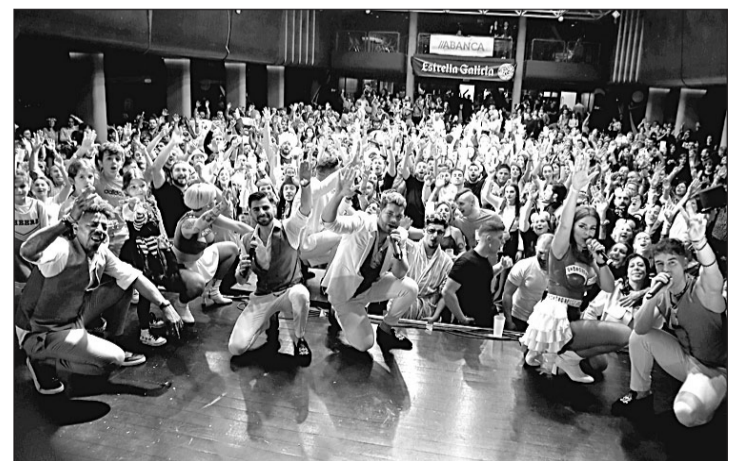
La orquesta Olympus animó a bailar a los participantes.

Más de 500 comensales disfrutaron de una cena-baile y otros tantos gallegos residentes en el país helvético acudieron más tarde para disfrutar de los ritmos más bailables en una verbena de verano gracias a la orquesta Olympus, deleitarse con la presentación internacional del nuevo tema de Dj Rokiño, ‘Coa que traio’, que ha grabado con el solista de la orquesta Panorama, Diego Moreira, y que presume convertirse en el ‘hit’ de este verano y, por supuesto, participar en el concurso de dis-