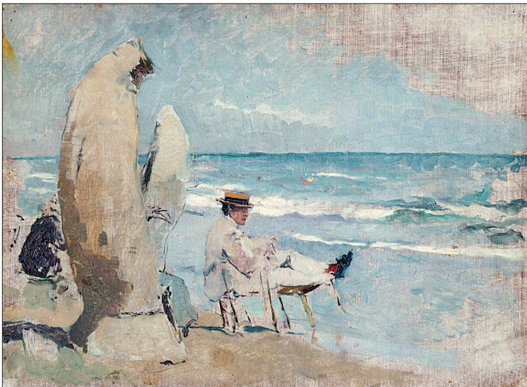
Joaquín Sorolla pintó el cuadro 'Cestos en la playa de Valencia', hacia 1892.

Los interesados en acercarse a la muestra encontrarán en ella una cuidada selección de fondos