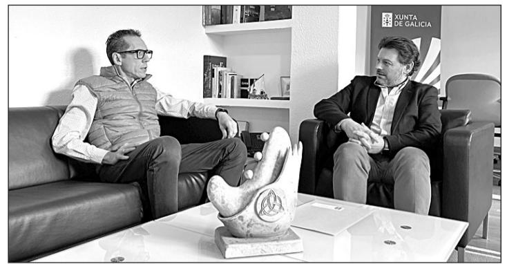
El secretario xeral con el presidente de Feceve en Santiago.

El especial se complementa con una imagen de la revista 'Eco de Galicia' que recoge la importancia que los gallegos le dieron a la iniciativa promovida por Gumersindo Busto; con otra del reconocimiento que le otorgó la USC al investirlo doctor 'honoris causa'; con un artículo de la revista 'Galicia' en el que se expresa el pesar por el fallecimiento del filántropo, así como con otras fotografías más actuales que muestran el Pazo de Fonseca, sede de la Biblioteca América.