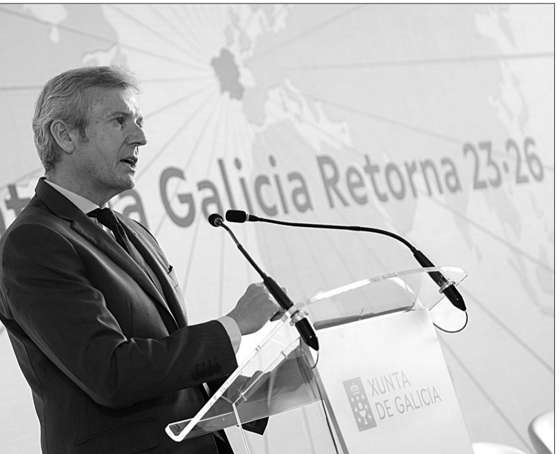
Alfonso Rueda, durante su intervención en la presentación de la Estratexia Galicia Retorna 2023-26.

Rueda habló de una iniciativa novedosa, el programa ‘Retorna emprego’, con el que se pretende sincronizar las vacantes de trabajo de las empresas de Galicia con las demandas de los residentes en el exterior, lo que supone “una herramienta para poner en contacto a los que están en diferentes países y quieren venir a