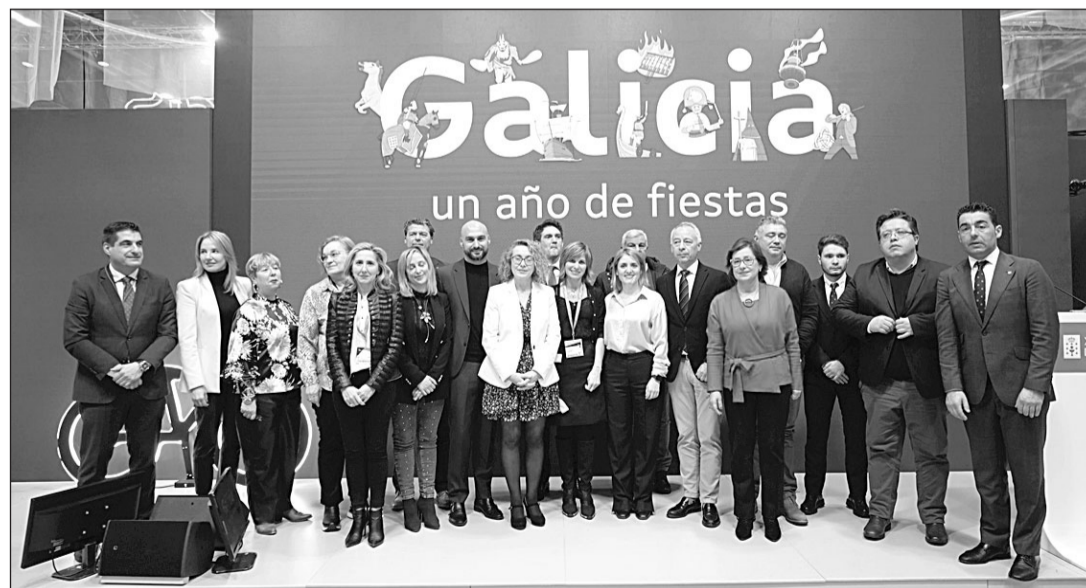
La Xunta puso en valor las festividades de Galicia en el acto que clausuró su participación en Fitur.

"La dimensión de nuestras fiestas", afirmó Castro, "traspasó cualquier frontera y hoy en día muchas de ellas ya se consolidaron como motor económico y herramienta de promoción turística de Galicia para el mundo". En este sentido, destacó la