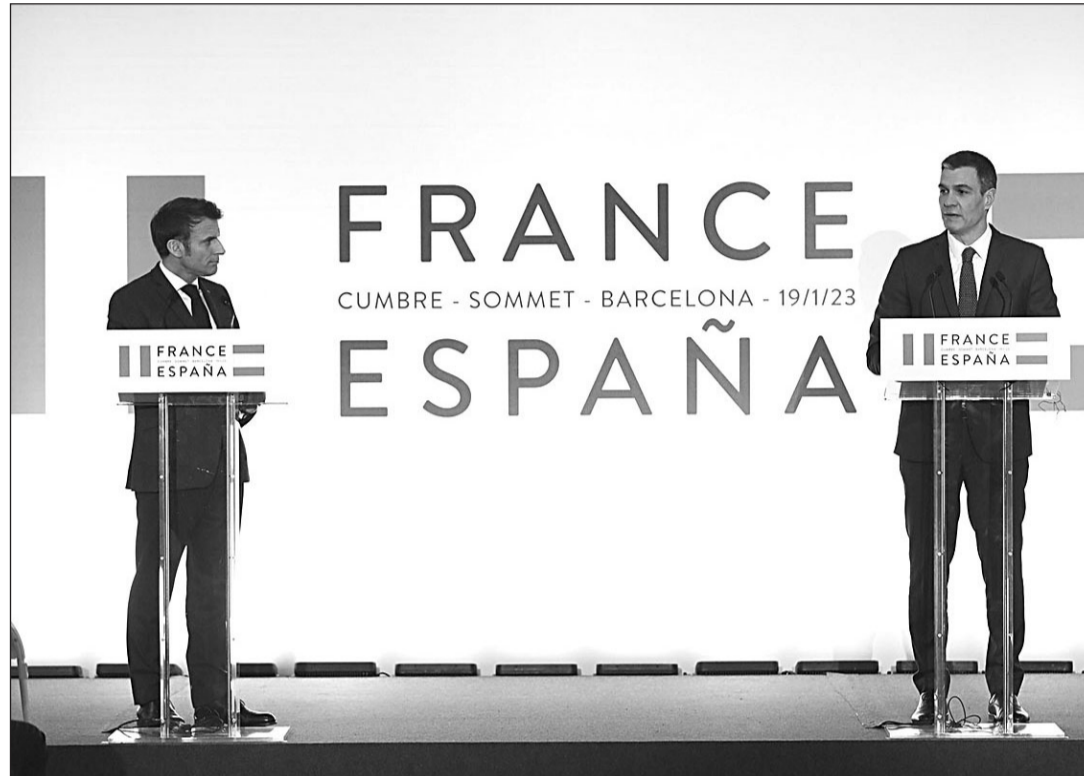
Pedro Sánchez y Emmanuel Macron, durante la rueda de prensa que han ofrecido al término de la Cumbre.

En el capítulo energético -que se ha convertido en crucial desde la guerra en Ucrania-, se comprometen a "seguir desarrollando las interconexiones entre ambos países para alcanzar los objetivos fijados por la Unión Europea", dando prioridad al ámbito energético, pero con las interconexiones de transporte y telecomunicaciones como objeto de "intercambios