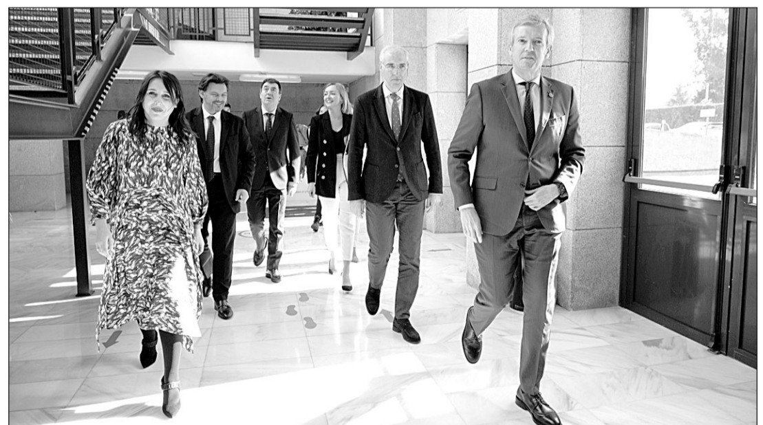
Alfonso Rueda llega al CIS con los conselleiros y el secretario xeral de Emigración que le acompañaron en el acto.

trabajar con los empresarios que necesitan cubrir esos puestos de trabajo”. De esa manera, “todo el mundo sale ganando”, apostilló el presidente gallego.