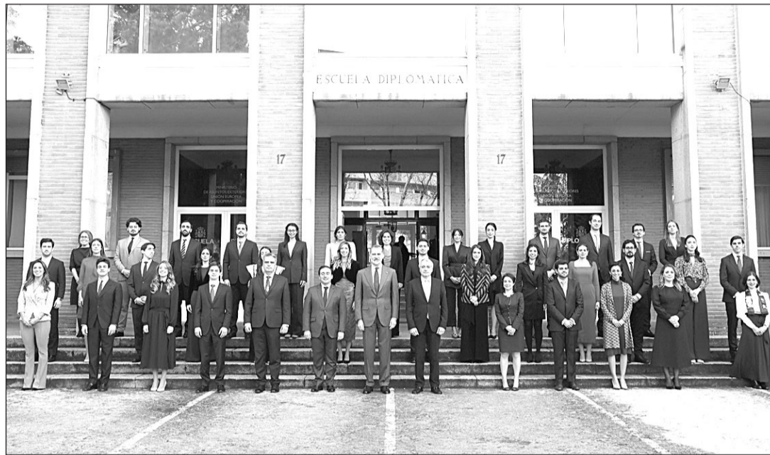
El Rey y el ministro Albares, con los nuevos funcionarios de la Carrera Diplomática.

El Rey felicitó a los recién nombrados y destacó el importante papel que juegan en la representación de España en el extranjero: “Os incorporáis al servicio diplomático de una gran nación. A lo largo de la historia, España ha dejado por todo el mundo una impronta material e inmaterial indeleble, cuyo valor