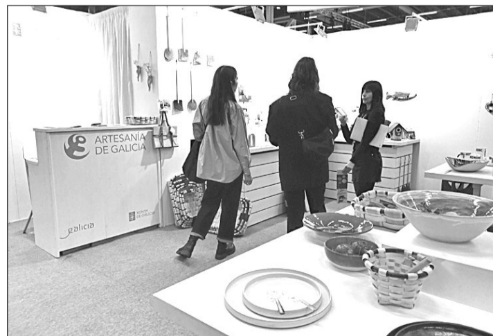
El stand de Artesanía de Galicia en la feria Formex.

En el stand de Artesanía de Galicia en Formex las figuras tradicionales de miga de pan, 'sanandresños', combinaban con piezas de cuero, vidrio y cerámica contemporánea, con la madera orientada a la gastronomía, con la cestería, con los arreglos florales o con el bordado contemporáneo. Las piezas que conformaban esta co-