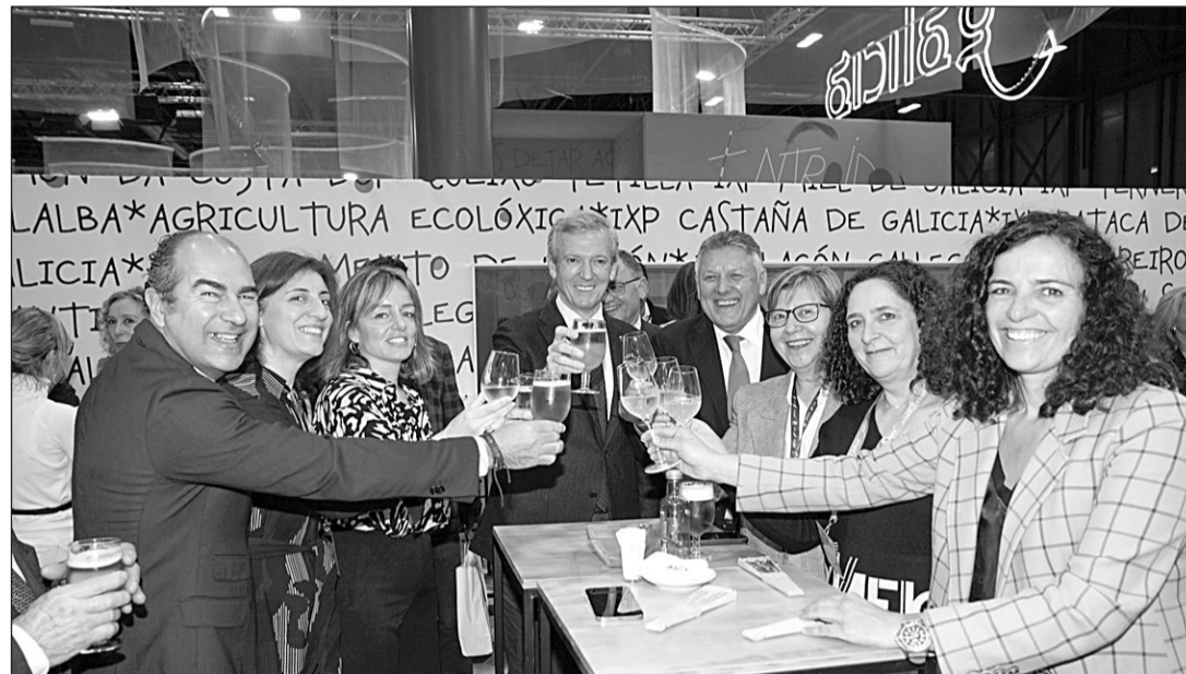
El presidente Rueda brinda con otras autoridades en el stand de Galicia en Fitur.

nos, el turismo náutico y deportivo o el termalismo, numerosas experiencias que llevan el sello de Galicia Calidad.