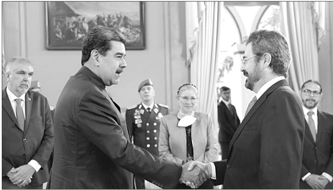
El presidente, Nicolás Maduro, recibió al embajador, Ramón Santos, con un prolongado apretón de manos.

Como un "día histórico" han catalogado las autoridades venezolanas este reencuentro entre España y Venezuela, relaciones que se estrechan con un prolongado apretón de manos entre el embajador y el primer mandatario venezolano, asegurando Maduro Moros que "con diplomacia y respeto podemos avanzar".