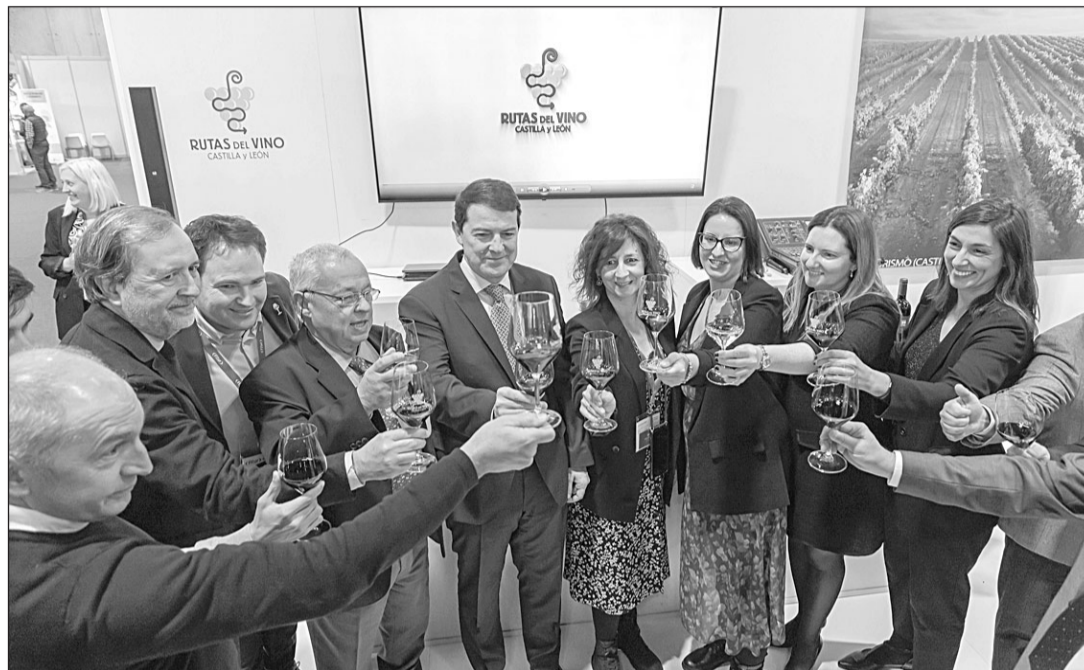
Nava Castro, junto a otras autoridades, en la presentación del stand de Galicia en Fitur.

Con este objetivo, el Gobierno autonómico está ultimando el Plan Director de Turismo 2023-2025, para seguir dando impulso al sector. Esta iniciativa incluirá actuaciones que suponen un incremento del presupuesto para promoción exterior, apostando por mercados clave como Estados Unidos, México o Corea; el desarrollo de destinos como Las Médulas, Siega Verde, Valpueda o el Camino de Santiago; con líneas de ayudas a la calidad turística, a nuevas inversiones hoteleras y a infraestructuras turísticas en zonas rurales; con programas de digitalización y de eficiencia energética para mo-