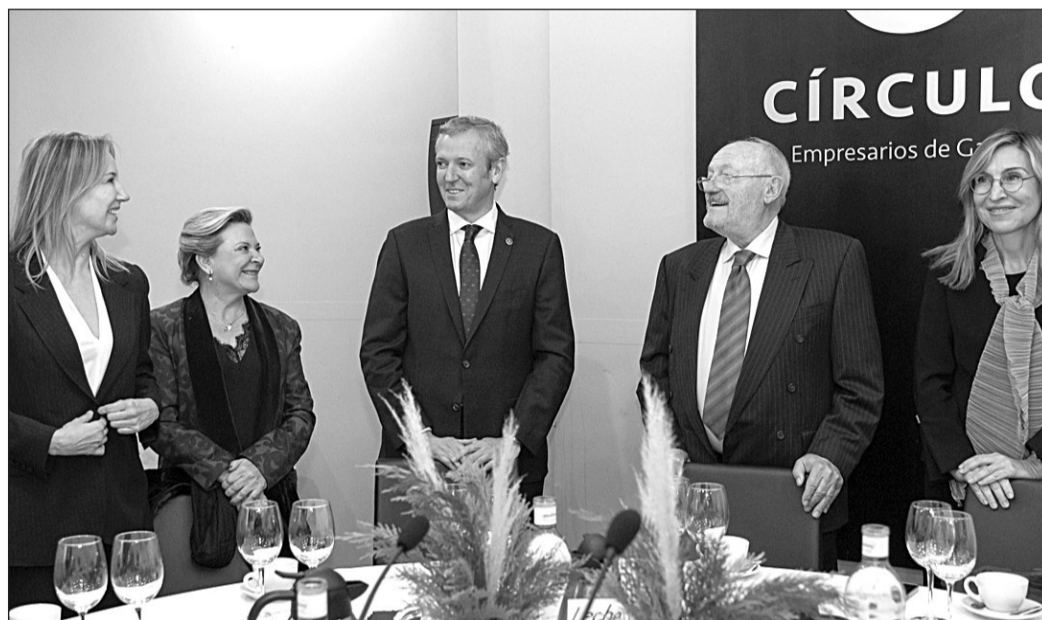
Alfonso Rueda, junto a otras autoridades asistentes al desayuno organizado en Vigo.

América Latina son claves para la reactivación de la economía gallega. Tal y como recoge el Instituto Galego de Estadística, las exportaciones a los países iberoamericanos suman en los primeros once meses del 2022 un total de 1.011 millones de euros, un 17,8% más que en el mismo período del 2021.