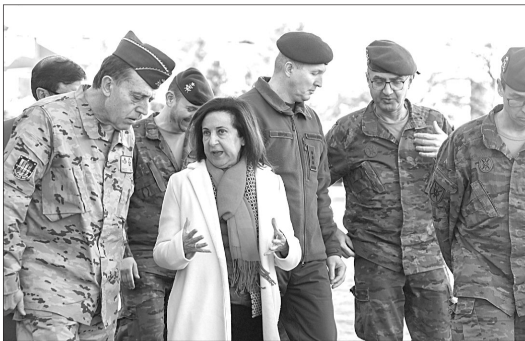
La ministra Margarita Robles, durante la reciente visita al segundo grupo de militares ucranianos que reciben instrucción y adiestramiento en la Academia de Infantería de Toledo.

La postura de Podemos a la decisión del Gobierno del que forma parte es de rechazo al envío de carros de combate a Ucrania, ya que, según su líder y ministra de Derechos Sociales y