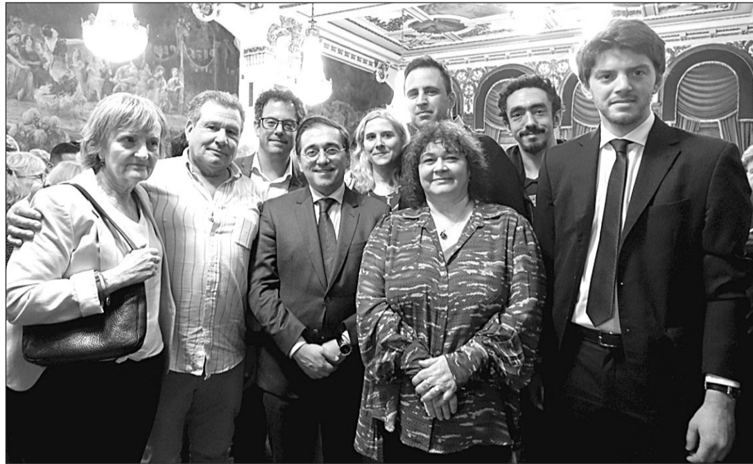
El ministro de Exteriores, José Manuel Albares, durante su encuentro con miembros del CRE y de CEDEU en su visita a Argentina el pasado mes de noviembre.

El Consejo, que también se muestra contrario a la temporalidad de la norma, recuerda que ya en junio del pasado año y en previsión al elevado número de peticiones de nacionalidad al amparo de la Ley de Memoria Democrática, elevaron una propuesta al Pleno del Consejo General de la Ciudadanía Española en el Exterior (CGEE) para que se abrieran más consulados en la demarcación de Buenos Aires, se incrementase el personal y se dotase a este organismo de mayores recursos tecnológicos. Además, pidieron que se ampliasen los servicios de los vi-