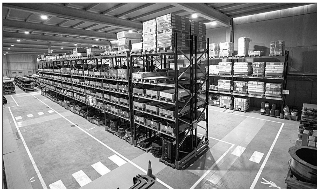
El apoyo de la Xunta a la internacionalización puede alcanzar el 70% de los costes.

En la búsqueda de impulsar la internacionalización del tejido productivo gallego, permitiendo a las empresas apoyarse en herramientas innovadoras para acceder a los mercados exteriores a través de nuevos canales de comercialización, la Vicepresidencia primera, a través del Igape, activó también el 'Galicia Exporta Organismos Intermedios', que busca apoyar iniciativas colectivas coordinadas por agrupaciones empresariales, y el 'Galicia Exporta Dixital', que permite a las empresas apostar por herramientas innovadoras para acceder a los mercados exteriores a través de nuevos canales de co-