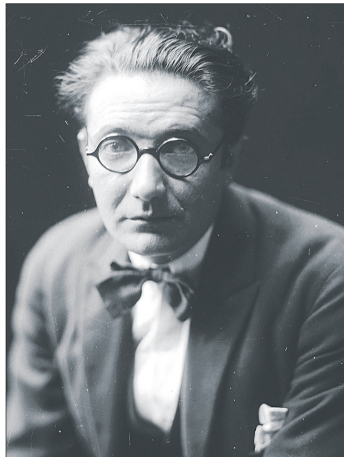
Retrato de Alfonso Daniel Manuel Rodríguez Castelao.

En 1964 ten lugar a fundación do ‘Patronato da Cultura Galega’ por parte do mesmo pequeno grupo de galeguistas que estiveran na creación do programa e coa incorporación de sangue novo como o de Fernando Pereira Caamaño e o das irmás Díaz Gallego. A partir de 1965 comeza a celebración do nacemento de Castelao que durante moito tempo foi o 30 e logo xa o 29