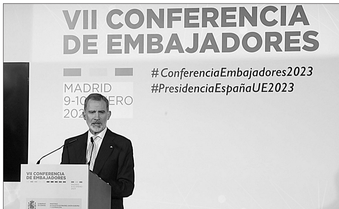
El Rey, durante su intervención en la clausura de la Conferencia de Embajadores.

El Rey también celebró que “esta Conferencia de Embajadores haya podido reunirse de nuevo, permitiendo así el tratamiento de cuestiones de tanta trascendencia y una visión cohesionada de cómo abordarlas en la mejor defensa de nuestros intere-