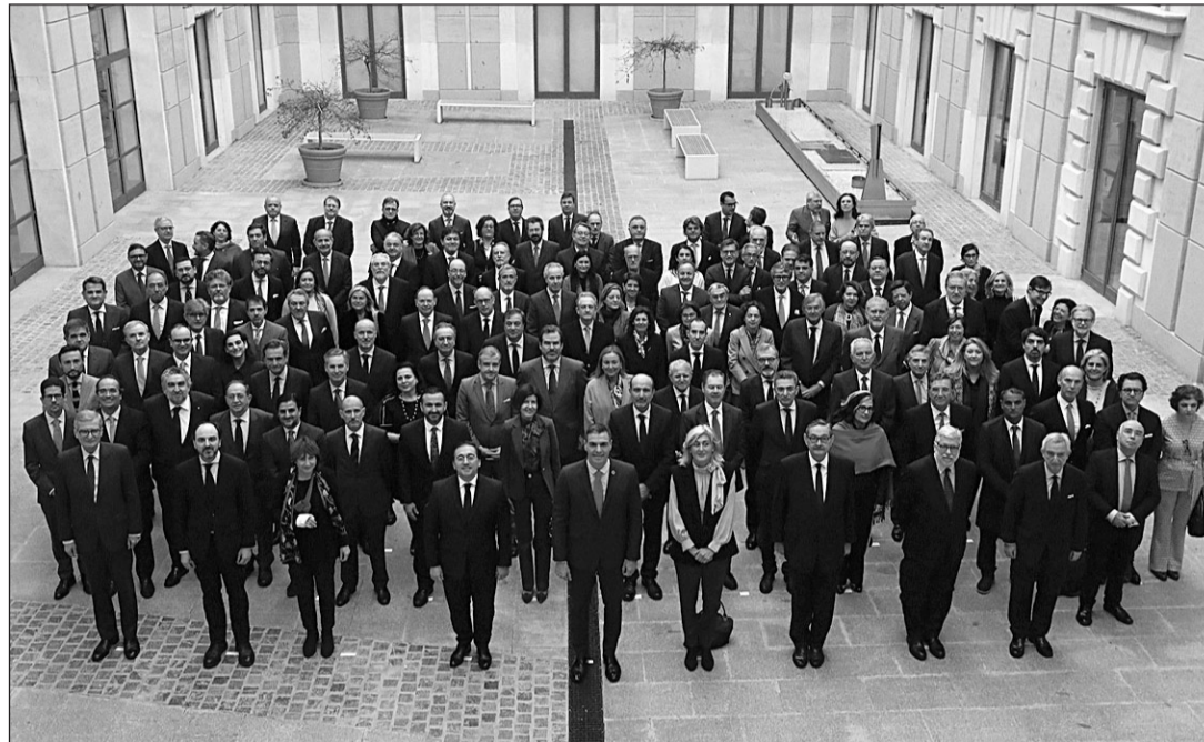
Pedro Sánchez, junto con los embajadores de España presentes en el encuentro celebrado en Madrid.

Pedro Sánchez ha destacado el impacto que la invasión de Ucrania por parte de Putin tiene en materia energética, alimentaria, y de desafío a la arquitectura de la seguridad internacional. Asimismo, el presidente ha recalcado la necesidad de que Europa se posicione