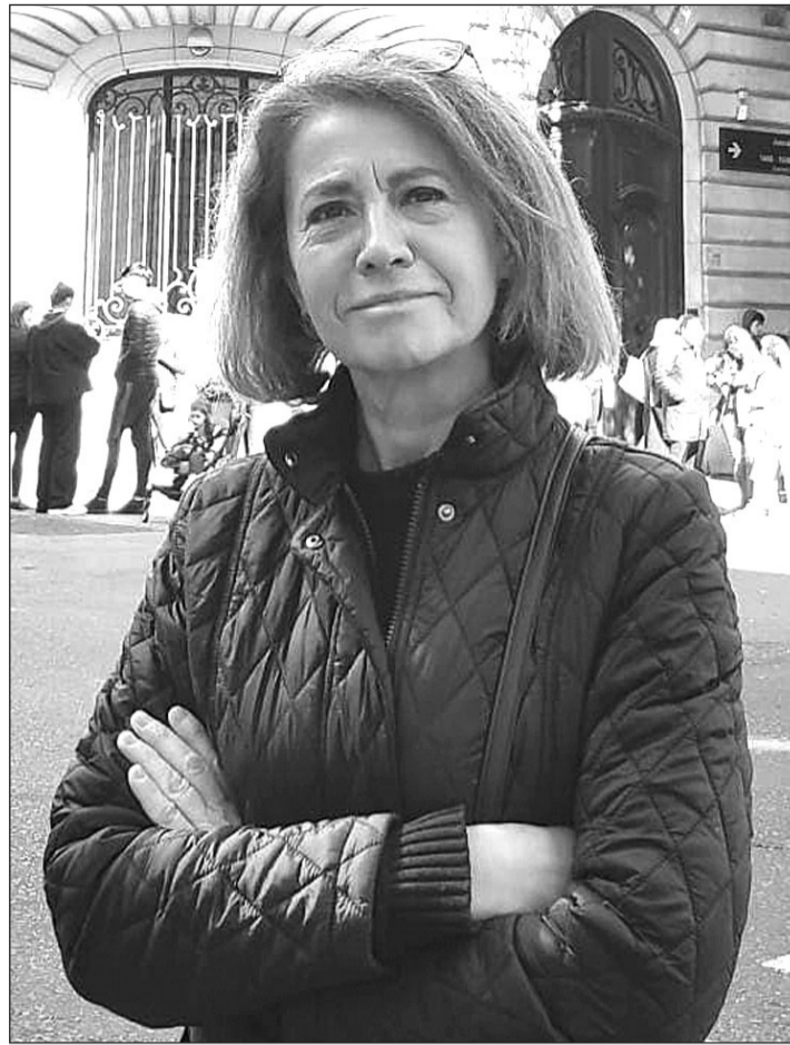
La catedrática obtuvo el Premio Nacional de Historia por su último libro.

R. Si emigraban muchos solteros las opciones de casarse disminuían. Así tenemos en todo el norte la tasa de soltería definitiva femenina más alta de todo el país. En algunas zonas de Asturias, Cantabria o Galicia, más del 25% no podían casarse porque no había hombres. Además, se retrasaba la edad de contraer matrimonio, porque se esperaba al dinero