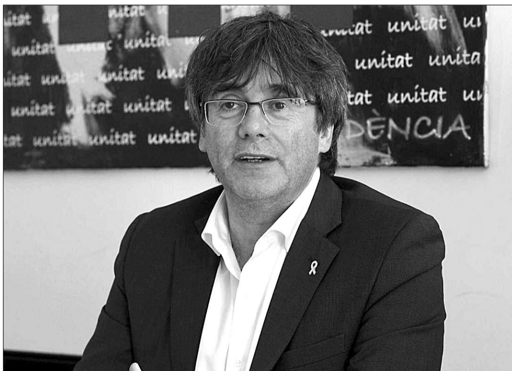
El expresidente catalán Carles Puigdemont, en una imagen de archivo.

Ante la derogación del delito de sedición, por el que estaban procesados Puigdemont, Comín, Ponsatí y Rovira, el instructor entiende que los hechos de la causa relacionados con el mismo son subsumibles ahora en un delito de desobediencia, ya que considera que no encajan en el delito de desórdenes públicos.