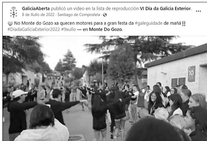
El Día da Galicia Exterior supuso la llegada de hasta 138.000 visualizaciones y 4.400 'likes'.

En cuanto a las principales redes sociales en las que la Secretaría Xeral de Emigración cuenta con una página activa para divulgar sus programas y las fases de las diferentes convocatorias, así como para promover las diferentes acciones que tanto el Gobierno gallego como la propia colectividad gallega en el exterior lleva a cabo