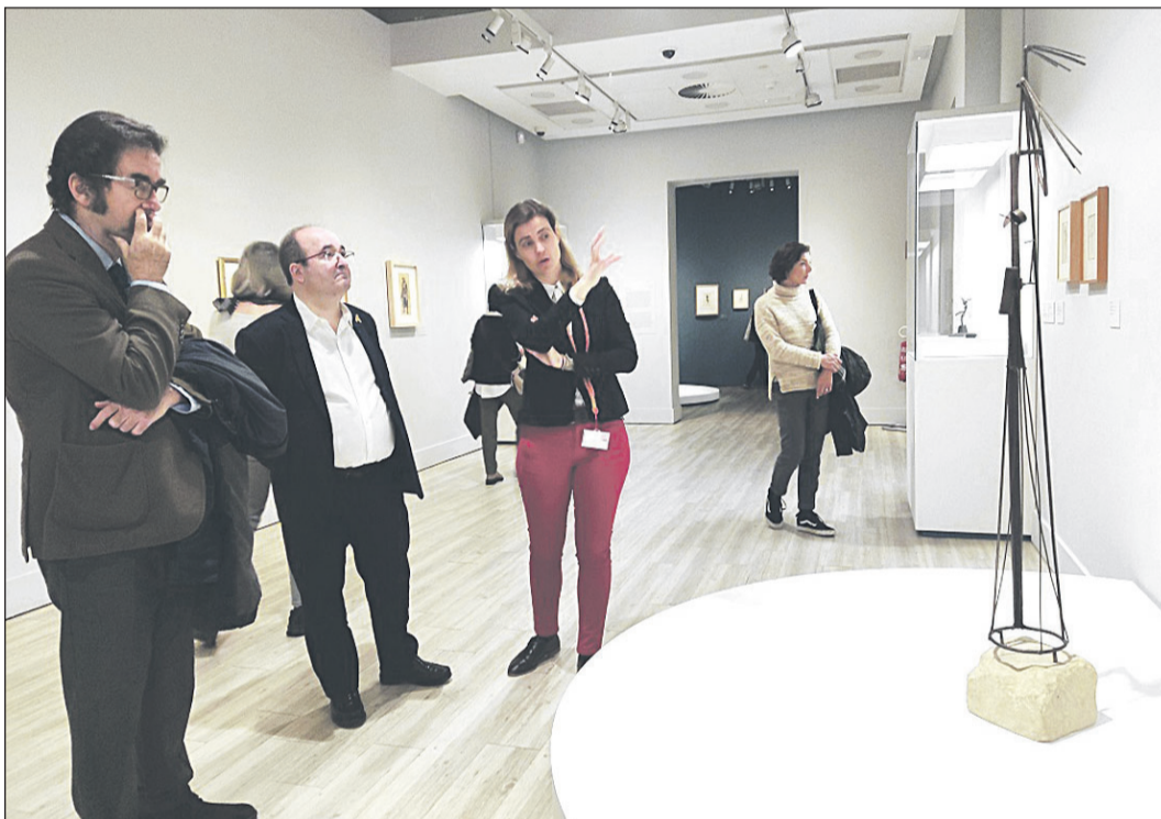
El ministro de Cultura, Miquel Iceta, durante su visita a la exposición sobre Picasso en la Fundación Mapfre.

Entre septiembre y diciembre se han inaugurado las exposiciones 'Picasso-El Greco' (Kunstmuseum Basel, Bâle, Suiza); 'Fernande y Françoise' (Kunstmuseum Pablo Picasso Münster, Alemania); 'Fernande Olivier y Pablo Picasso, en la intimidad del Bateau-Lavoir' (Musée de Montmartre, París); 'Picasso y la abstracción' (Musées royaux des Be-