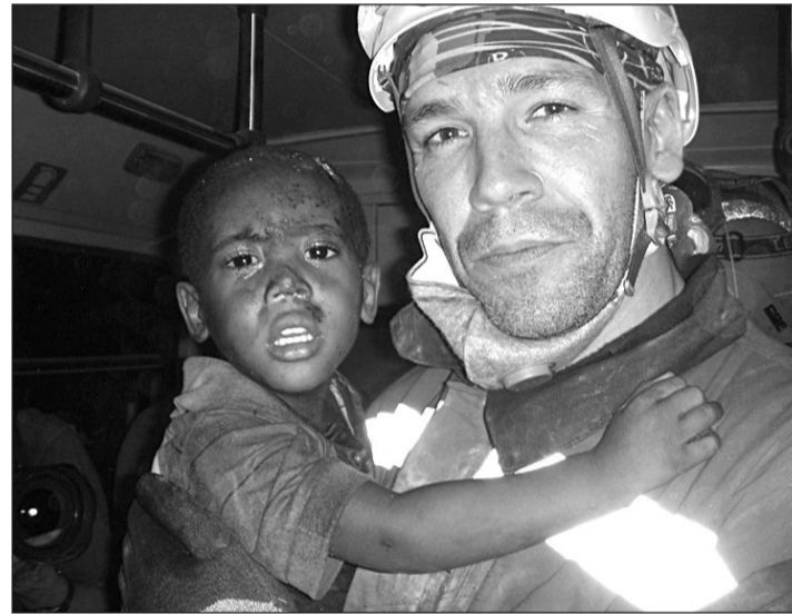
La cooperación internacional incrementa su presupuesto hasta los 6 millones.

5. Programa de Defensores de Derechos Humanos: se trata de una novedad muy destacada, ya que es la primera vez que se llevará a cabo en la Comunidad, donde se incluirán varias actuaciones dirigidas a proteger a aquellas personas perseguidas en países empobrecidos por defender los derechos de su Comunidad y que