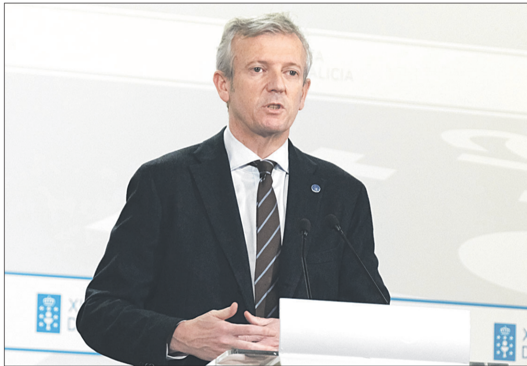
Pág. 5 Alfonso Rueda, durante la rueda de prensa posterior a la reunión del Consejo de la Xunta del pasado jueves.

Rueda destacó que estas becas para cursar un máster universitario tienen un doble objetivo: “Que los jóvenes en el exterior mejoren su formación” y que se incorporen al mercado laboral y fijen su residencia en Galicia. “La mayoría de los jóvenes que reciben estas becas se quedan viviendo en Galicia al incorporarse aquí al mercado laboral”, resaltó el presidente.