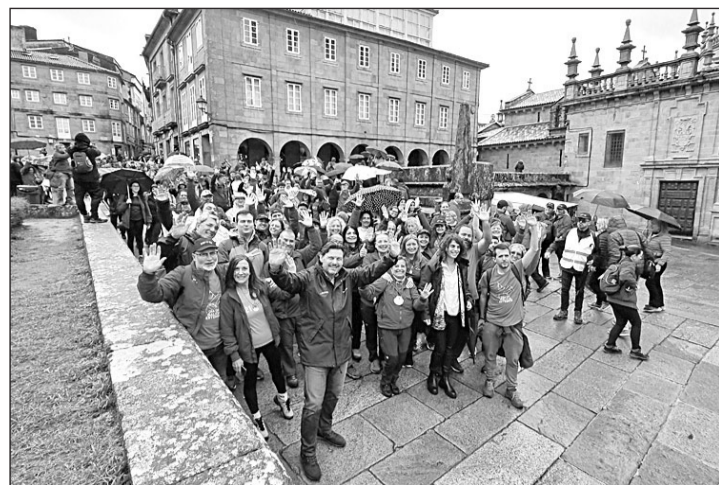
Miranda, con un grupo de participantes en el programa 'Conecta co Xacobeo'.

Entre los principales contenidos de la página de la Secretaría Xeral de Emigración en Facebook, destacan todos los reproducidos durante la celebración en julio de 2022 del Día da Galicia Exterior, que supuso la llegada de hasta 138.000 visualizaciones y 4.400 'likes' de alguno de los videos de los actos que se desarrollaron. En esta cuenta, GaliciaAberta llega hasta los 28.535 seguidores, aumentando un 6,7% con respecto a 2021, y Twitter roza los 5.800, con un incremento interanual superior al 5,6%.