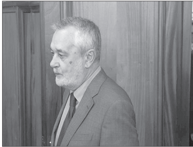
José Antonio Griñán, expresidente de la Junta de Andalucía.

También la forense especifica que el diagnóstico es "muy cercano en el tiempo" y que el tratamiento no se ha llevado a cabo aún, por lo que se trata de "un análisis predictivo" porque desconocen cuál será la evolución.