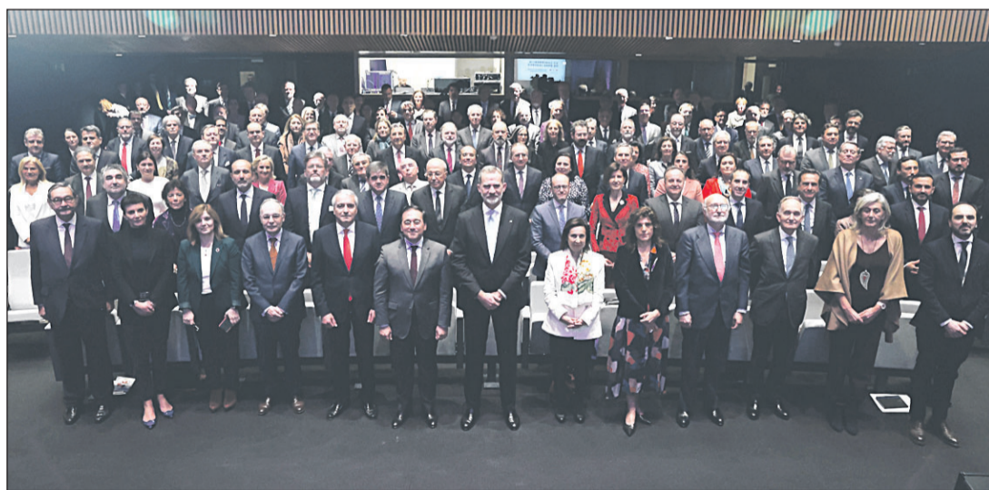
El Rey y varios miembros del Gobierno posan con los diplomáticos asistentes a la Conferencia de Embajadores.