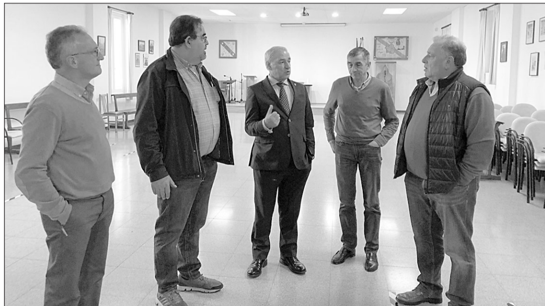
El presidente de la Deputación de Lugo, durante su visita a la Agrupación Cultural Galega Saudade de Barcelona. GM

En la actualidad, la agrupación cultural Saudade oferta una gran variedad de actividades culturales y sociales. Imparten cla-