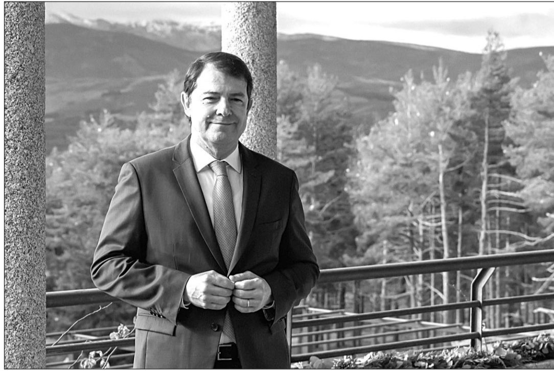
Alfonso Fernández Mañueco grabó su mensaje de Fin de Año en el Parador de Gredos.

Asimismo, ha manifestado el impulso de sectores estratégicos como la agroalimentación, automoción y las energías renova-