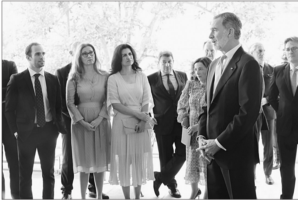
El Rey se dirige a la representación de la colectividad española en Brasil.

Sobre ese encuentro, el ministro Albares afirmó que "las españolas y españoles residentes en Brasil son los mejores embajadores cotidianos de España en el país, y contribuyen a que los lazos entre nuestros dos países sean más fuertes". El responsable de Exteriores explicó que "ha sido muy grato conversar con ellos hoy en Brasilia durante el encuentro con la colonia".