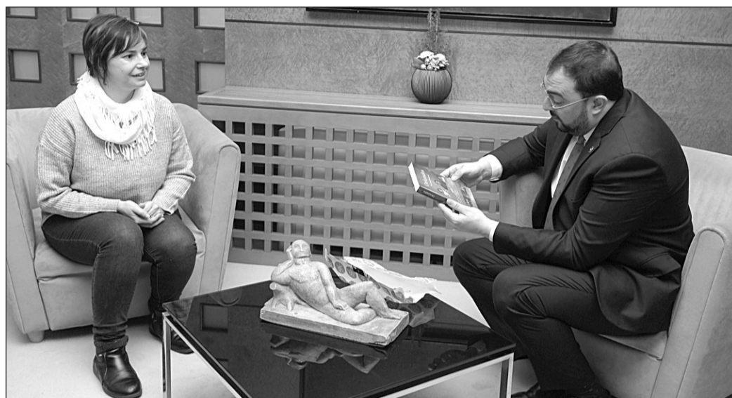
Violeta Alonso regaló el libro ‘Oriundos’ al presidente Adrián Barbón.

las diferentes políticas de cada comunidad, desde el Consejo se quiere poner en marcha una página o un espacio donde se pueda acceder a la información sobre todas las ayudas y los planes de retorno de cada comunidad “porque ahora está todo muy disgregado, es un poco confuso y nos falta ese punto de información común”. “Probablemente –dice la presidenta– cuando tengamos más claro lo que hace cada comunidad, podremos mejorar los planes de retorno, tanto a nivel estatal como para hacer propuestas a las comunidades que estén más descolgadas y que tengan una emigración importante”.