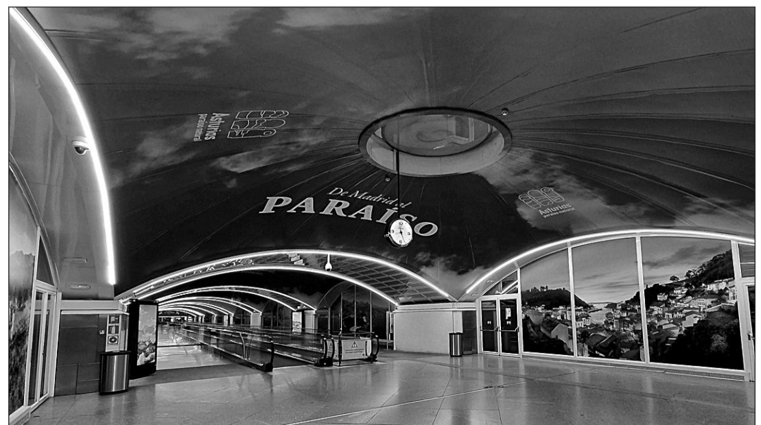
Vista del techo y los paneles donde se ha instalado la publicidad de Asturias en la estación de Atocha.

Esta es la primera de las acciones del Gobierno del Principado para aprovechar la ventaja competitiva que supondrá contar en mayo con la conexión ferroviaria de alta velocidad. El plan completo será presentado el 18 de enero en la Feria Internacional de Turismo (Fitur).