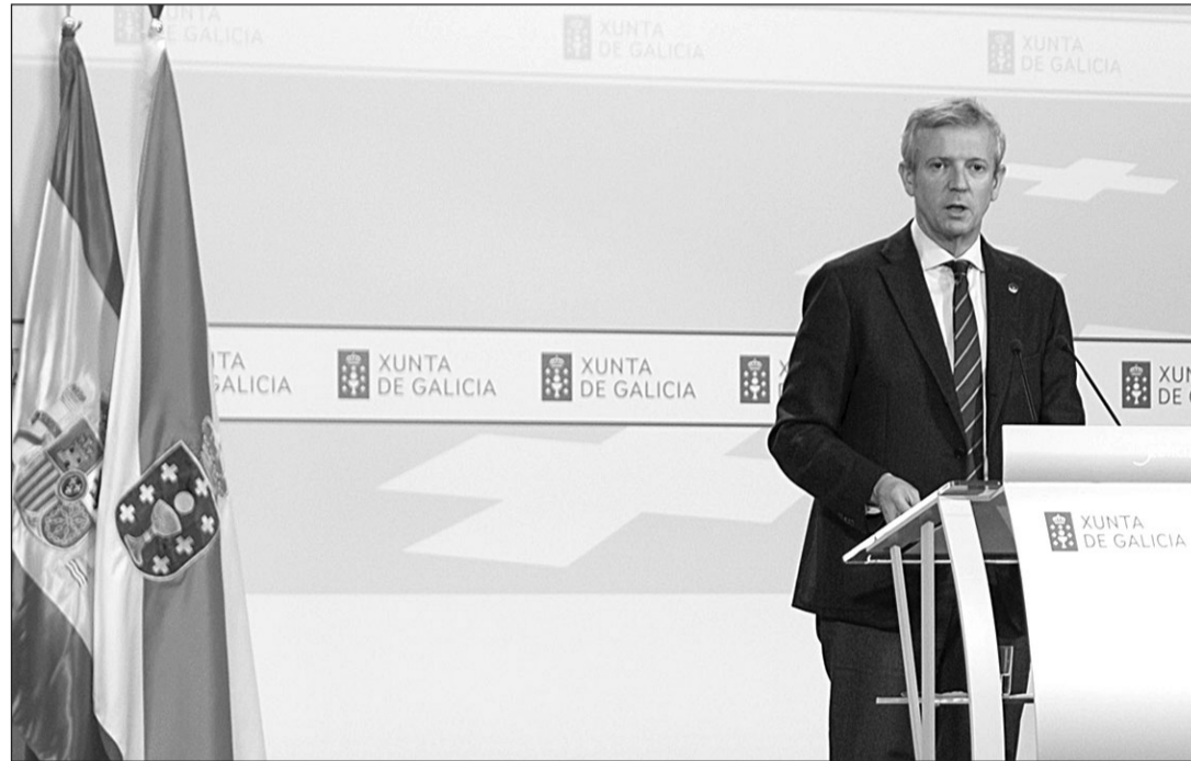
Alfonso Rueda, durante la rueda de prensa posterior a la reunión semanal del Consello de la Xunta.

“La mayoría de los jóvenes que reciben estas becas se quedan viviendo en Galicia”, resaltó el presidente