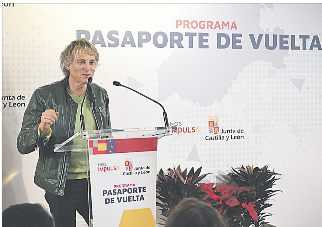
Jesús Calleja, durante su intervención en el acto que organizó la Junta de Castilla y León en la Casa Botines de León para impulsar el programa 'Pasaporte de vuelta', para el fomento del retorno.

El lanzamiento y el aterrizaje lo retransmitirá en directo Me-