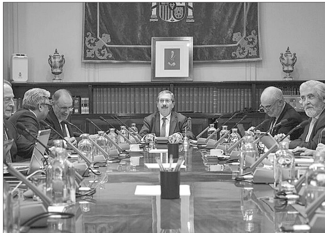
El presidente del CGPJ, Rafael Mozo (centro), preside el pleno extraordinario celebrado la semana pasada.

El presidente del TC ya ha acordado convocar de forma in-