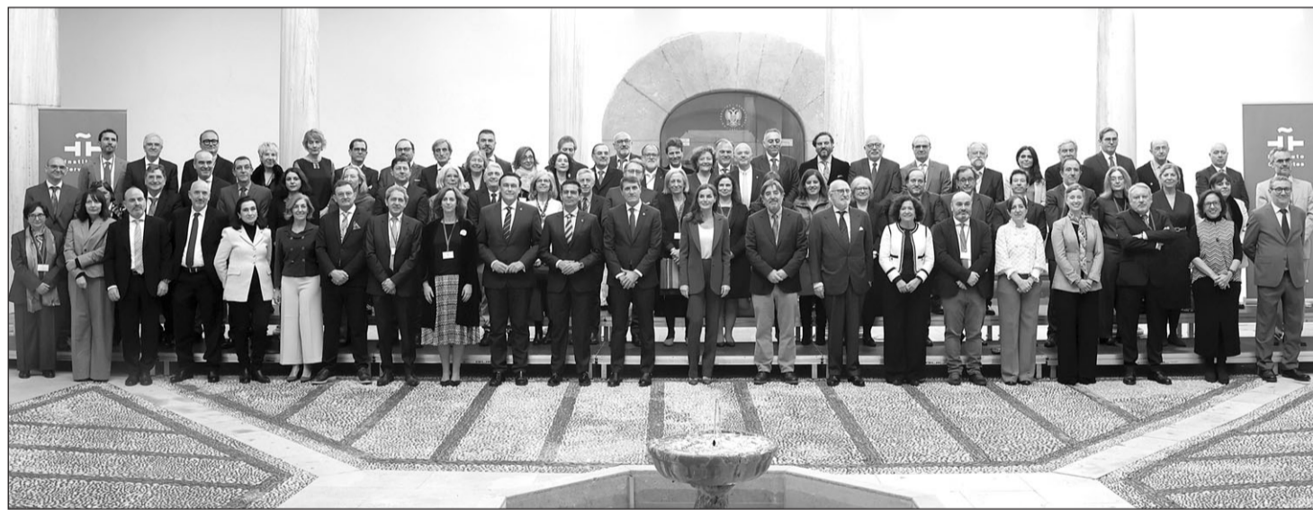
La Reina posa junto al resto de autoridades y los directores del Cervantes presentes en el Encuentro.

Tras la sesión de conclusiones, el cantante Miguel Ríos entregó a Luis García Montero un legado para la Caja de las Letras del Cervantes, que el director del Instituto depositará, a su vuelta a Madrid, en la cámara acorazada de la sede central. El artista granadino ofreció además el concierto ‘Vuelvo a Granada’, acompañado por la Black Betty Band, Antonio Arias y Anni B Sweet.