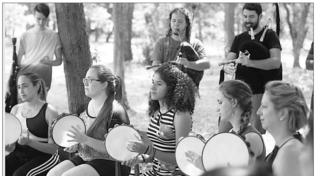
De los 37 talleres que se realizaron, 22 fueron de folclore.

La modalidad presencial de estos talleres se desarrolló en las instalaciones de los centros manteniéndose, un año más, la modalidad telemática a través del aula virtual, una plataforma donde la persona formadora y el alumno interactúan, de manera concurrente y en tiempo real, a través de un sistema de comunicación telemática. En ambos casos, los cursos fueron impartidos por profesionales con reconocida experiencia en