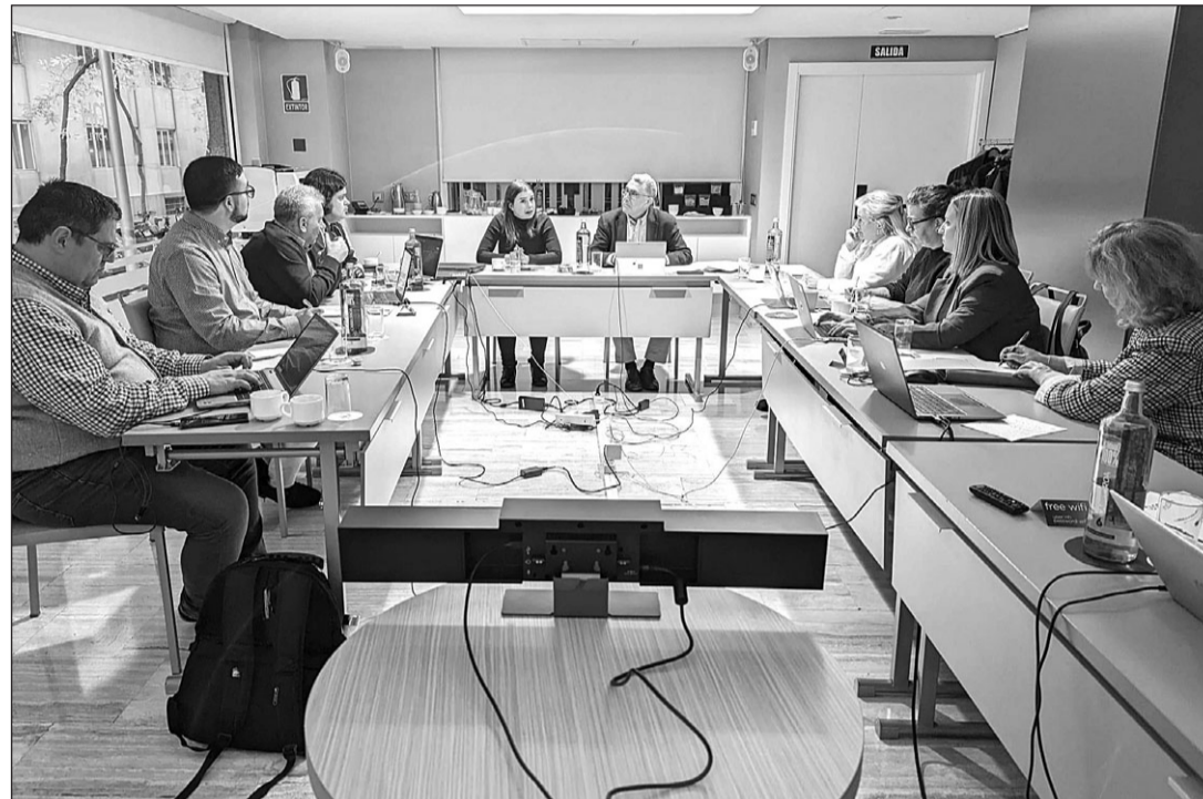
Violeta Alonso y José Julio Rodríguez presidieron la reunión de la Comisión Permanente.

gulación del voto exterior fueron otros de los temas tratados. Desde el Consejo se elaboró un informe sobre los centros de votación en los que se pide flexibilizar la norma para contar con el mayor número de lugares de votación posible. También se pide que se establezcan las normas para ver dónde es necesario abrir centros de votación en función del número de población y de la distancia.