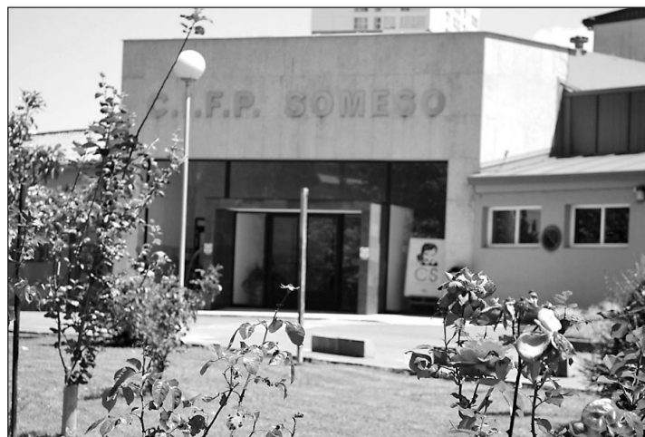
El Centro Integrado de Formación Profesional Someso, en A Coruña.

Las becas, dotadas con 6.500 euros cada una de ellas, incluyen el viaje desde el país de origen, el alojamiento y manutención en la comunidad gallega y la suscripción de un seguro médico de ser el caso. Los beneficiarios recibirán un primer pago de 3.700 euros en el primer trimestre del curso (con el único requisito de estar matricuado) y un segundo pago de 2.800 euros en el segundo trimestre de la formación. En este caso el alumno deberá haber aprobado el 70% de los módulos cursados