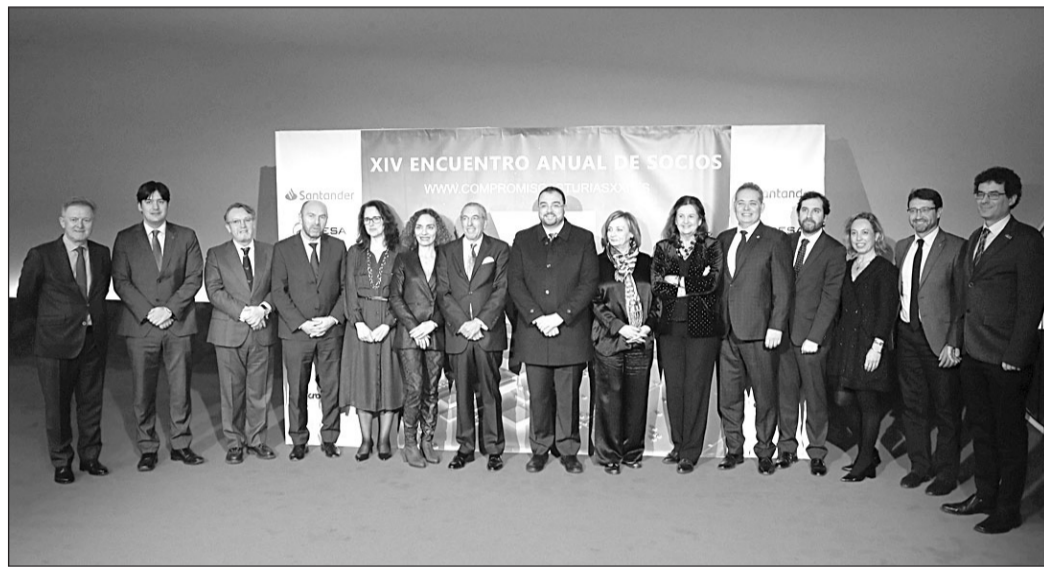
El presidente posa junto a otras autoridades y directivos y socios de Compromiso Asturias XXI.

que “el presupuesto de 2023 incluirá una partida para la creación de la Oficina del Retornado, concebida precisamente para facilitar el regreso a Asturias”. “Necesitamos contar con la emigración –señaló–; es decir, queremos y necesitamos contar con ustedes y sus ideas. Con la disposición a volver, con el ánimo emprendedor, con el talento, y a nosotros nos corresponde propiciar el ecosistema más favorable para ello. La atención a la emigración se convertirá en una de las paredes maestras de nuestra política demográfica en los próximos años. Es más que una promesa y una convicción; es imprescindible”.