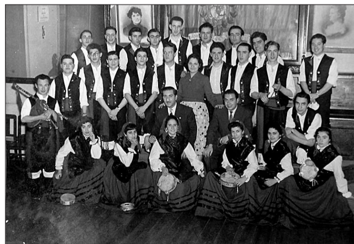
El conjunto coral y artístico 'Anaquiños da Terra' fue creado en 1955 y se convirtió en la primera agrupación coral existente en Portugal.

Una de las prioridades de la sociedad era alcanzar la solidaridad y mantener los lazos de unión de todos los emigrantes gallegos residentes en Lisboa, por lo que era ha-