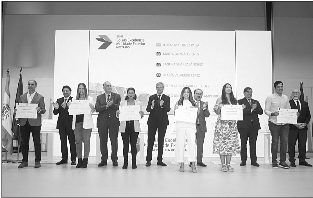
Autoridades de la Xunta y de las universidades gallegas entregan el diploma a beneficiarios de las BEME en una edición anterior.