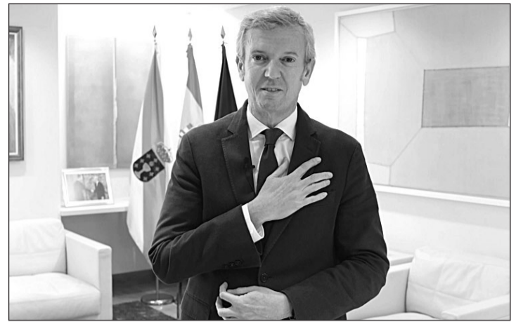
El presidente Rueda, durante la grabación del video de felicitación.

Las becas sufragarán viaje, matrícula, alojamiento y manutención, con unas cuantías que oscilan entre los 7.500 y los 12.000 euros, dependiendo del continente de la persona beneficiaria.