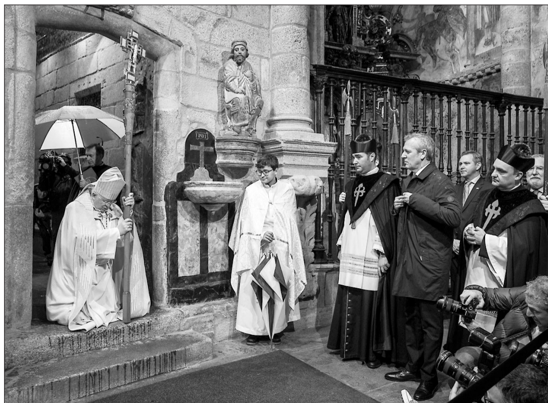
Alfonso Rueda participó como delegado regio en el cierre de la Puerta Santa.

Alfonso Rueda también participó, el pasado sábado, en calidad de delegado regio, en los actos de clausura de la Puerta Santa, en la catedral de Santiago de Compostela, y que supone el fin de las celebraciones del bienal Año Santo 2021-2022.