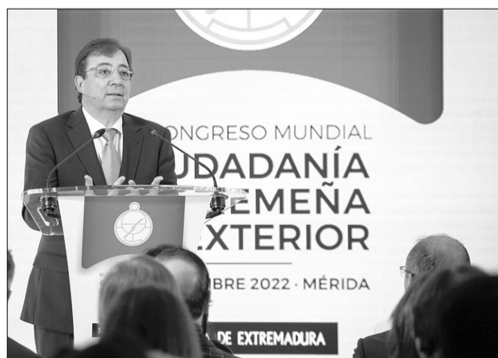
Guillermo Fernández Vara, durante su intervención en la inauguración. GM

El presidente, que ha hecho estas declaraciones durante la inauguración del III Congreso Mundial de Ciudadanía Extremeña en el Exterior que se celebró en Mérida, ha recordado “el dolor” que supuso la salida masiva de 500.000 extremeños a finales