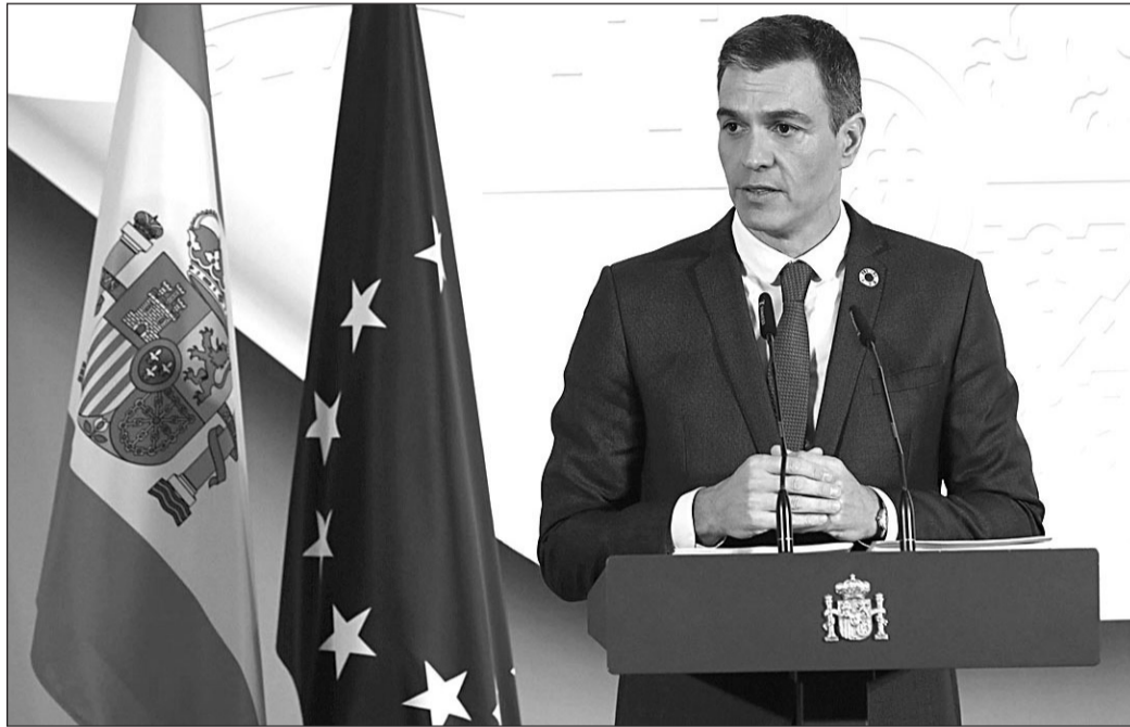
El presidente del Gobierno, Pedro Sánchez, durante su intervención en la rueda de prensa posterior a la reunión del Consejo de Ministros del pasado martes.

Por lo que respecta a la concesión de la ayuda de 20 centimos por litro de combustible, se prorrogará, pero solo para los que se dediquen al transporte