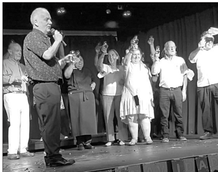
El presidente y la directiva brindaron por un venturoso año 2023.