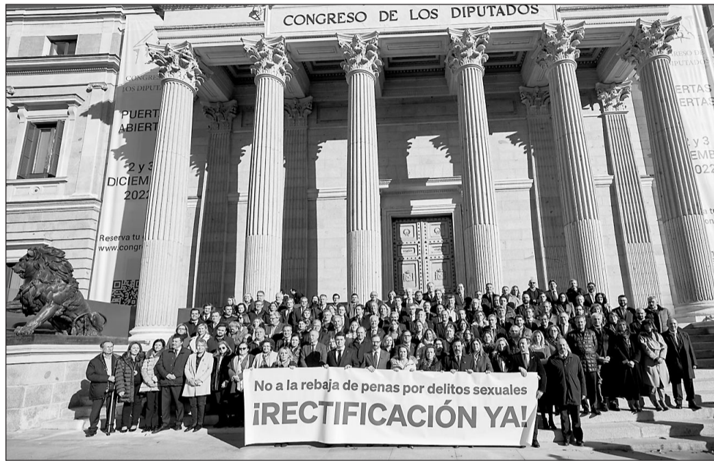
Diputados y senadores del PP, durante la protesta en las puertas del Congreso.

Las consecuencias de la entrada en vigor de la ley siguen