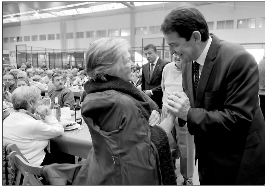
El jefe del Ejecutivo autonómico conversa con una asistente al evento durante el convite.

El presidente considera que las entidades son un pilar esencial para que perviva el sentimiento de orgullo de la región