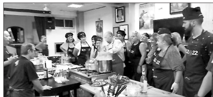
Los alumnos aprendieron a preparar platos típicos gallegos.

Estas oficinas vienen a complementar el trabajo que se realiza desde la Oficina Integral de Asesoramiento e Seguimento ao Retorno de la Xunta. Destacan especialmente las itinerantes con las que cuenta Fevega, que acercan la información sobre diversas cuestiones relativas al retorno a aquellas personas que las demandan por toda la comunidad autónoma.