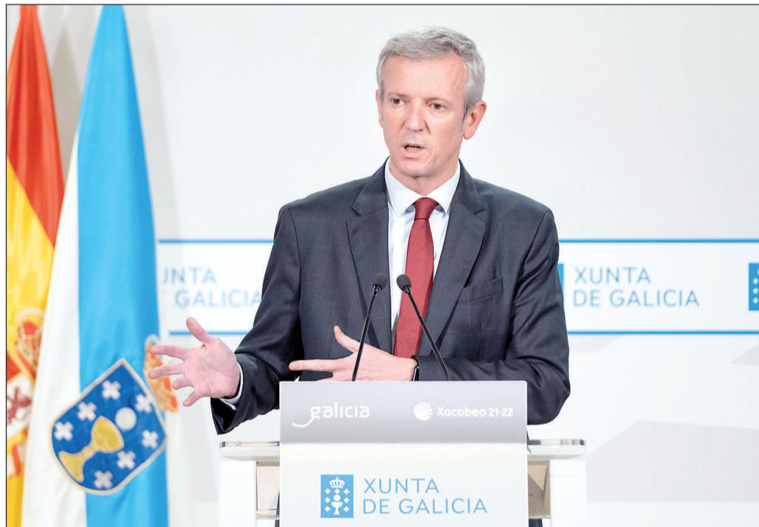
Alfonso Rueda, durante la rueda de prensa posterior a la reunión del Consello de la Xunta del pasado jueves.

Alfonso Rueda explica los beneficios de la Estratexia Galicia Retorna y las BEME al presidente de Asturias / Pág. 6