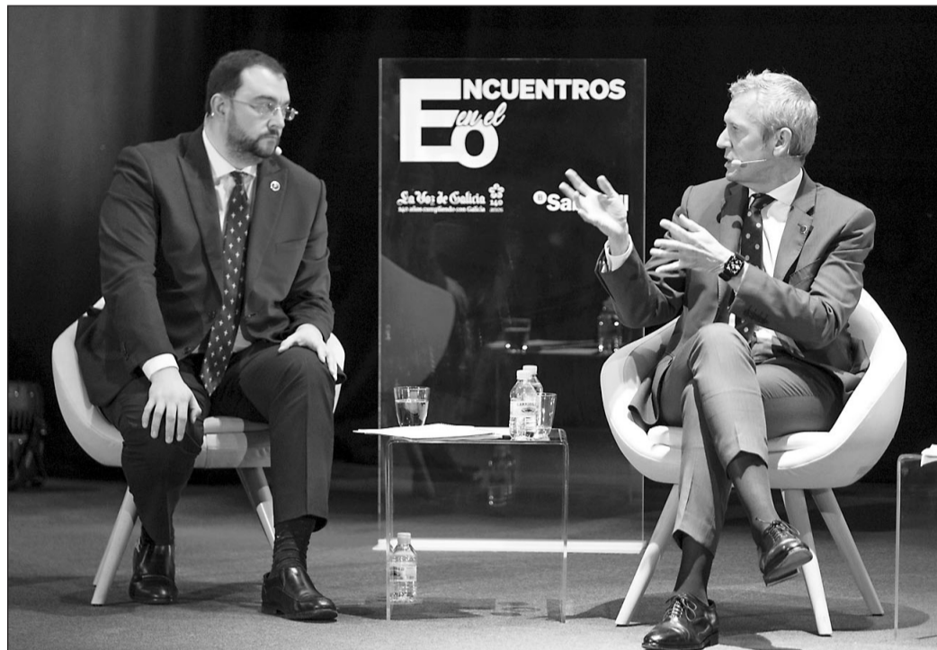
Alfonso Rueda y Adrián Barbón, durante su encuentro de la pasada semana, en Lugo.

En su intervención, Rueda recordó la posición conocida de las comunidades del Noroeste, plasmada en la Declaración de Santiago, en la necesidad de una financiación autonómica basada en una “justicia distributiva” que tenga en cuenta el envejecimiento y la dispersión demográfica, de la que advirtió que este hecho provoca que en Galicia se concentre 1 de cada 5 euros del gasto en transporte escolar y resulta ser la comunidad que concentra el 14% de los centros de salud de España con menos del