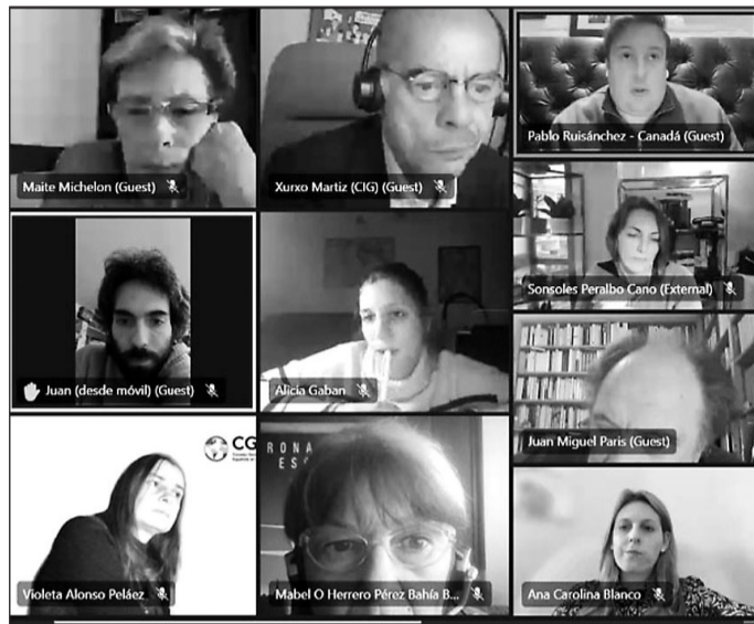
Participantes en la reunión telemática de la Comisión de Derechos Civiles.

Tanto estas reuniones de comisiones celebradas, como el próximo pleno tienen carácter extraordinario