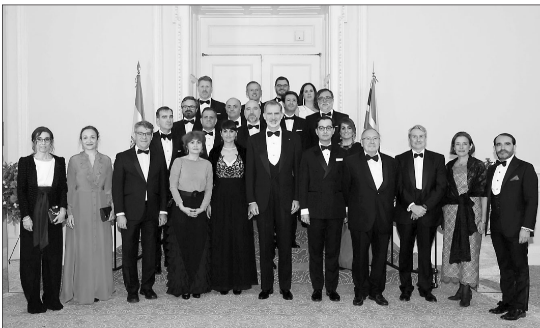
Felipe VI, con los participantes en la cena gala de la Cámara de Comercio de España en Reino Unido.