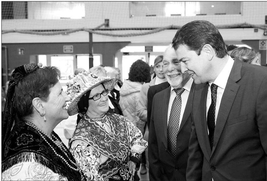
El presidente saluda a dos mujeres de la colectividad castellana y leonesa en Euskadi.