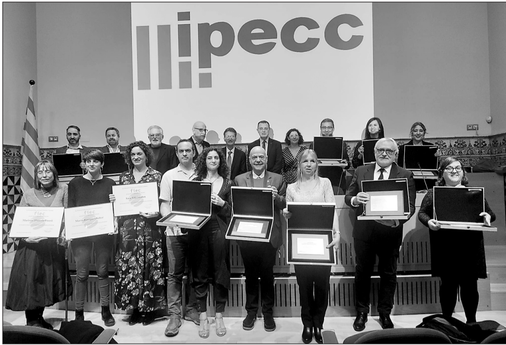
Todos los galardonados con el Premio Batista i Roca y con el Premio FIEC.

En la misma ceremonia se otorgaron también los Premios FIEC