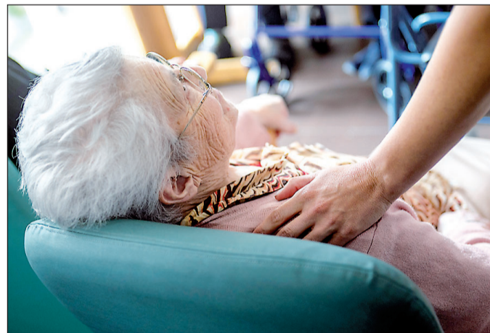
Los mayores gallegos disponen de servicios para mantenerse activos.

Este servicio atiende a personas en situación de dependencia y contempla un servicio básico y uno avanzado, que presta apoyos