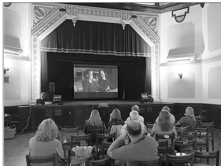
Proyección de la película en Montevideo.

El Consello da Cultura Galega, en colaboración con la Secretaría Xeral de Emigración, mantiene el especial ‘Historias de ida e volta’ para dar a conocer aquellos materiales que documentan el fenómeno migratorio. En 20 entregas se documentaron los procesos de salida, llegada, la vida social y cultural... para, de este modo, explicar todo el ciclo migratorio a partir de los materiales que custodia el Archivo de la Emigración Gallega.