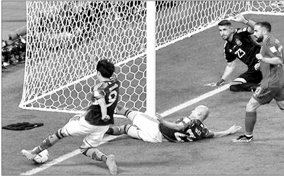
El VAR consideró que el balón no salió del todo en la jugada del segundo gol de Japón.

INCIDENCIAS: Encuentro correspondiente a la tercera jornada del Grupo E disputado en el Estadio Khalifa Internacional ante la presencia de 44.851 espectadores.