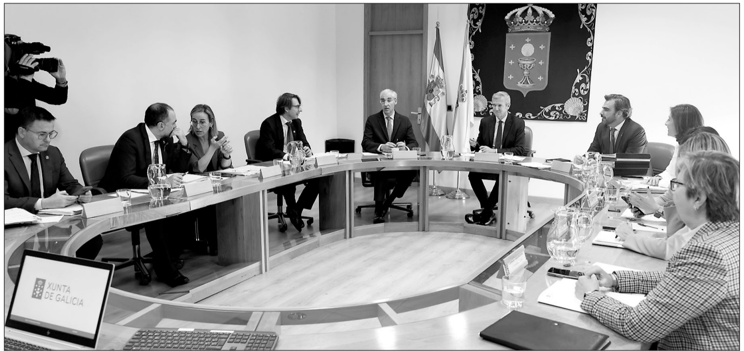
Alfonso Rueda presidió la reunión del Consello de la Xunta que aprobó el balance de la primera Estratexia Galicia Retorna.

También es muy importante destacar que las estadísticas de población publicadas el 18 de noviembre de este mismo año, con los datos provisionales del primer semestre de 2022, destacan que el saldo migratorio en este período fue positivo en 12.768 personas, el mayor de la serie histórica de un solo semestre, y que, al igual que en 2019,