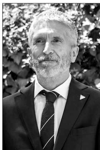
Fernando Grande Marlaska.

En otras imágenes como las reveladas por RTVE.es el pasado 8 de noviembre, se aprecia