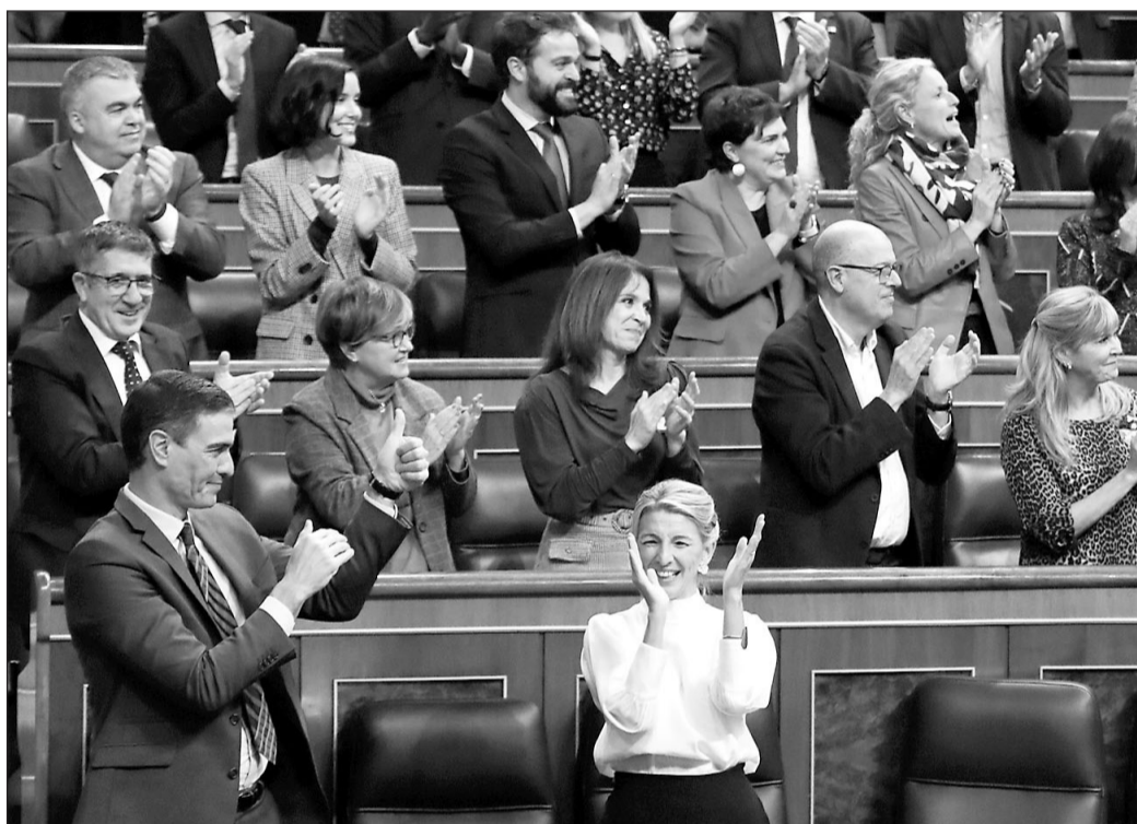
Pedro Sánchez, junto a la vicepresidenta segunda y ministra de Trabajo y Economía Social, Yolanda Díaz, tras aprobar el Pleno del Congreso el Proyecto de Ley de Presupuestos Generales del Estado de 2023.

permitirán "canalizar los fondos europeos" para modernizar la economía y consolidar el crecimiento, pero sobre todo, destacó que esta votación "garantiza una estabilidad política necesaria" para España.