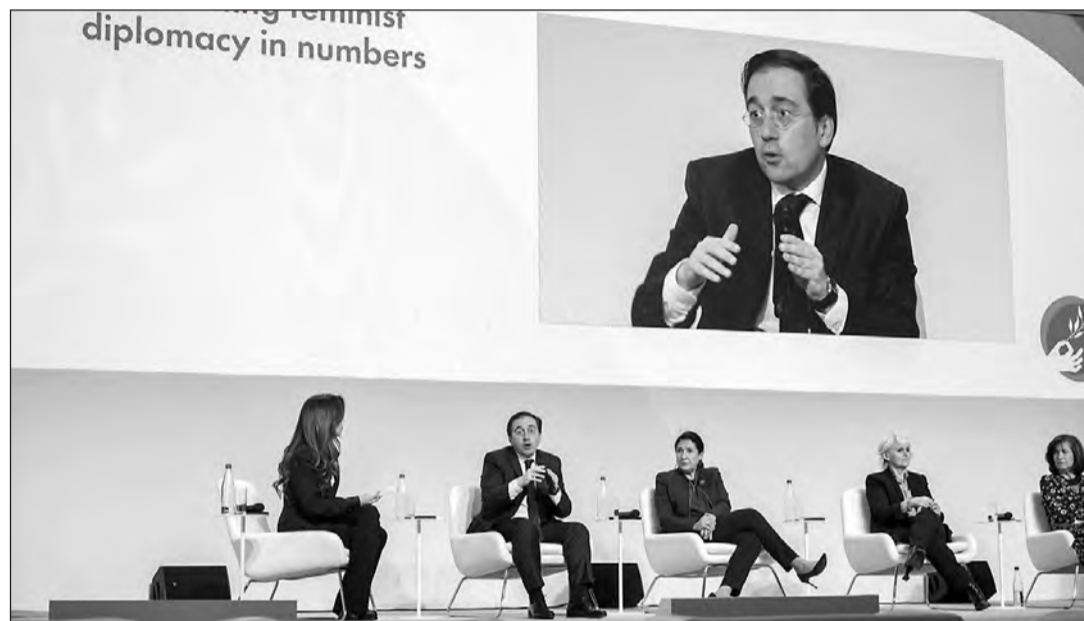
José Manuel Albares, durante su intervención en el Foro de la Paz de París.

El panel sobre diplomacia feminista en el que ha participado el ministro español se enmarca dentro de la 5ª edición del Foro de Pa-