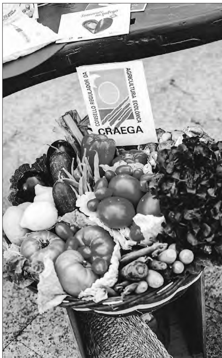
Los productos de la huerta gallega abarcan una amplia variedad de artículos necesarios para la alimentación diaria. GM