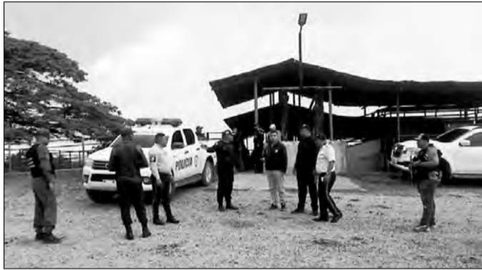
Parte del operativo policial realizado en la finca.