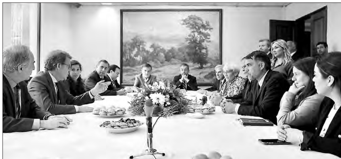
El presidente del PP, Alberto Núñez Feijóo, reunido con miembros de la coalición Chile Vamos.