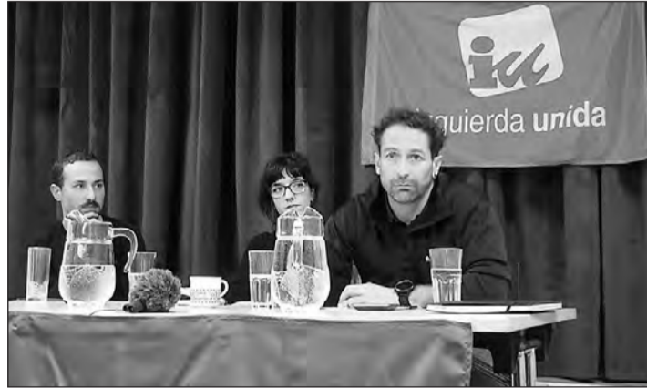
Una de las intervenciones en la Escuela de Otoño.

un cambio de tendencia y la movilización se está recuperando". Además, puso de relieve la necesidad de mantener unas estructuras fuertes, "para que nuestras organizaciones se conviertan en espacios seguros y en los que la gente pueda refugiarse en momentos duros". Además, añadió que "las sedes y espacios de IU tienen que ser algo más que salas de debate político. Tienen que convertirse en lugares para crear comunidad.