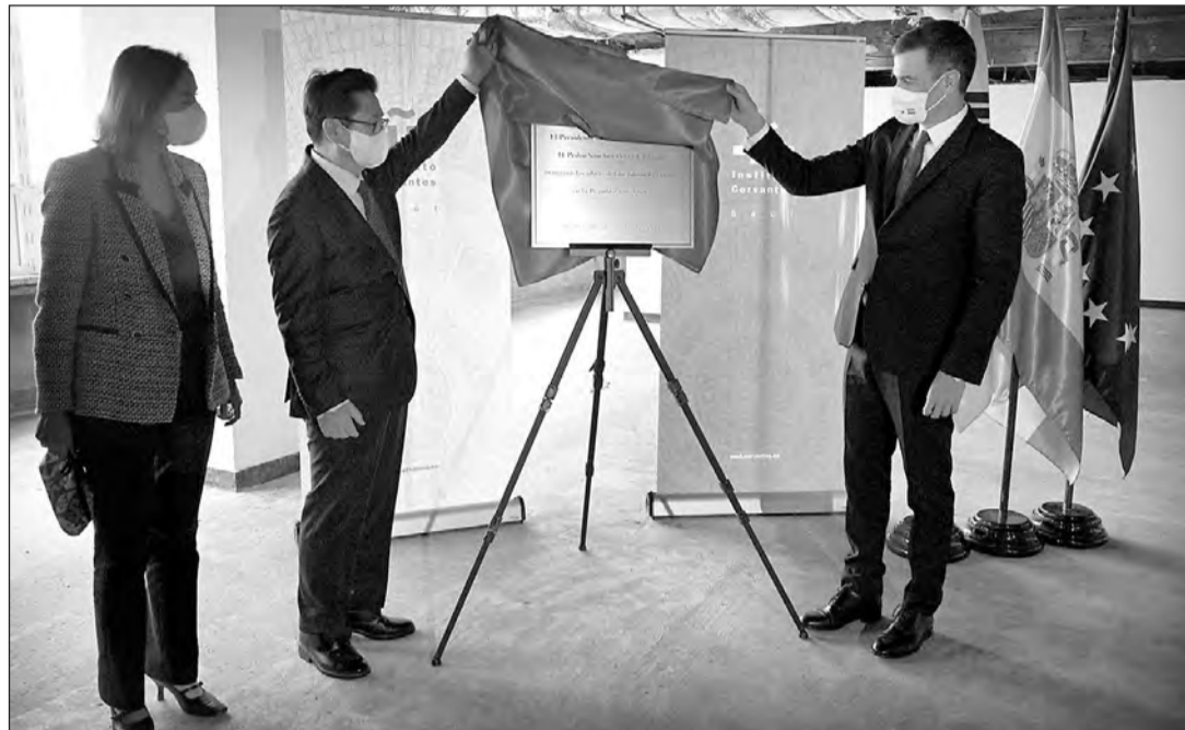
Pedro Sánchez, durante la preinauguración de la sede del Instituto Cervantes en Seúl.

Tras visitar el Cervantes, el presidente del Gobierno ha clausurado la 14ª edición de la Tribuna España-Corea, un acto organizado por Casa Asia y la Korea Foundation. Sánchez ha destaca-