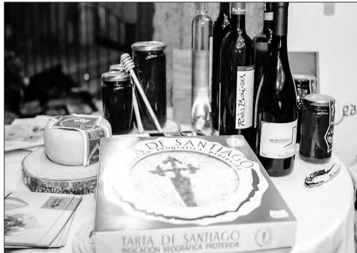
La Tarta de Santiago se puede encontrar en cualquier lugar de Galicia. GM

extiende por toda la autonomía. La apicultura constituye un elemento importante de la etnografía en Galicia, donde perviven construcciones tradicionales vinculadas a esta producción artesanal.