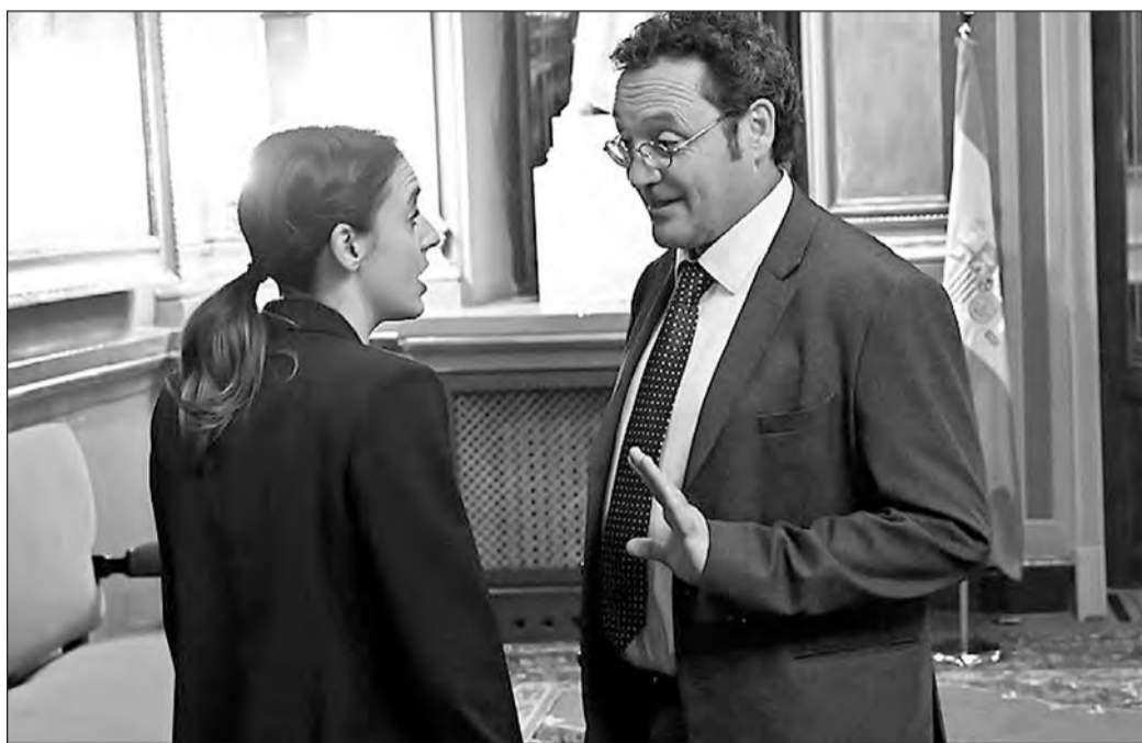
La ministra Irene Montero habla, el pasado jueves, con el fiscal general del Estado, Álvaro García Ortiz.

Con la entrada en vigor de la nueva ley, las condenas previas a su aprobación pueden revisarse y rebajarse, motivado por el principio general de que tendrán efecto retroactivo aquellas leyes penales que favorezcan al reo, y aquellos condenados por abusos con la norma anterior están pi-