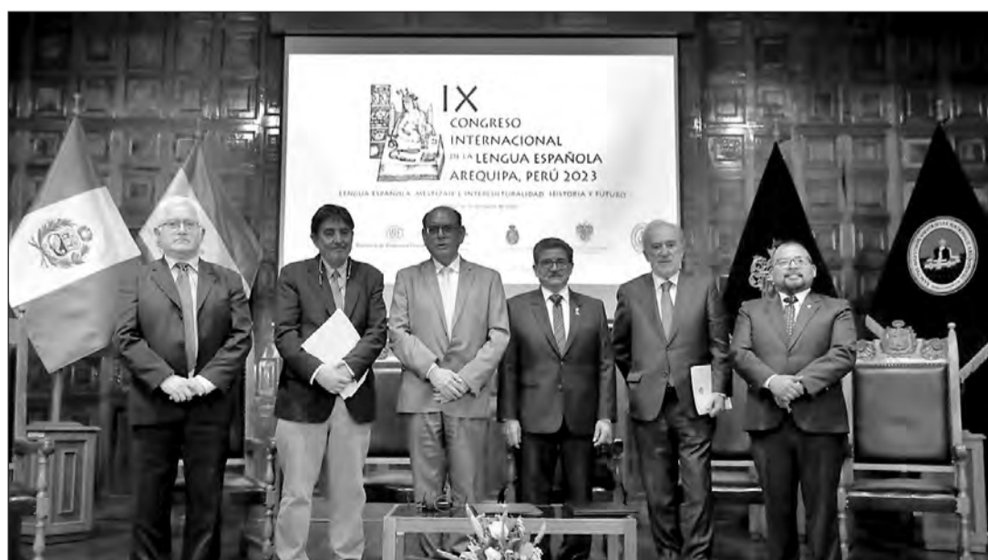
El director del Instituto Cervantes, Luis García Montero –2º por la izda.–, junto al resto de autoridades que presentaron el Congreso de la Lengua Española en la Universidad Nacional de San Agustín.

Bajo el lema ‘Lengua española, mestizaje e interculturalidad. Historia y futuro’, el congreso reunirá en Arequipa a reconocidos escritores como Sergio Ramírez, Héctor Abad Faciolince, Gioconda Belli, Santiago Roncagliolo, Jorge Volpi o Martín Caparrós. También participarán lingüistas, historiadores, pensadores, editores, creadores,