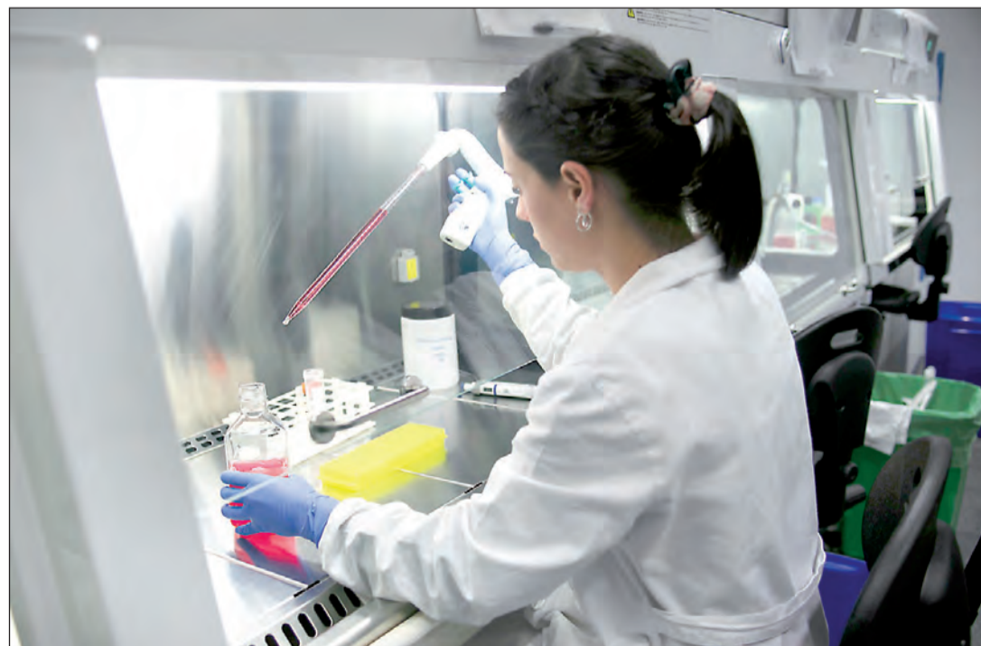
El Gobierno gallego se propone impulsar el empleo de calidad con la Rede de Polos, integrada por 12 centros.

los cambios que le afectan, con objetivo de preparar a los gallegos para poder dar respuesta a las demandas del entorno y de las actividades económicas y cubrir vacantes en áreas necesitadas de mano de obra.