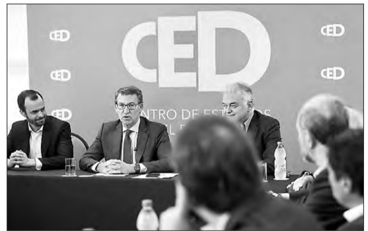
Alberto Núñez Feijóo, durante su intervención en el Centro de Estudios para el Desarrollo en Montevideo. GM

Feijóo lamentó que “somos el único país del euro que no ha recuperado el PIB prepandemia, que nuestro desempleo es el doble de la media europea y que tenemos unas cuentas públicas desordenadas, por una deuda que nos deja en una situación de vulnerabilidad”. “La responsabilidad –aseguró– consiste en no crear problemas; en dar respuestas a las preguntas de los ciudadanos; en aprovechar las oportunidades para acertar; en focalizar los puntos fuertes de un país para, apoyándonos en ellos, solventar los problemas; y en crear las condiciones adecuadas para generar confianza”, proclamó Feijóo.