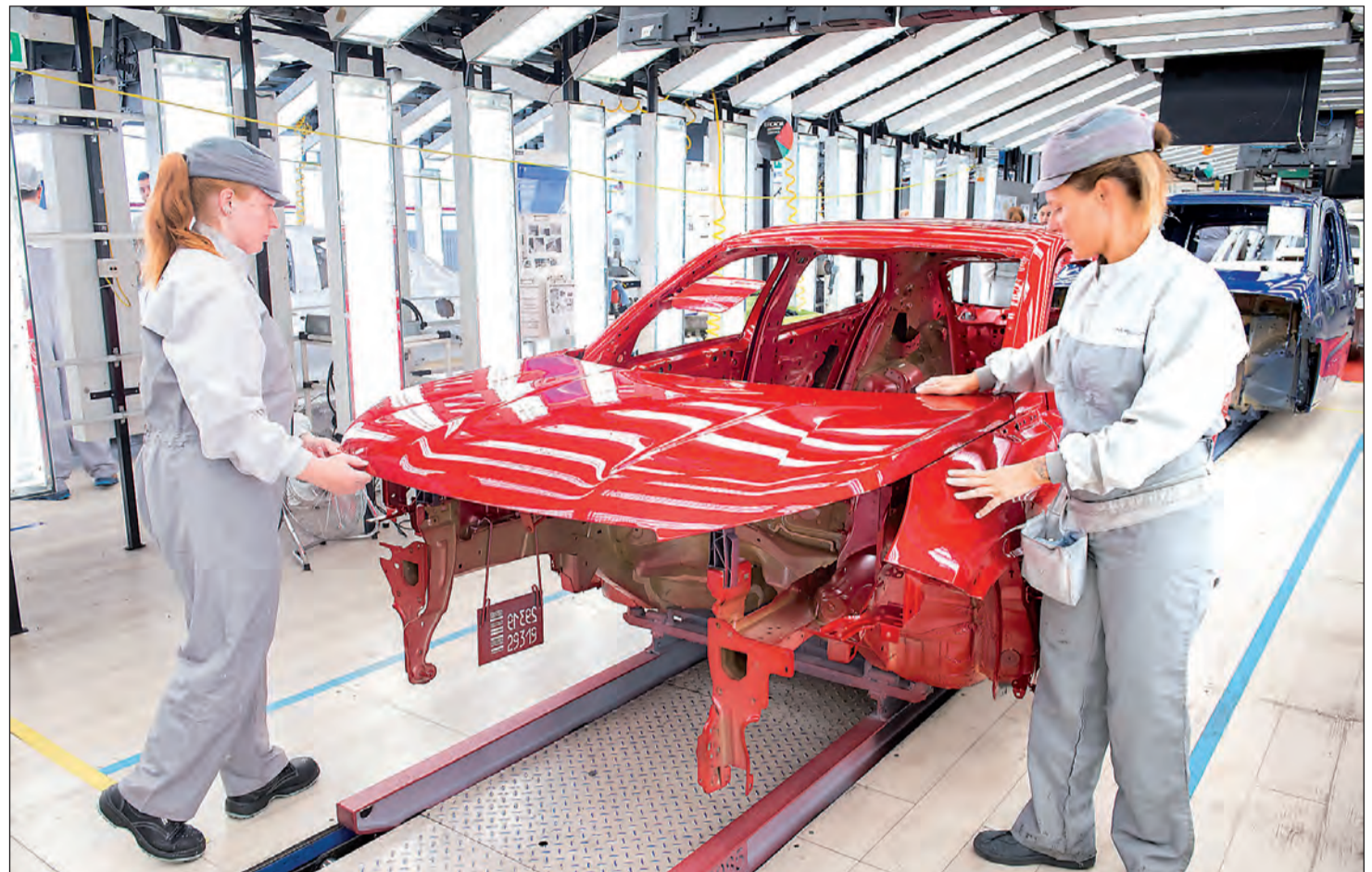
Alrededor de 25.000 trabajadores se beneficiarán del programa Impacto Autónomo, para el que la Xunta inyectará 30 millones de euros.

El apoyo al empleo no se entendería sin una formación adecuada a las necesidades del mercado de trabajo. El Gobierno gallego trabaja para adaptarla a