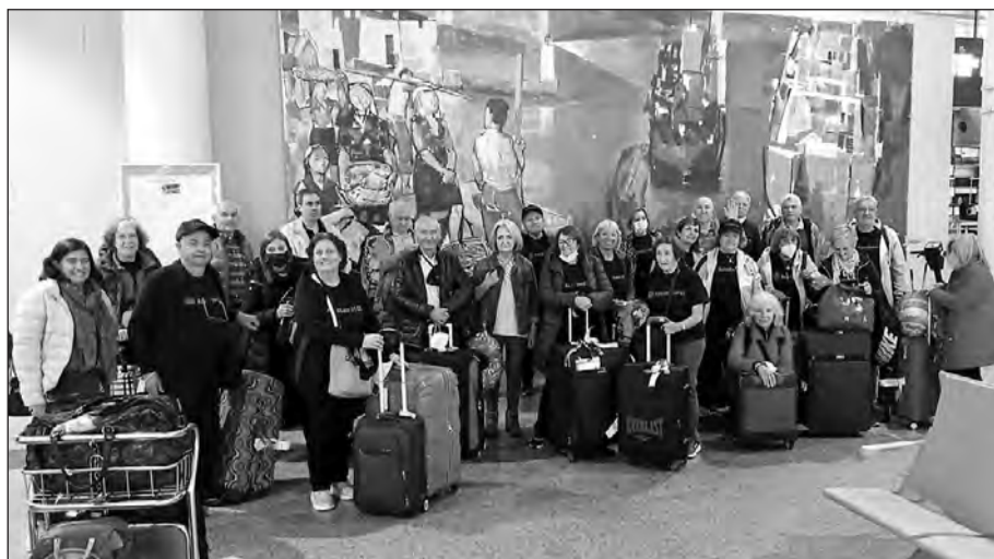
Los beneficiarios procedentes de Argentina, a su llegada al aeropuerto de Lavacolla.