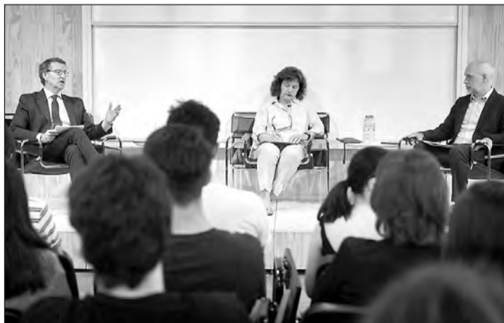
El presidente del PP y el jefe de Gobierno de la ciudad autónoma de Buenos Aires, durante la charla que mantuvieron en la Universidad.

“En España el Gobierno tiene el tic de deslegitimar las instituciones y cuando hay alguien que dice algo que perjudica al Ejecutivo, automáticamente esa institución está en contra de España y favoreciendo a la oposición”, criticó Núñez Feijóo, durante el acto organizado por el Club de Políticos en la Universidad Torcuato di