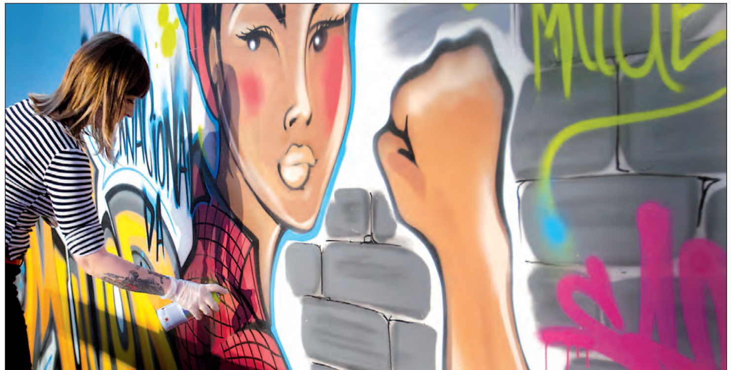
La erradicación de la violencia de género, entre las prioridades de la agenda del Gobierno gallego.

se conceden más de 1.000 ayudas cada año para que la dependencia económica del agresor no condicione a la víctima a tener que seguir con él y pueda recuperar una vida plena y libre.