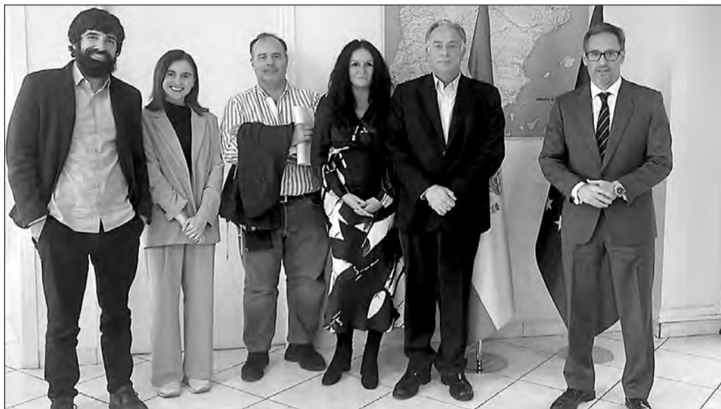
Miembros de la misión, en la reunión en la Oficina Económica y Comercial de España en Atenas.

La sociedad también asistió a reuniones donde el comprador