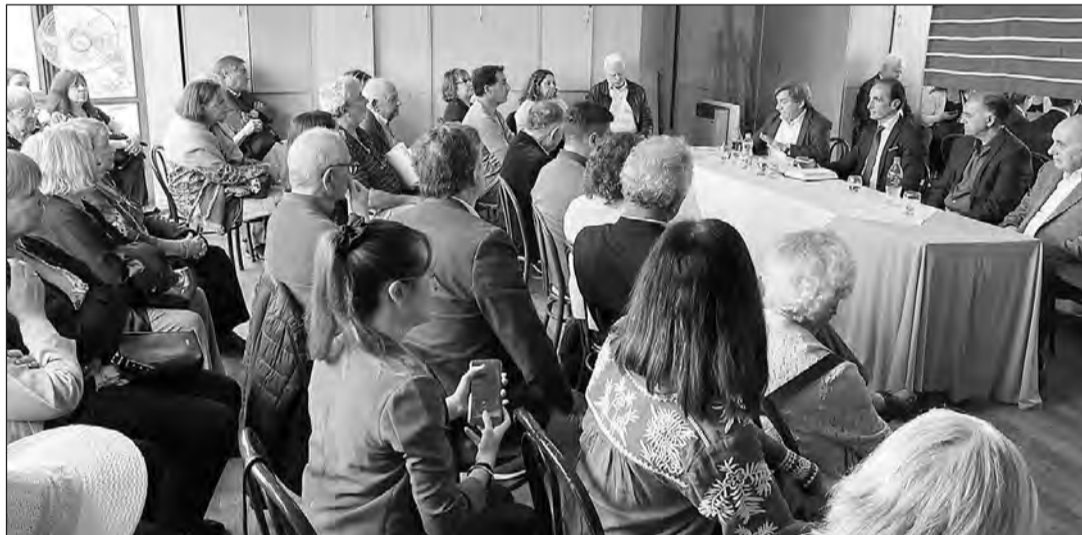
La comitiva procedente de Zamora se dirige a sus paisanos de Buenos Aires, durante el encuentro que mantuvieron.

En su paso por la capital argentina, Prieto anunció la “recuperación del programa Raíces” para posibilitar que los jóvenes descendientes conozcan la tierra de sus padres y de sus abuelos.