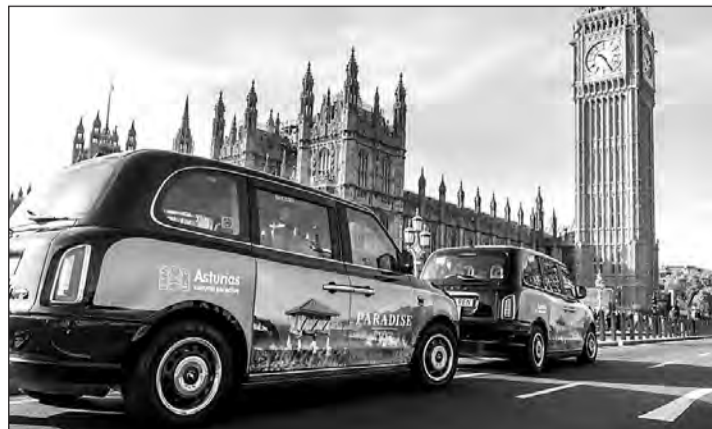
Taxis eléctricos de Londres llevaron la publicidad de Asturias.

World Travel Market es una de las principales ferias profesionales de turismo a nivel internacional y en esta edición cuenta con 700 stands y más de 2.000 expositores de un centenar de países y regiones dispuestos a mostrar su oferta en este escaparate.