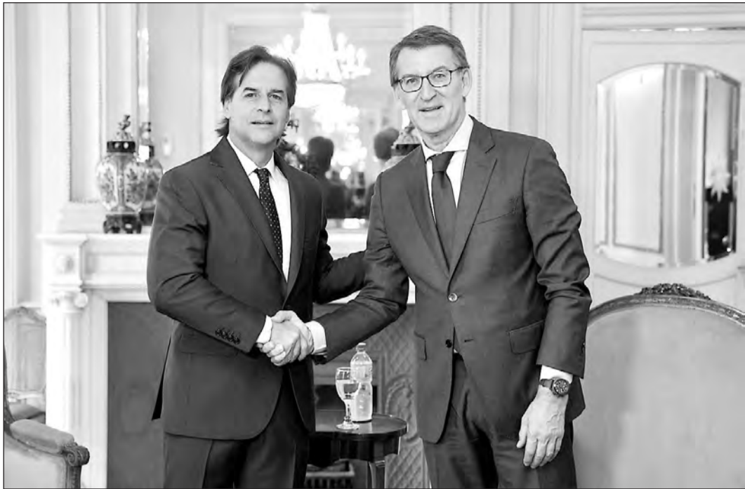
El presidente de Uruguay, Luis Lacalle, y el presidente del PP, Alberto Núñez Feijóo, durante su encuentro.

Avanzó que esta será una de las prioridades de la política exterior