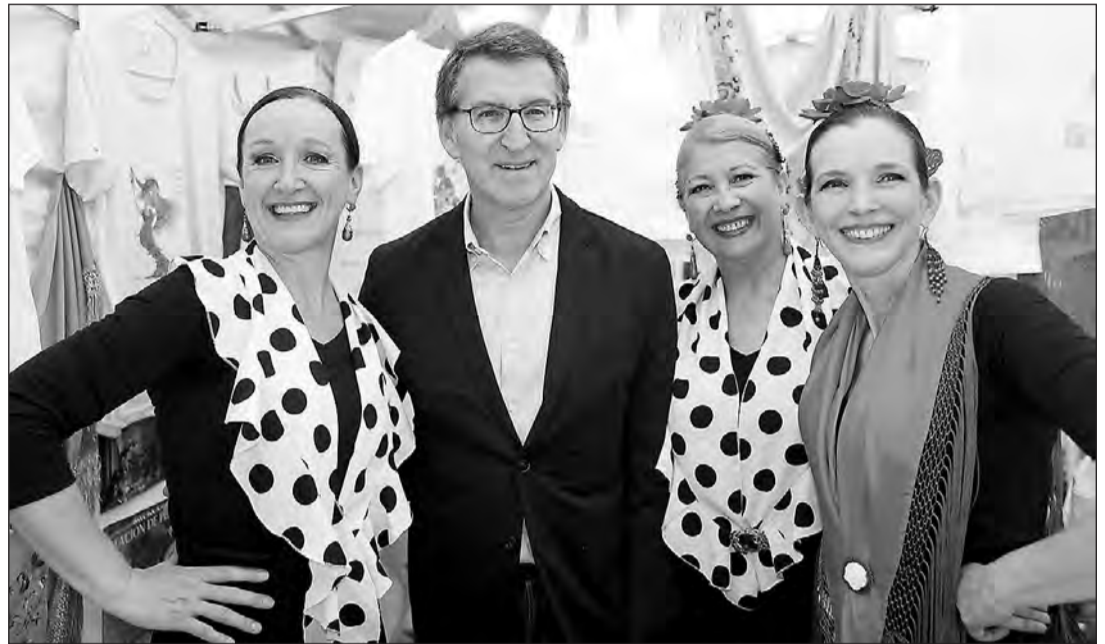
Alberto Núñez Feijóo posa junto a unas españolas en uno de los stands del ‘Buenos Aires celebra España y Portugal’.

Feijóo reafirmó el compromiso del PP con la colectividad española en Argentina, donde residen 500.000 españoles, y también con los 250.000 argentinos que lo ha-