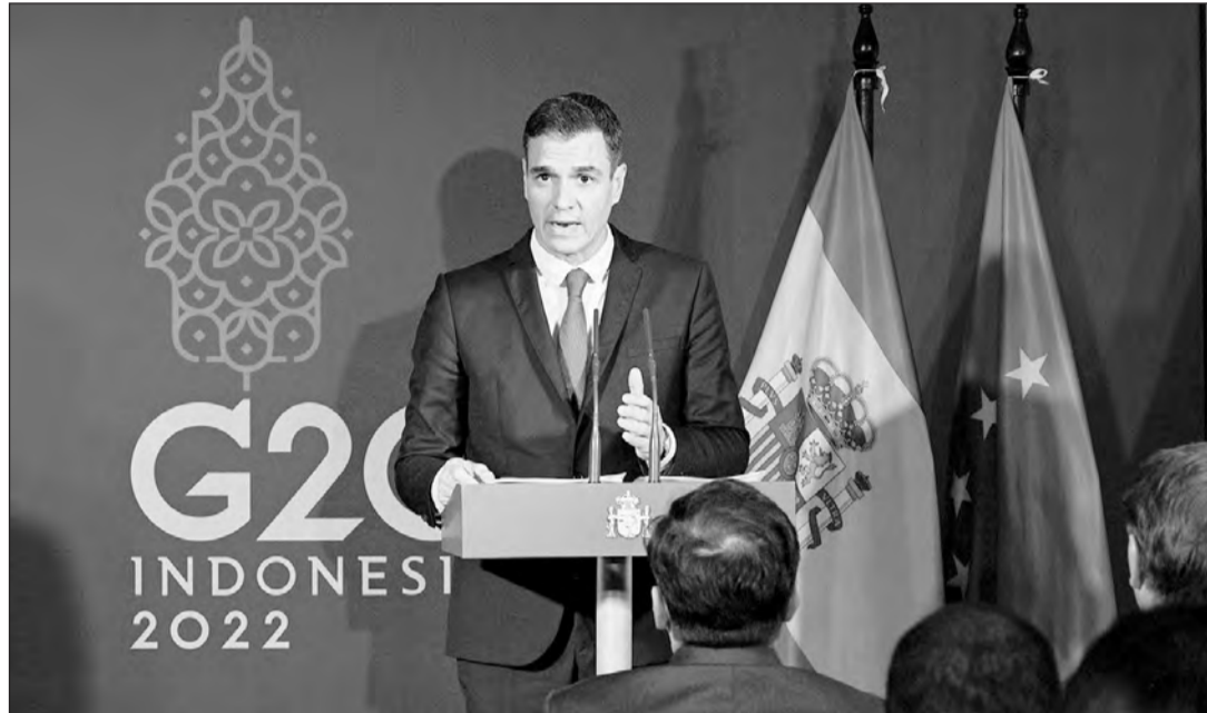
El presidente, Pedro Sánchez, durante su comparecencia tras la clausura de la Cumbre del G20 en Indonesia.

El portavoz del Grupo Parlamentario de Unidas Podemos, Jaime Asens, ha considerado que