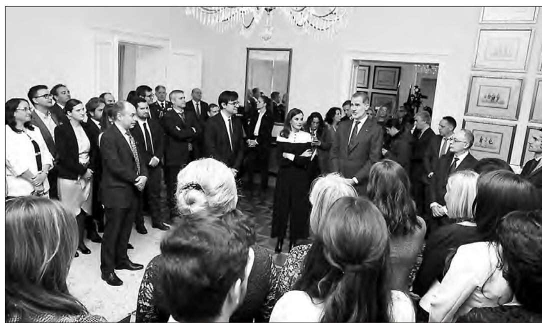
Los Reyes, durante su encuentro con la colectividad española en Croacia.

Se trata de un grupo muy heterogéneo, que incluye una gran variedad de casos, y una distribución bastante equilibrada por rangos de edad. La casuística va desde los jubilados que residen en Croacia, personas que trabajan