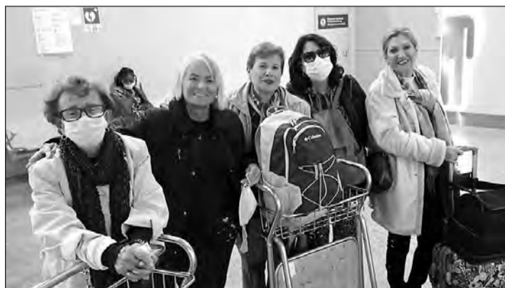
Mujeres procedentes de Brasil, en el momento de su llegada a Santiago.

La iniciativa tiene como fin que los participantes puedan actuar como agentes activos en la promoción del Camino