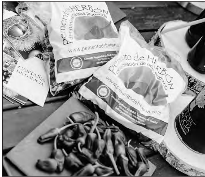
Los pimientos de Padrón están recogidos bajo la denominación de Herbón. GM

Junto a ellos, destacan las castañas, las patatas o la miel producidos en Galicia, que también cuentan con un reconocimiento especial por su calidad. En cuanto a la castaña, la zona de origen de este producto del otoño gallego abarca la mayor parte del territorio de montaña, mientras que en el caso de la Mel de Galicia, su área de producción se