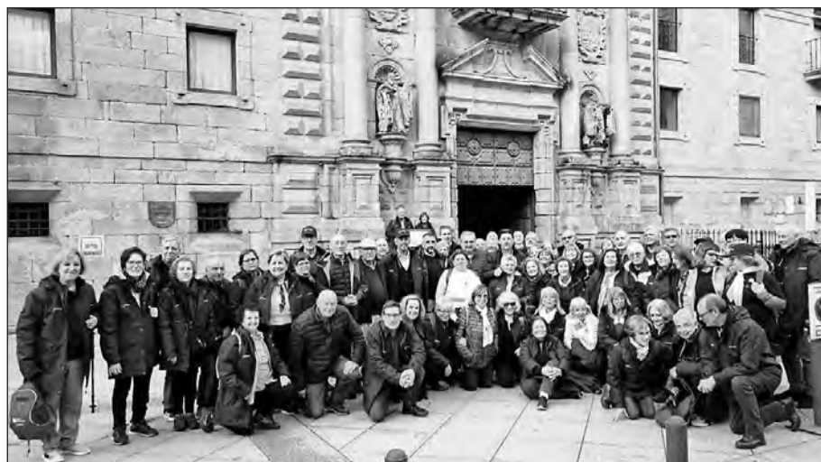
Miranda, con los caminantes que recorrieron la Vía de la Plata, en San Estevo de Ribas de Sil.

La Secretaría Xeral de Emigración volvió a centrar la convocatoria en el Año Santo compostelano