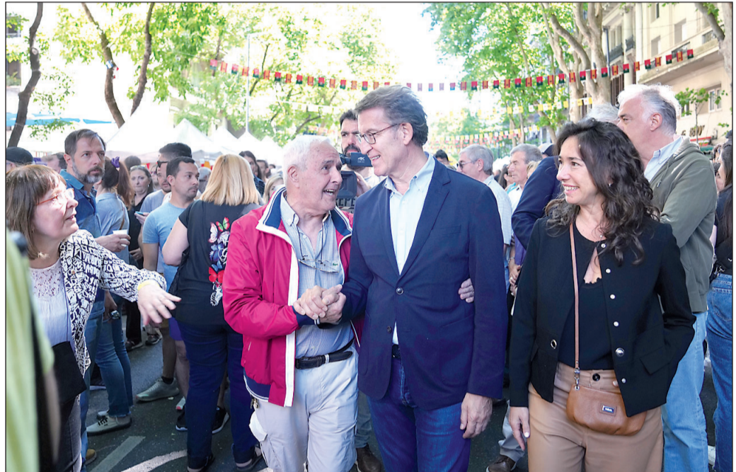
Feijóo saluda a la gente en Buenos Aires durante la celebración del 'Buenos Aires celebra España'.