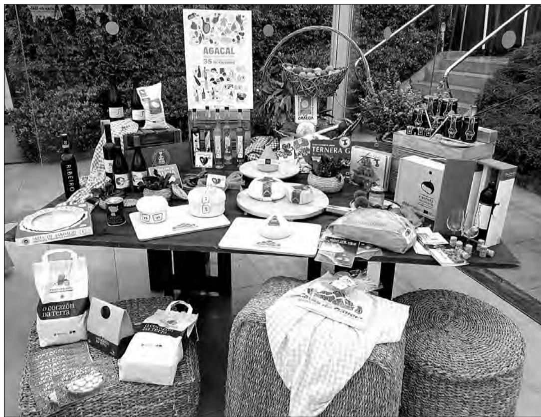
Desde quesos hasta vinos, pasando por patatas, licores o pan, entre otros, Galicia cuenta con una amplia despensa.

La comunidad autónoma destaca también por la riqueza y variedad de sus bebidas espirituosas. Las indicaciones geográficas de los aguardientes y de los licores tradicionales de Galicia protegen tanto