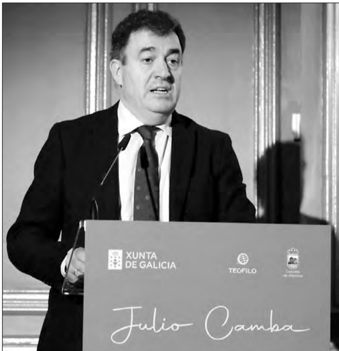
El conselleiro de Cultura, en el Hotel Palas, el pasado día 16.