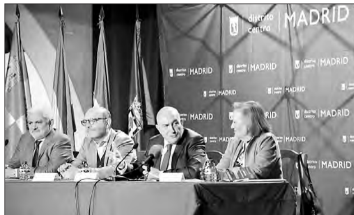
El consejero de Presidencia, en su intervención en este primer Congreso.

exterior, especialmente a los jóvenes, ofreciendo una informa-