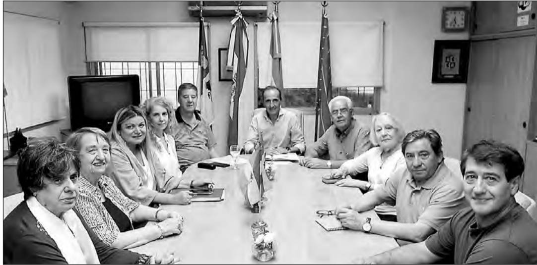
El vicepresidente de la Diputación, reunido con directivos del Centro Zamorano de Buenos Aires.

El vicepresidente de la Diputación de Zamora sostuvo que “cuando se asume una responsabilidad política, se tiene que estar presente”. “No es lo mismo el contacto mediante las nuevas tecnologías que conocerse en persona. Necesitamos el contacto humano”.