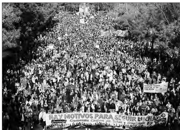
La manifestación recorrió las principales calles de Madrid.

Fruto de esa presión, la Comunidad de Madrid y el comité de huelga de los médicos de las urgencias extrahospitalarias de Atención Primaria alcanzaron el jueves de la pasada semana un acuerdo para desconvocar la