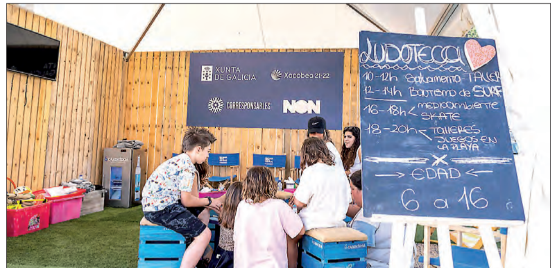
La prevención contra la violencia de género también se lleva a cabo entre los más jóvenes.

fundamental “el acceso o la reincorporación al mercado laboral en el camino de su recuperación”. En este sentido, Lorenzana recordó que la Xunta lleva años impulsando políticas para la incorporación de este colectivo al mercado laboral, con la colaboración de los ayuntamientos y enti-