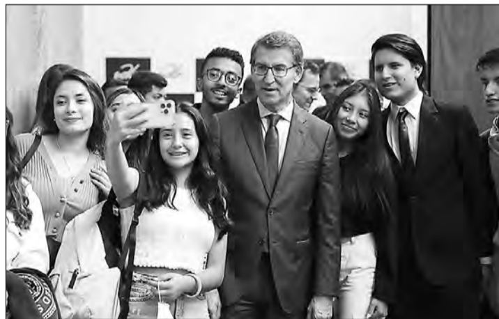
Los jóvenes universitarios de la Universidad de Las Américas, en Quito, quisieron fotografiarse con Núñez Feijóo.

Feijóo defiende que Iberoamérica debe ser una cuestión prioritaria para el Partido Popular Europeo y para el PP “como alternativa de Gobierno en España”. “Será una de mis primeras prioridades internacionales”, asegura. “La Europa y la España de hoy son consecuencia de la superación de innumerables traumas gracias al arraigo de los principios democráticos”, dice, y alerta sobre los “ataques solapa-