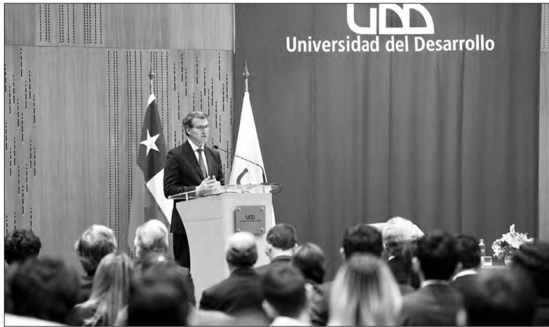
Alberto Núñez Feijóo, durante la conferencia que pronunció en la Universidad del Desarrollo de Santiago de Chile.

Explica que la estabilidad política “no guarda parentesco con la quietud o la inmovilidad” sino que “garantiza cambios que van más allá de lo superficial”. “Un auto