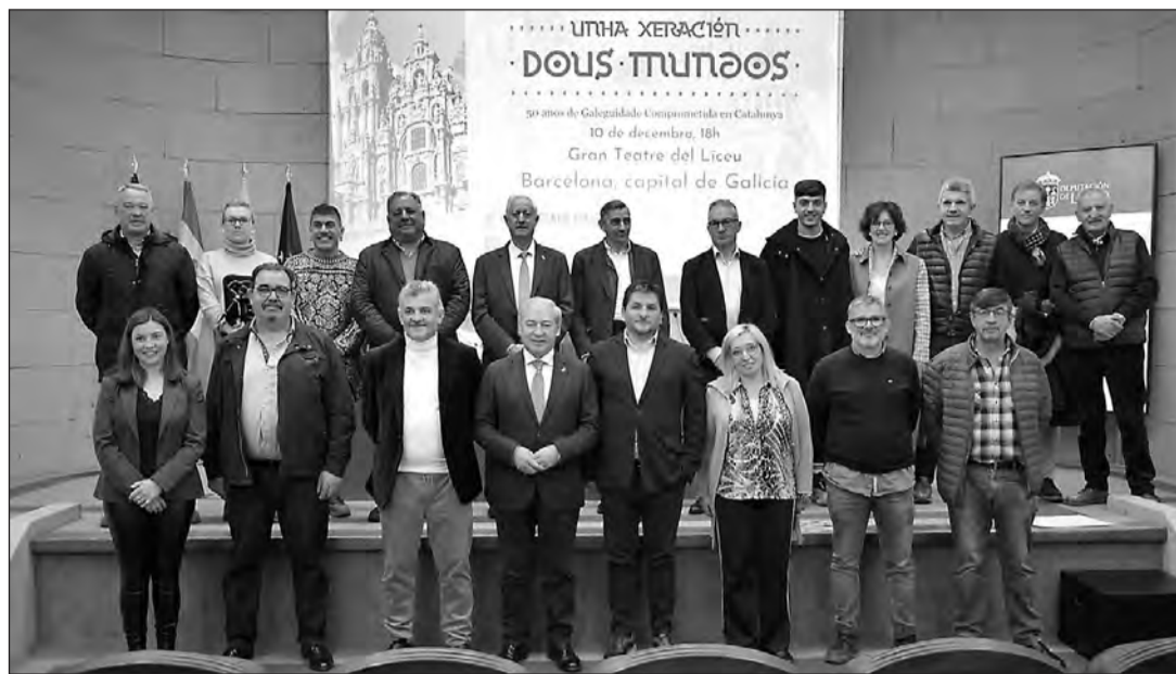
El presidente provincial posa, al final del acto, junto a diferentes autoridades y representantes de las asociaciones que agrupan a los gallegos en Cataluña.

El mandatario provincial destacó que este acto de homenaje "es muy merecido", y apuntó que será la primera vez que se organiza un homenaje de estas dimensiones a la comunidad gallega en Cataluña, por lo tanto, dijo, "estamos hablando de un hecho histórico". "Un reconocimiento a esos miles de vecinos y vecinas de la provincia de Lugo y de Galicia que tuvieron que marchar fuera para buscar un futuro mejor, algo que, desde luego consiguieron, porque hicieron mejor el futuro de la comunidad que los acogió y, con sus aportaciones, también contribuyeron de manera muy importante al desarrollo de Galicia", explicó.