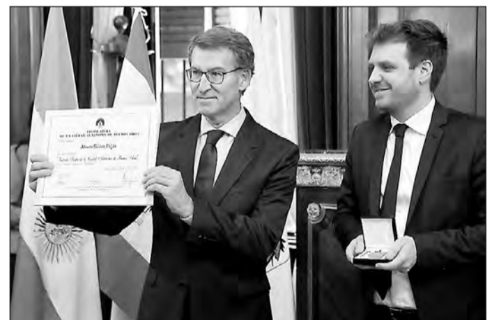
El presidente del PP muestra su diploma como ‘Visitante ilustre’ de la Ciudad Autónoma de Buenos Aires.

Durante el diálogo, Feijóo llamó a cuidar y preservar la democracia “porque las conquistas nunca son eternas” y pone como ejemplo países democráticos donde el nivel de libertad y derechos ha disminuido.