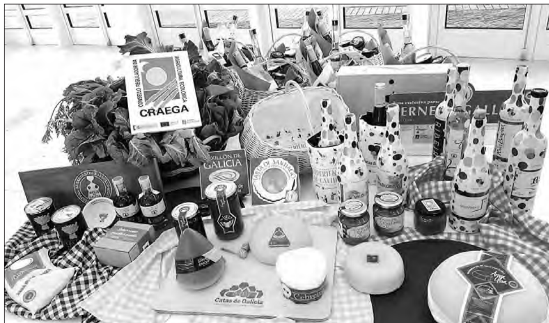
Lácteos, carnes, vinos, licores, sidra, cerveza y productos de panadería y confitería están entre los reconocidos. GM

Galicia, comunidad rica en productos artesanos alimentarios, cuenta con una normativa específica que regula la elaboración, manipulación y transformación de aquellos que lleven el sello de 'Artesanía Alimentaria'.