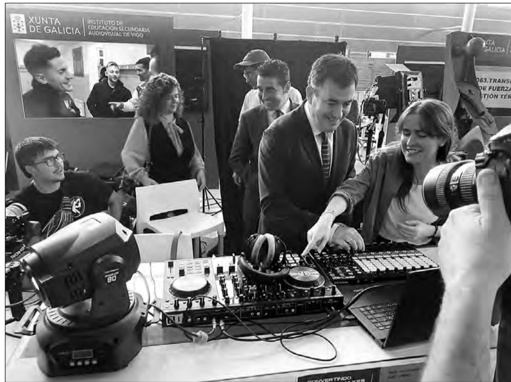
El conselleiro Román Rodríguez, durante la visita a un estudio de imagen y sonido en el salón Edugal.

Así pues, la Xunta va a seguir impulsando este modelo a través de la Estrategia Gallega de Formación Profesional, la hoja de ruta dotada con más de 900 millones de euros hasta 2024 para la puesta en marcha de acciones específicas encaminadas a la mejora de la oferta, a la modernización de la red de centros y al refuerzo de la rela-