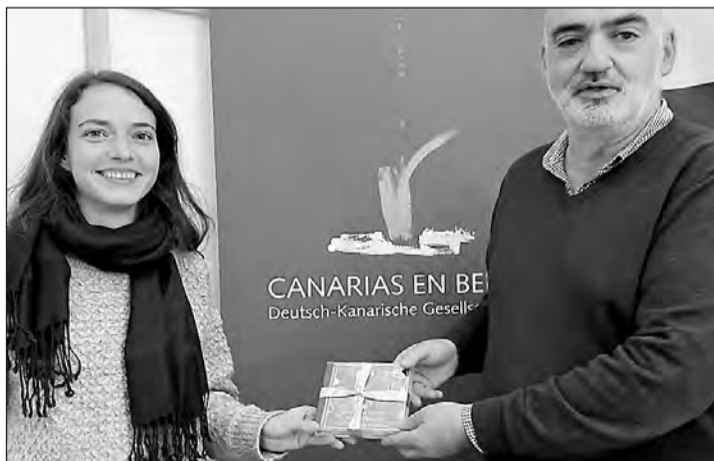
El presidente y la vicesecretaria, durante la Asamblea.