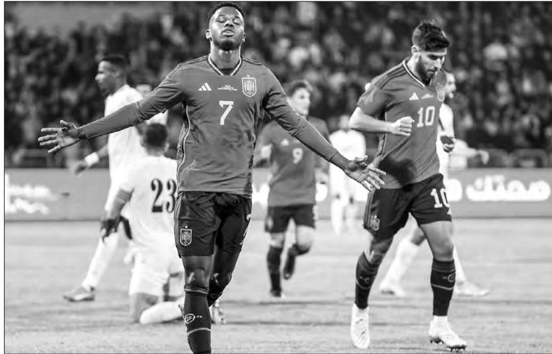
Ansu Fati celebra su gol, el primero de la selección ante Jordania.

INCIDENCIAS: encuentro amistoso en el Estadio Internacional de Amman ante 20.000 espectadores.