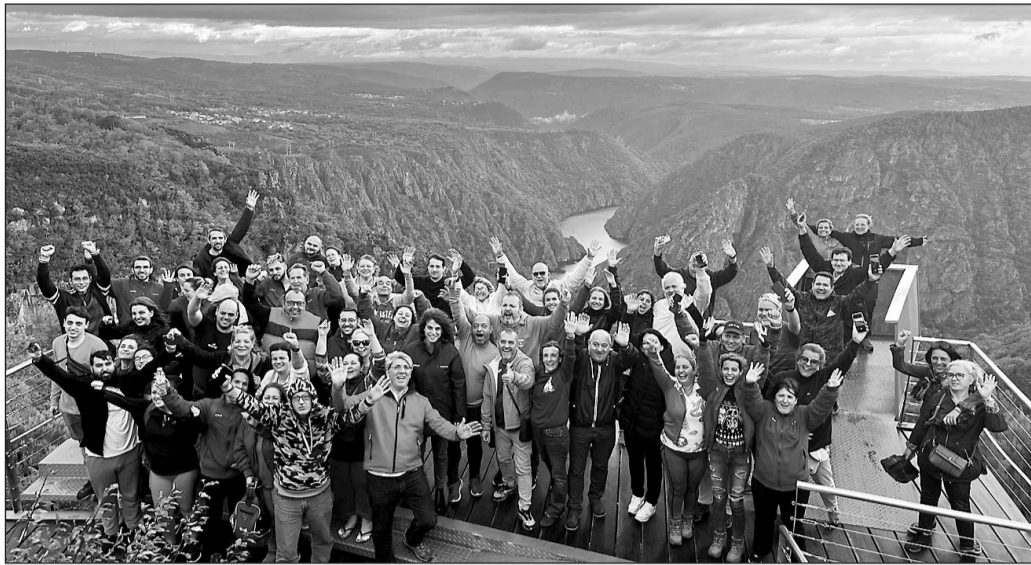
Los participantes en el programa de este año, en la Ribeira Sacra.