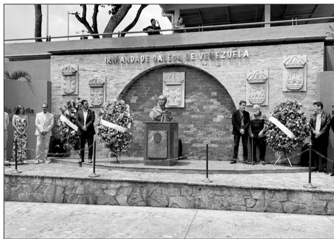
Autoridades y directivos participaron en la ofrenda floral.

Alrededor de las ocho de la tarde se dio paso a los asistentes a la pista techada, la cual ya tenía todo listo para encender la noche de celebración, y así lo hizo la agrupación 'Swing Music', que amenizó un par de horas al público con diversos te-