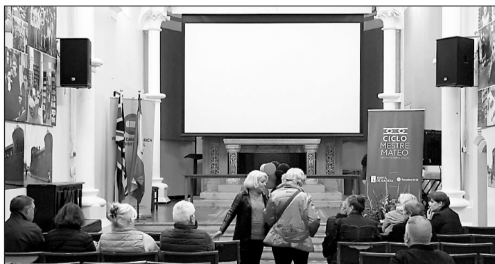
Proyección en Londres de la película 'Malencolía'.

El Ciclo Mestre Mateo acercó en octubre a los centros gallegos del exterior la película 'Malencolía'. El ciclo, fruto de la colaboración de la Secretaría Xeral de Emigración, la Academia Galega do Audiovisual y las propias entidades gallegas que participan en el mismo, tiene como objetivo acercar a los gallegos del exterior los documentales y filmes premiados en la última edición de los premios del cine de Galicia.