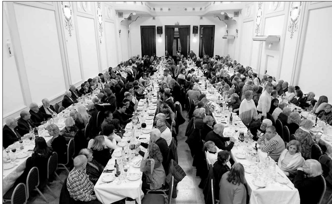
El Centro Salamanca de Buenos Aires conmemoró su centenario con un almuerzo.

El segundo puesto es ocupado en la mayoría de los casos por el país galo, mientras que el tercero se reparte entre Francia, Alemania, Brasil, Cuba o México.