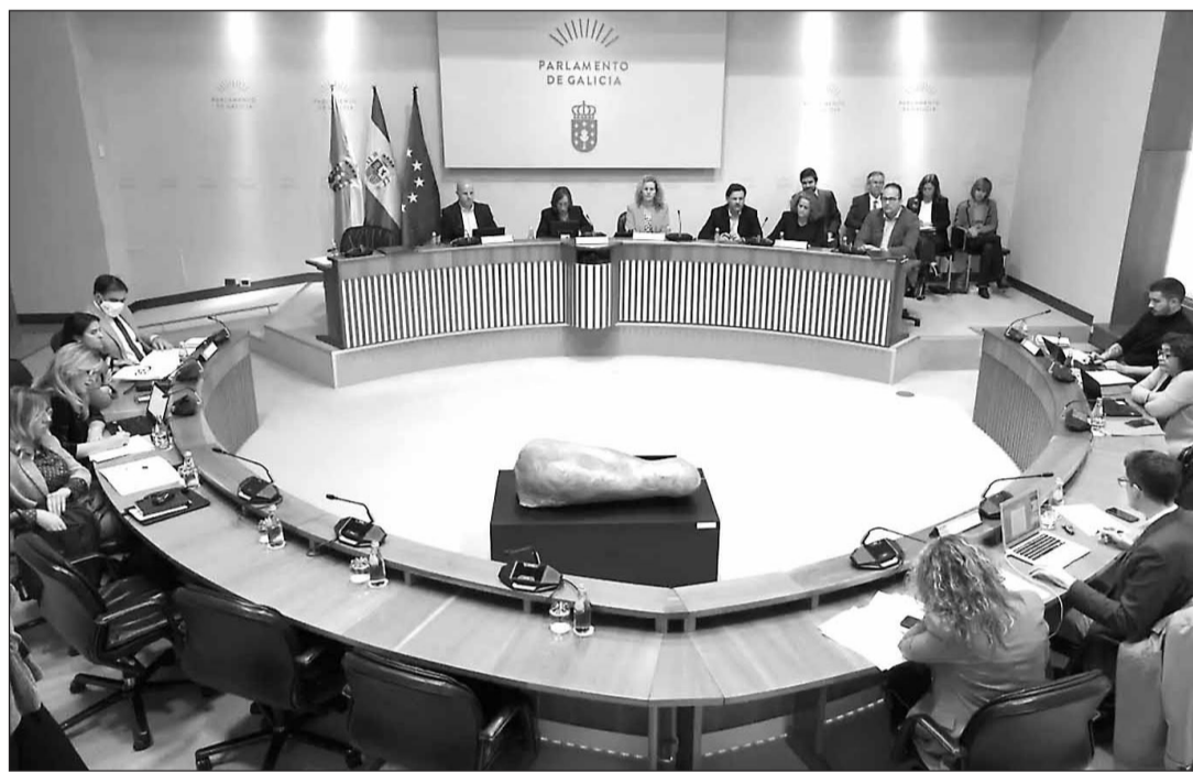
El presidente Alfonso Rueda, en la reunión en Buenos Aires con los representantes de 41 entidades gallegas.

En estos presupuestos también se continuarán apoyando las actividades formativas y culturales de los centros gallegos en el exterior con 2,35 millones de euros y las ayudas sociales de carácter individual y de emergencia social, dirigidas a ciudadanos gallegos en situación de precariedad económica con 3,6 millones, un presupuesto, este último, que crece un 29% más con respecto a 2022. Y en cuanto a las partidas destinadas al funcionamiento y las mejoras de las entidades gallegas del exterior, se mantiene el presupuesto del año pasado, que ya había crecido de manera exponencial para paliar las necesidades surgidas durante la época de pandemia, en especial, entre los centros dedicados al trabajo asistencial con los gallegos con mayores demandas del exterior.