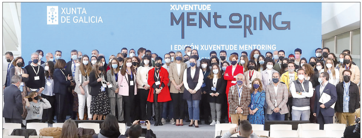
La conselleira de Política Social e Xuventude, Fabiola García, en un acto con los jóvenes y mentores de la primera edición.

En estos momentos se está llevando a cabo la segunda edición de este programa y está aprobada la tercera con una inversión de 500.000 euros cada una, cofinanciados por la Iniciativa de Empre-