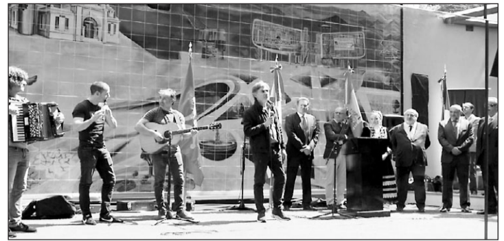
Un momento del acto que se llevó a cabo en la sede de la Asociación.

Durante la reunión entre el diplomático español y los responsables municipales se puso de manifiesto que se espera próximamente suscribir un acuerdo de hermanamiento entre la Administración Distrital y el Ayuntamiento de Madrid.