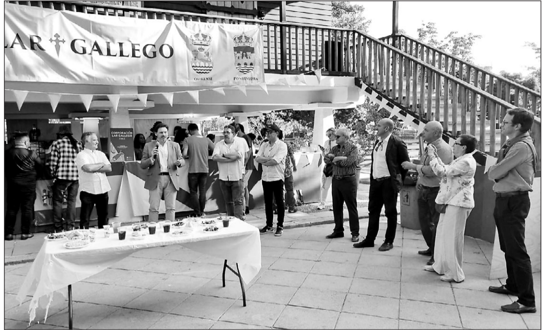
El secretario xeral de Emigración se dirige a los asistentes al acto de aniversario del Lar.