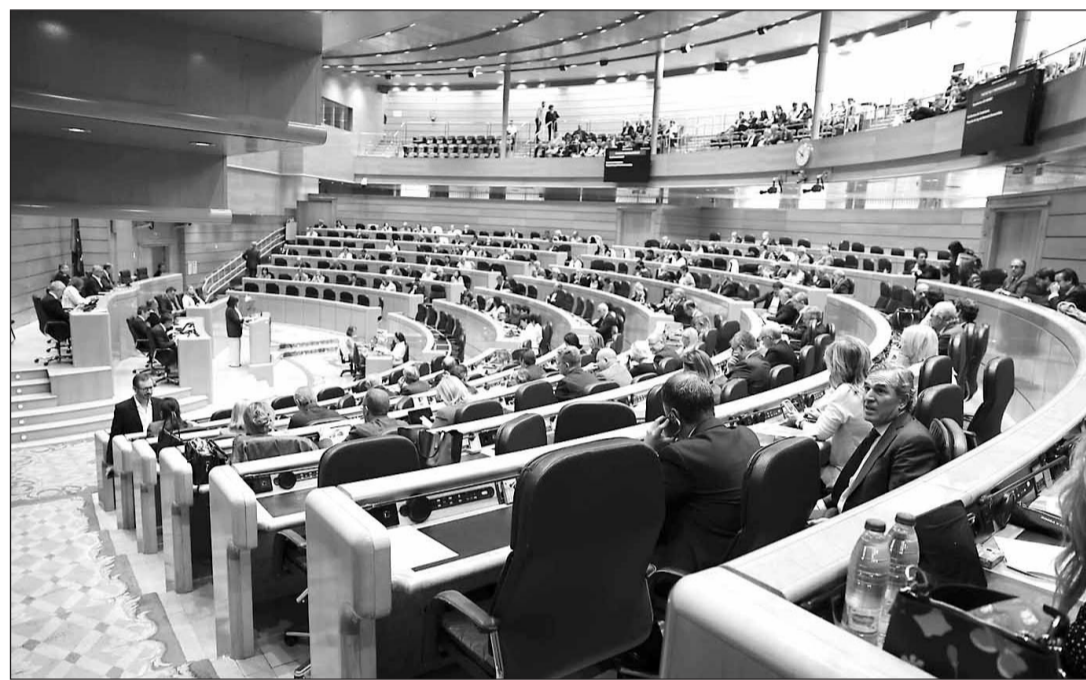
Debate de la Ley de Memoria Democrática en el Senado, celebrado recientemente.

Los interesados en obtener la nacionalidad española deberán presentar una solicitud mediante los modelos normalizados que se pueden obtener de manera telemática en las páginas web de los ministerios de Justicia y Exterio-