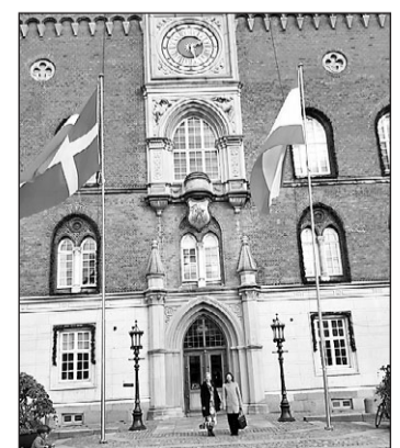
Entrada principal del edificio.