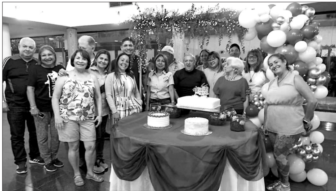
Miembros de la Junta Directiva, Comité de Damas, expresidentes y socios del Centro Gallego, en el 62º aniversario.

Durante el ágape, en el que también celebraron el día de la Hispanidad, los comensales pudieron disfrutar de platos típicos