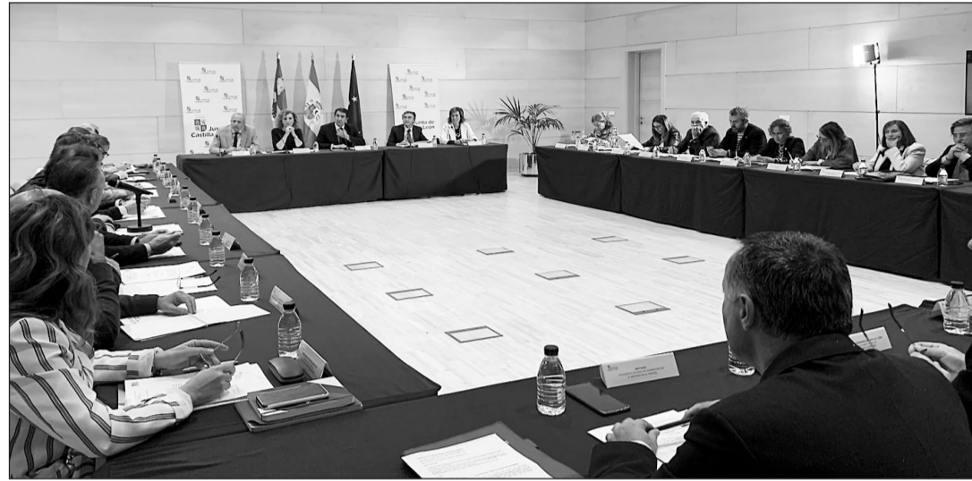
Miembros del Consejo de Dinamización Demográfica, durante su primera reunión.

El resto de las Consejerías de la Junta estarán igualmente representadas en este Consejo, así como la Administración General del Estado, la Federación Regional de Municipios y Provincias, las organizaciones sindicales y empresariales más representativas, las organizaciones profesionales agrarias, las federaciones