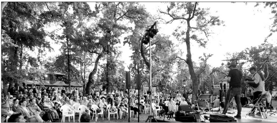
Anxo Lorenzo, durante su concierto con motivo del aniversario del Lar Gallego.