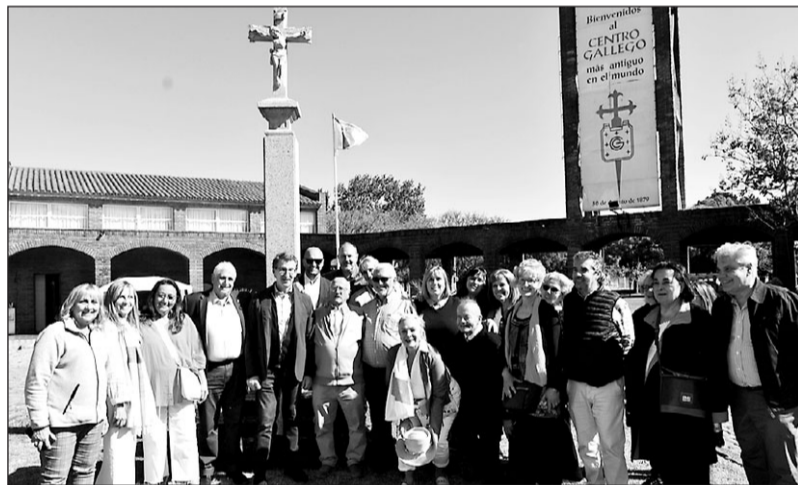
Alberto Núñez Feijóo posa junto a directivos del PP locales y simpatizantes en el Centro Gallego de Montevideo.