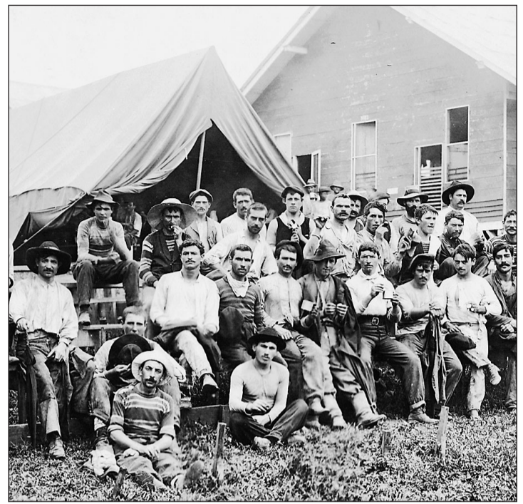
Un grupo de gallegos que trabajaron en el Canal de Panamá.

en el de Montevideo, en el Lar Gallego de Sevilla y en el Centro Galicia de Buenos Aires, así como en la Hermandad Gallega de Venezuela.