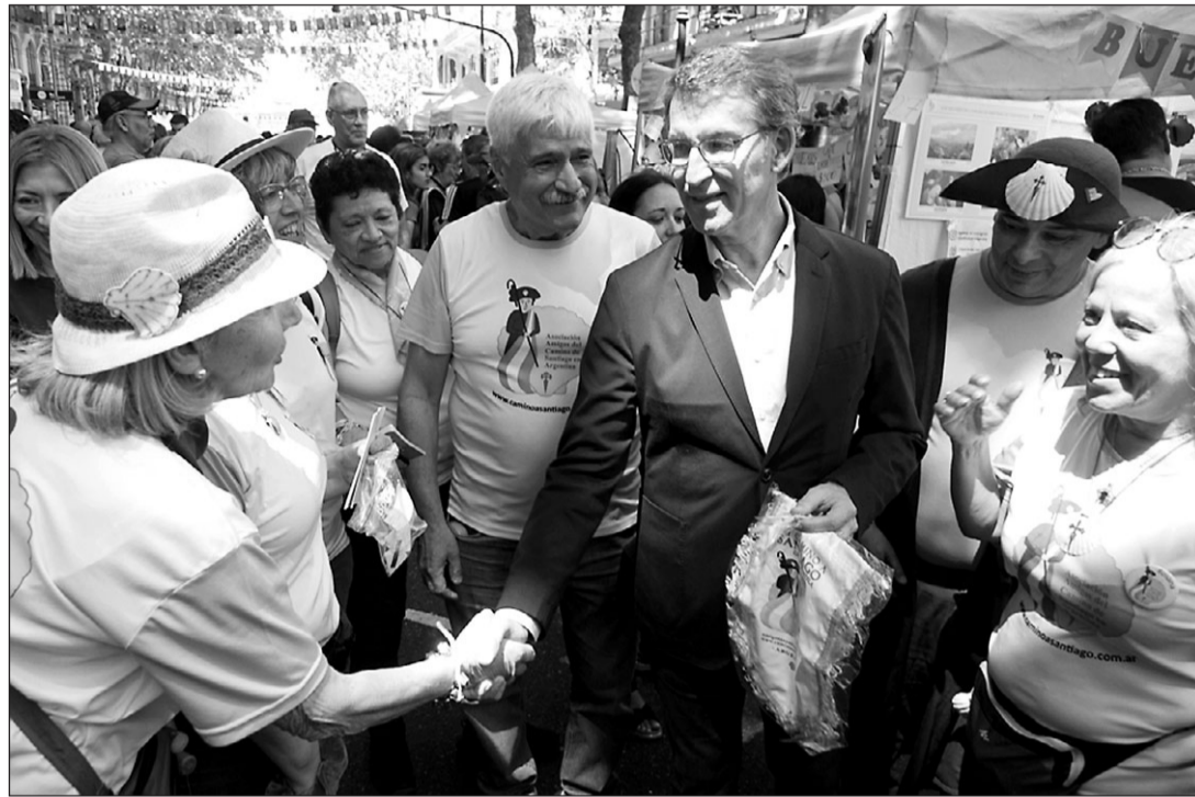
Feijoo saluda a un grupo de personas durante el Buenos Aires celebra.

"Nuestra propuesta -avanzó- es abrir un contexto de negociación para desembocar en una ley específica para recuperar la nacionalidad, en lugar de esta ley ideológica que reabre los rencores de la guerra civil, con la que el Gobierno espera recolectar votos".