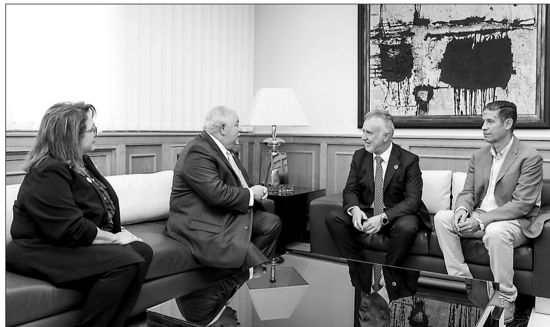
El presidente conversa con los representantes de la Asociación de Descendiente de Canarios en Texas.

conserva vestigios de los canarios que formaron parte de su historia, como es el caso de la Catedral de